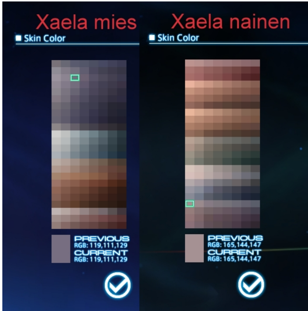
Kuvio 3. FFXIV:n Au Ra Xaela hahmojen ihonvärien erot