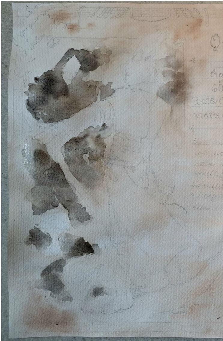
Kuvio 6. Hirviön pohjavärit

Kun sain hirviön kasvot ja kynnet valmiiksi, aloitin Qaran maalaamisen. Työstin molempia piirustuksia samaan aikaan, koska ne käyttivät paljon samoja värejä, joten se nopeutti työtä huomattavasti. Maalien kuivuessa jatkoin myös hirviön sekä kristallien maalaamista. Lopuksi tein kuulakärkikynällä ja mustalla värikynällä yksityiskohtia sekä pieniä korjauksia (kuvio 7).