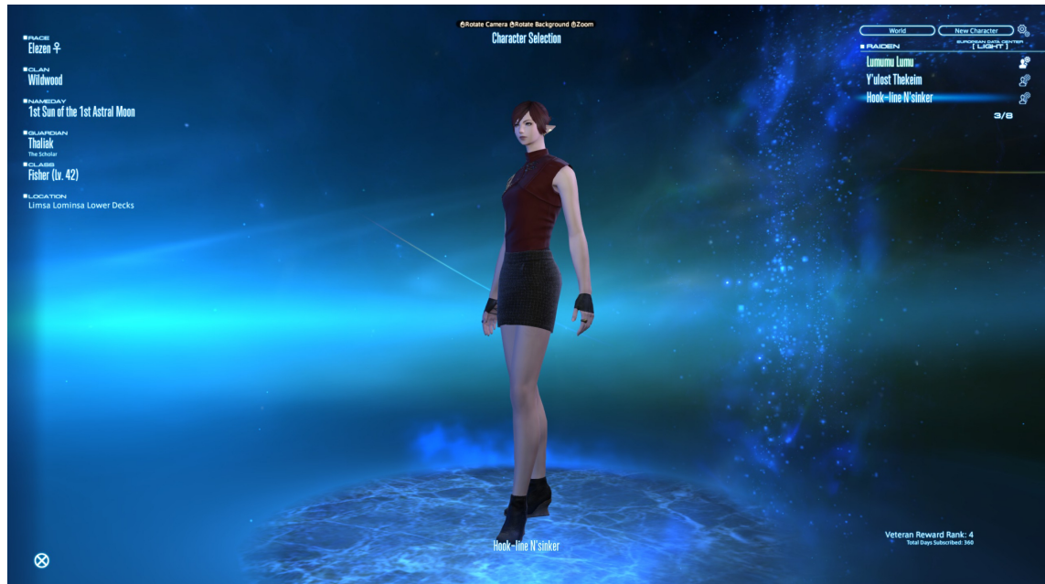
Kuvio 1. Hahmon valintaruutu

valintaruudussa valitsee yhden, jolla kirjautua sisään itse pelimaailmaan (kuvio 1). (Final Fantasy Wiki 2025a.)