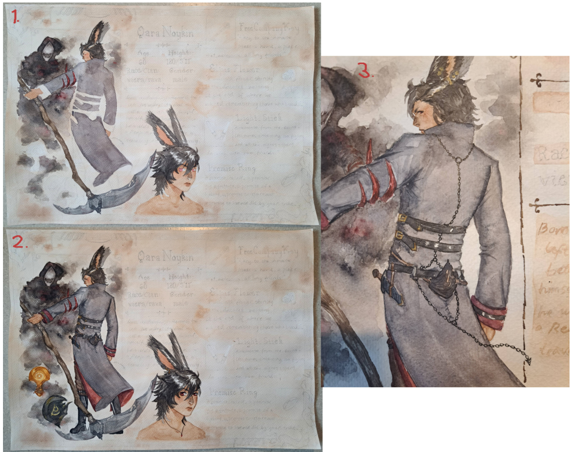
Kuvio 7. Maalauksen edistyminen

Tämän jälkeen siirryin tekstiin ja esineisiin. Ensin maalasin pohjalle värit erottamaan eri laatikot, jonka jälkeen aloitin tekstin maalaamisen. Ensin tein otsikot ja sitten muun tekstin (kuvio 8). Halusin nimen erottuvan, joten maalasin sen taustan viininpunaiseksi, koska se sopii yhteen Qaran silmien värin sekä vaatetuksen kanssa. Keskimmäisen tekstin jätin haaleaksi, mutta erotin taustavärin muista laatikoista. Esineille ja Qaran kokokuvalle maalasin kehukset, jotta ne erottuisivat paremmin. Tein myös keskelle teosta tekstien väliin jakajia koristeeksi (kuvio 8). Korvakorut ja sormuksen reunat koristelin kultaisella kimalletussilla.