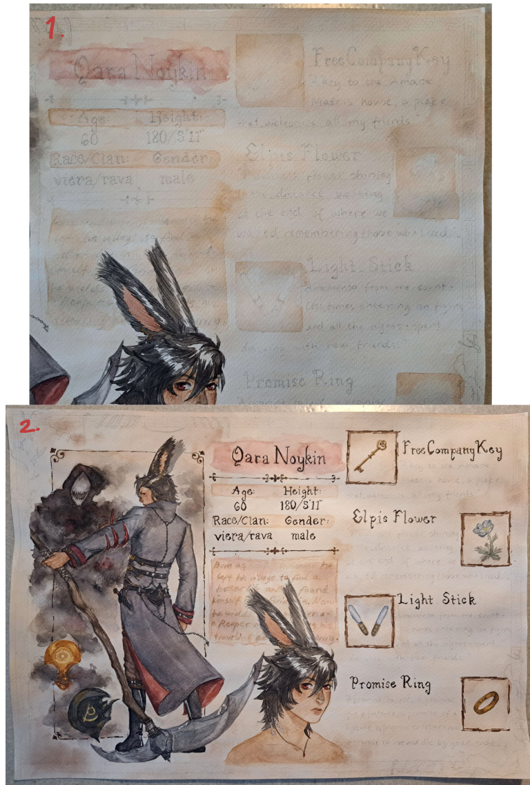
Kuvio 8. Taustan ja tekstin edistyminen

Tämän jälkeen oli vain tekstiä ja reuna koristeet jäljellä. Tekstin kirjoitin normaalisti pienellä siveltimellä. Reunoihin tein ensin köynnökset sekä kasvit ja sen jälkeen kiveyksen, johon tein rakoja mustalla värikynällä. Tiputin maalaukseen myös maalitippoja, joiden on tarkoitus muistuttaa läikkynyttä mustetta ja tuoda lisää vanhan kuvituksen tunnelmaa. Viimeistelynä poltin paperin reunoja (kuvio 9). Poltin myös itse maalausta keskimmäisen laatikon kohdalta, missä Qaran alkuperäinen nimi olisi, ikään kuin se olisi peitetty tai poltettu pois tarkoituksella.