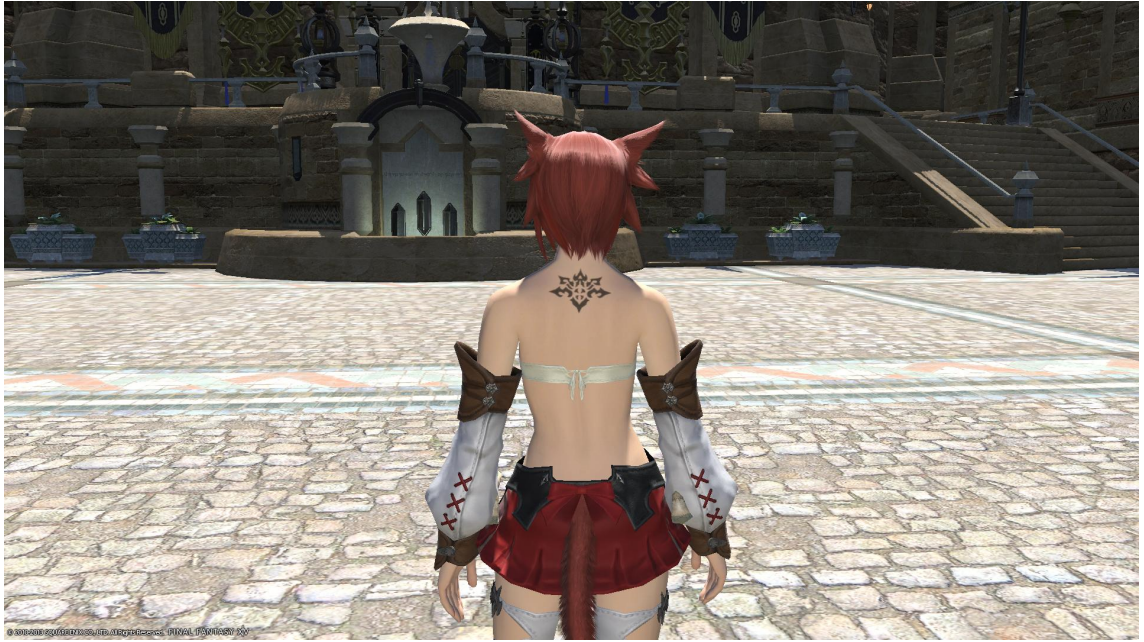
Kuvio 2. Perintöhahmon tatuointi