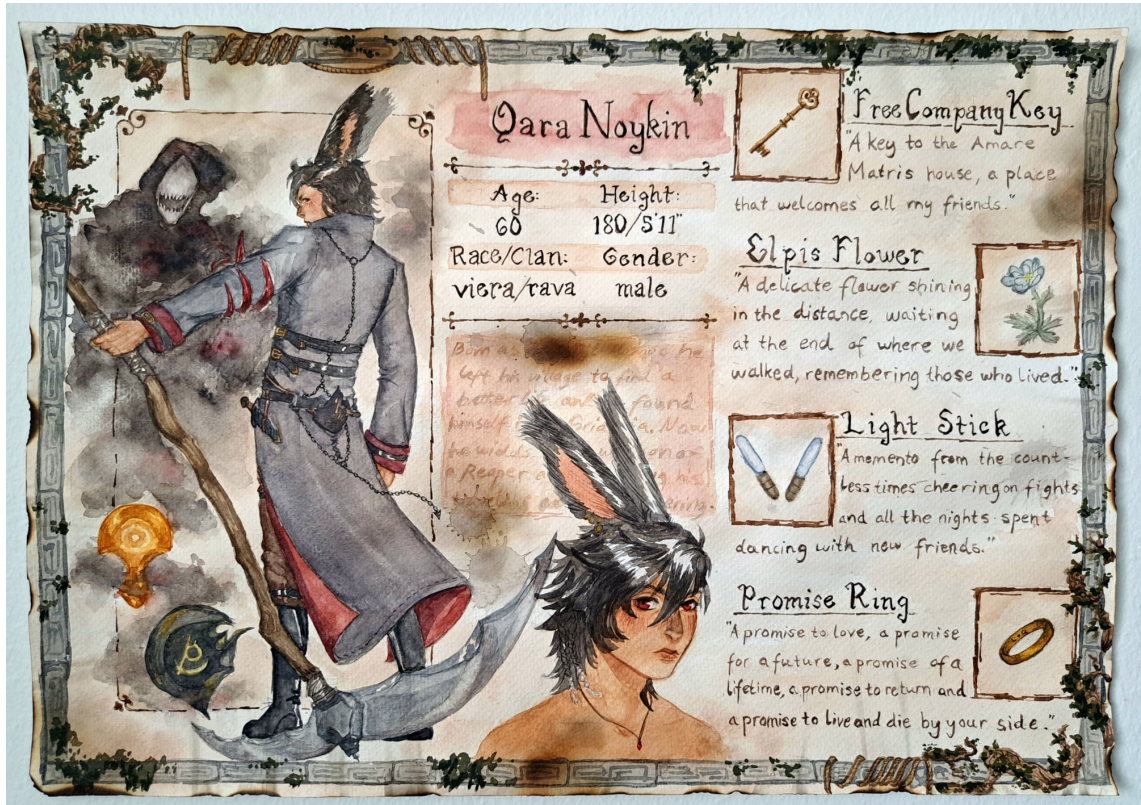
Kuvio 9. Valmis teos