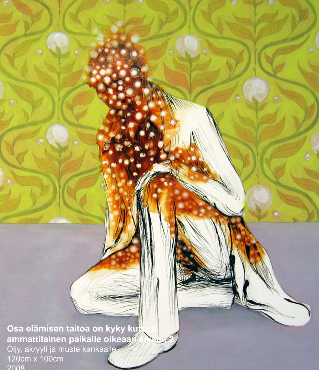
Osa elämisen taitoa on kyky kutsua ammattilainen paikalle oikeaan aikaan.

Ölly, akryyli ja muste kankaalle 120cm x 100cm 2008