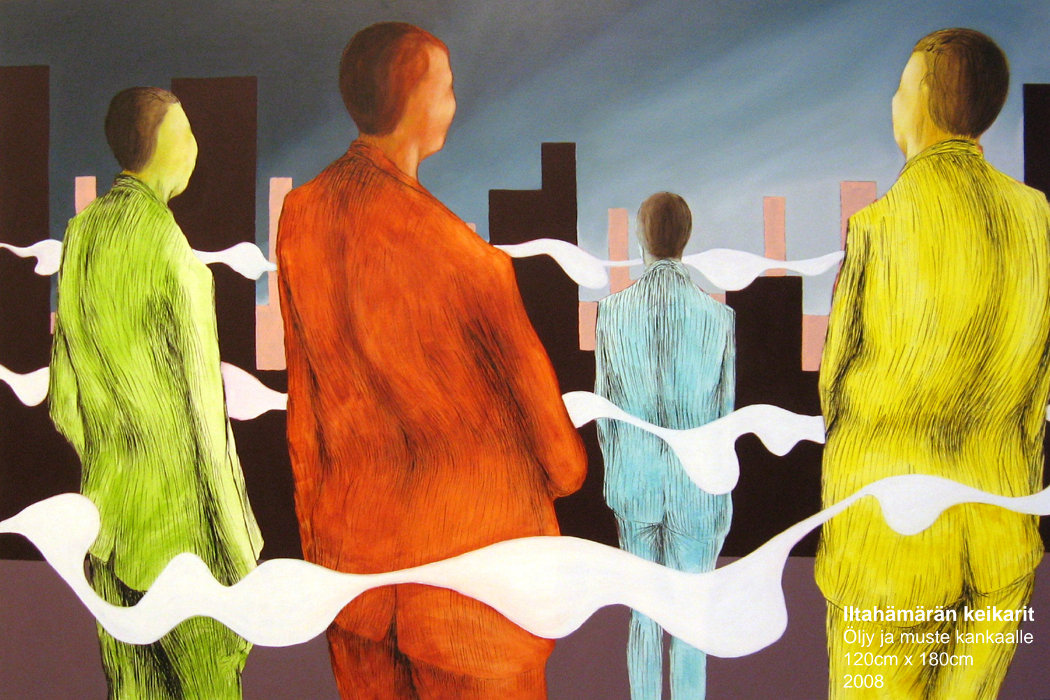
Iltahämärän keikarit Öljy ja muste kankaalle 120cm x 180cm 2008