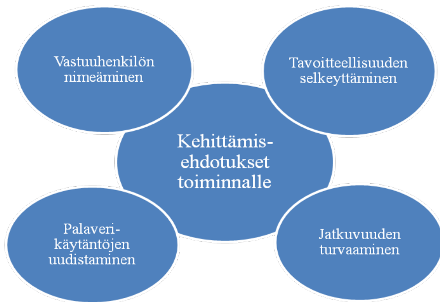
KUVIO 5. Kehittämissuhteet toiminnalle