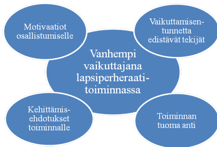
KUVIO 1. Vanhempi vaikuttajana lapsiperheraatioinnissa

”No kyllähän varmaan konkreettisin asia mitä sieltä raadista on tullu, on tämä puistokerho. Siinä se kiteytyykin sitten kaikki, mikä siinä oli ajatuksena.”