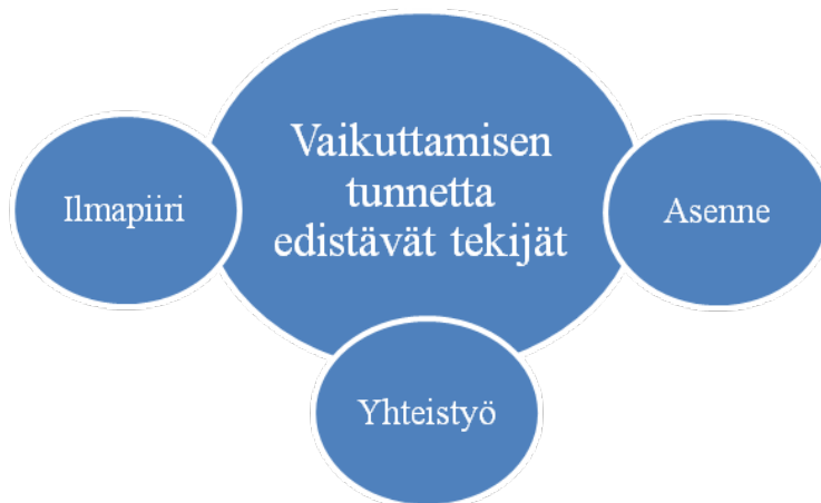
KUVIO 3. Vaikuttamisen tunnetta edistävät tekijät

”Oon kokenu myös että meivät vanhemmat on otettu tosi tasavertaisina siinä keskustelussa mukaan. ... On tullu semmonen olo että ne arvostaa sitä mielipidettä.”