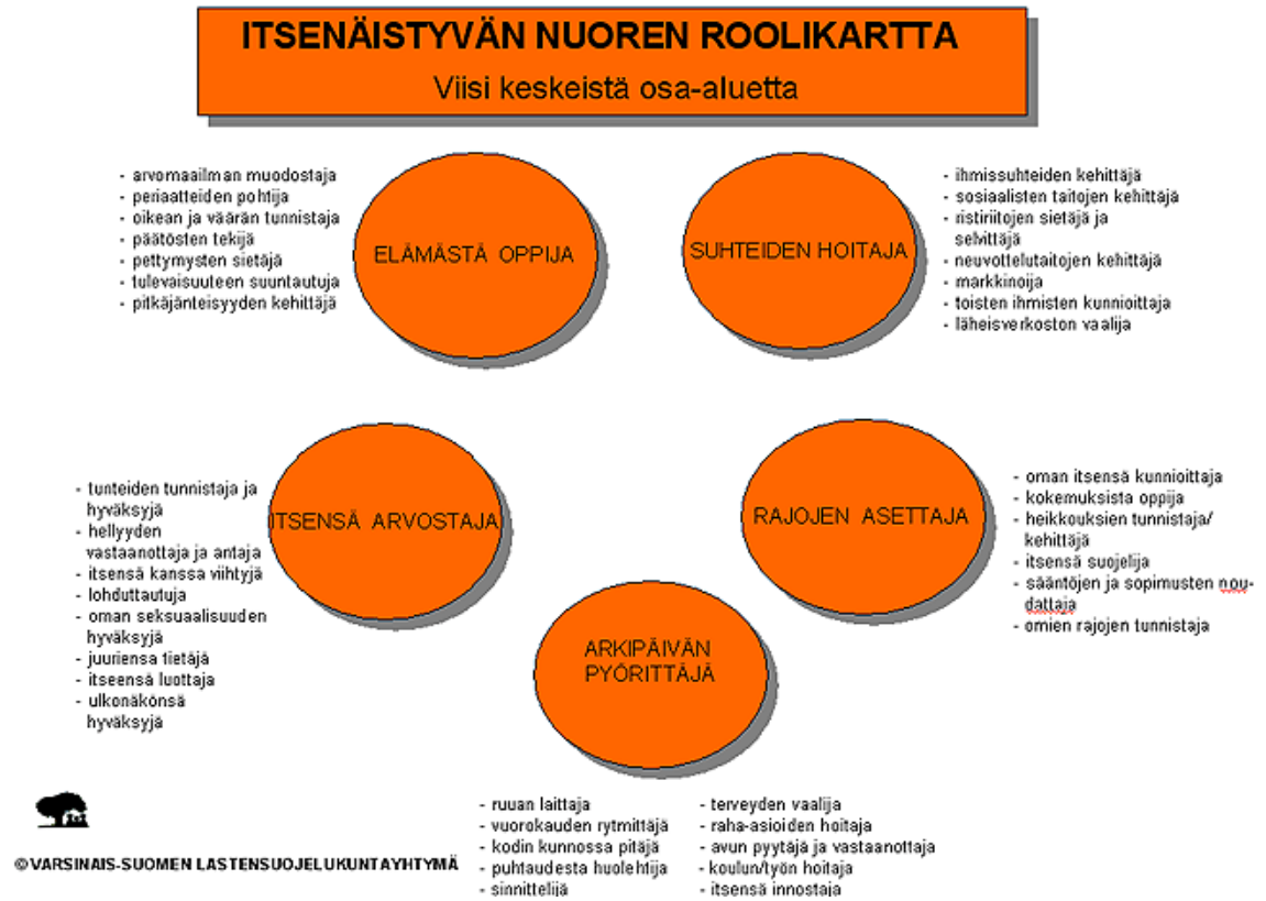
Kuva 3. Itsenäistyvän nuoren roolikartta (Varsinaissuomen lastensuojeluyhdistys, 2012)