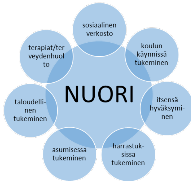
KUVA 4. Itsenäistymisen tukemisen osa-alueet

sen hyväksyminen liittyvät myös henkilökunnan mielestä tähän rooliin. Persoonallisuuteen liittyvät seikat nousivat myös esille: kyky nähdä syy-seuraus-suhteet, vastuuntunto, kyky nähdä ja suunnitella asioita eteenpäin, väkivallattomuus ja tulevaisuuden suunnittelu. Lisäksi keskusteltiin siitä, että nuorten on hyvä tietää, mitä yhteiskunnallisia etuuksia on, mitä verotus on ja miten verotus toimii.