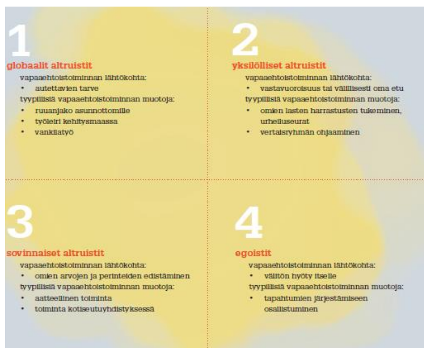
Kuvio 2. Vapaaehtoisten arvot ja motiivit osallistumiseen. (Laimio – Välimäki 2011: 21) Hiilamon ja Leskisen mukaan.

Motiiveista ja motivaatiosta Laimio ja Välimäki (2011: 22) toteavat, että sisäinen motivaatio näyttäisi olevan vapaaehtoistyössä tyypillinen. Motivaatiotekijät liittyvät itsensä toteuttamiseen, kehittämiseen sekä pätemisen tarpeisiin ja tyytyväisyys tulee tekemisen ilosta. Sisäisesti motivoituneella on halu oppia uutta, kehittyä ja tehdä jotain merkittävää. Sisäiset motiivit ovat kestäviä ja tehokkaita.