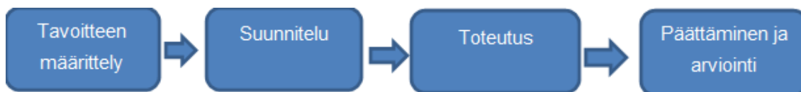
Kuvio 2. Lineaarisen mallin kuvaus (Toikko & Rantanen 2009, 64).

Lineaarista etenemistä kuvataan kokonaisuutena, jossa järjestys on looginen ja rationaalinen. Linearisessa mallissa mahdolliset riskit ovat ennustettavissa sekä kontrolloitavissa. (Salonen ym. 2017, 52.)