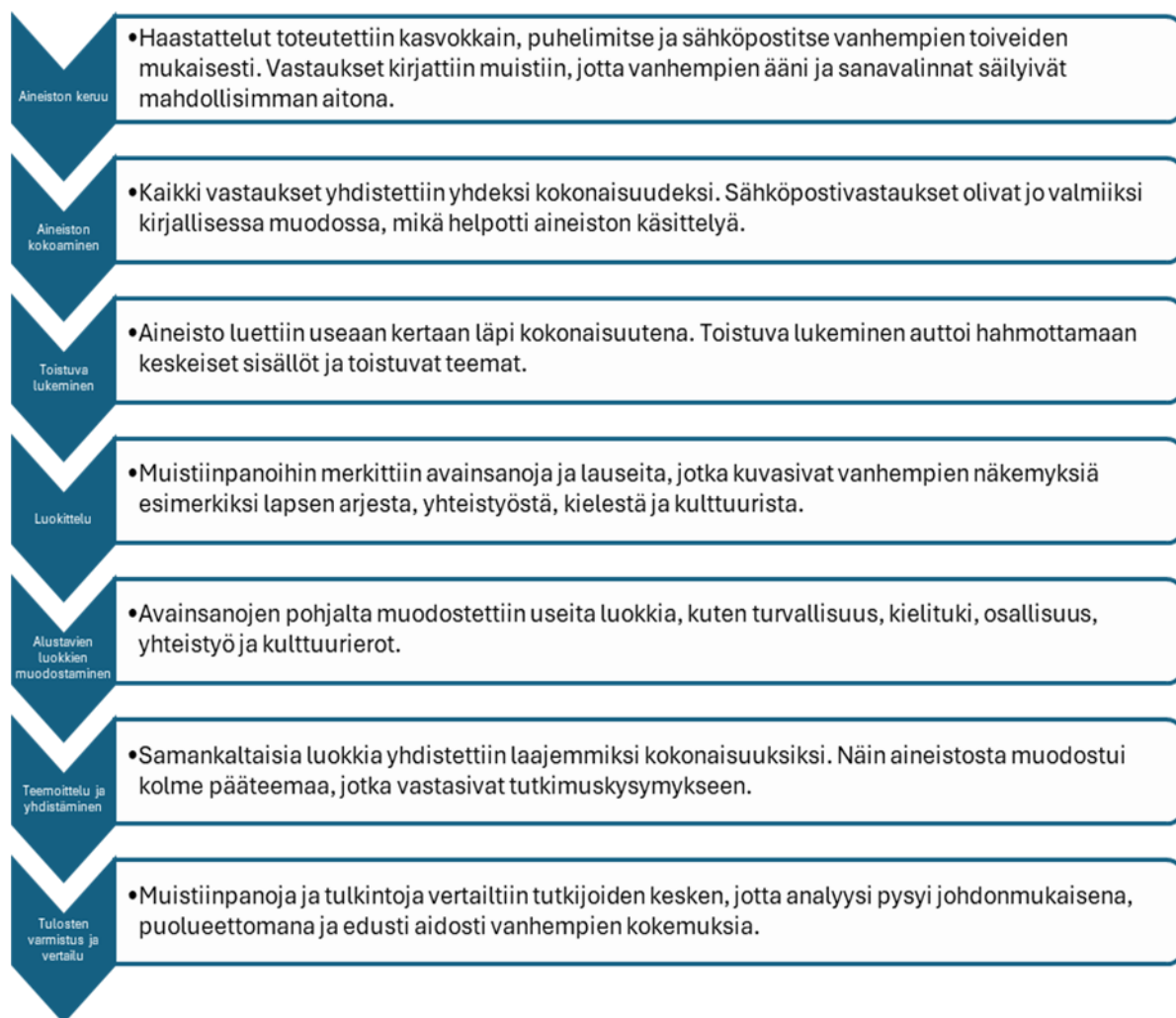
Taulukko 1. Aineiston analyysin eteneminen vaiheittain.