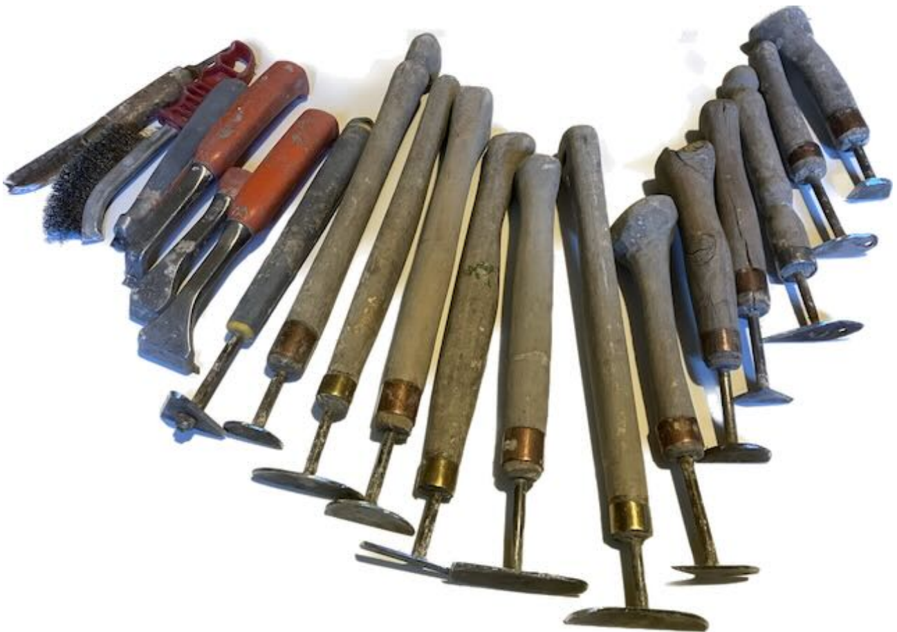
Kuva 5. Maalinpoistossa käytettyjä työkaluja.

malli on puolipyöreällä terällä varustettu malli, jolla voi puhdistaa paneelin saumat sekä oikean-, että vasemmankätisesti. Samantyyppisiä skrapoja tarvitaan useita kappaleita, koska niiden terät tylsyvät nopeasti, ne tipahtavat välillä käsistä ja niiden terät kuumentuvat niin, että poistettava maali takertuu niihin kiinni. Lisäksi erityyppisille koriste-paneeleille tarvitaan erikoismuotoiltuja teräprofiileja.