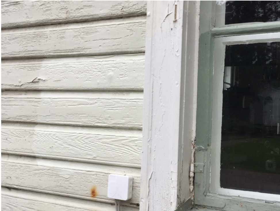
Kuva 3. Hiekkapuhalluksen vaurioittamaa panelointia Kepon kartanosta.

käytettiin aikoinaan huonolla menestyksellä pintojen puhdistamiseen vanhasta maalista. Tuloksena oli kuvassa 3 näkyvää jälkeä.