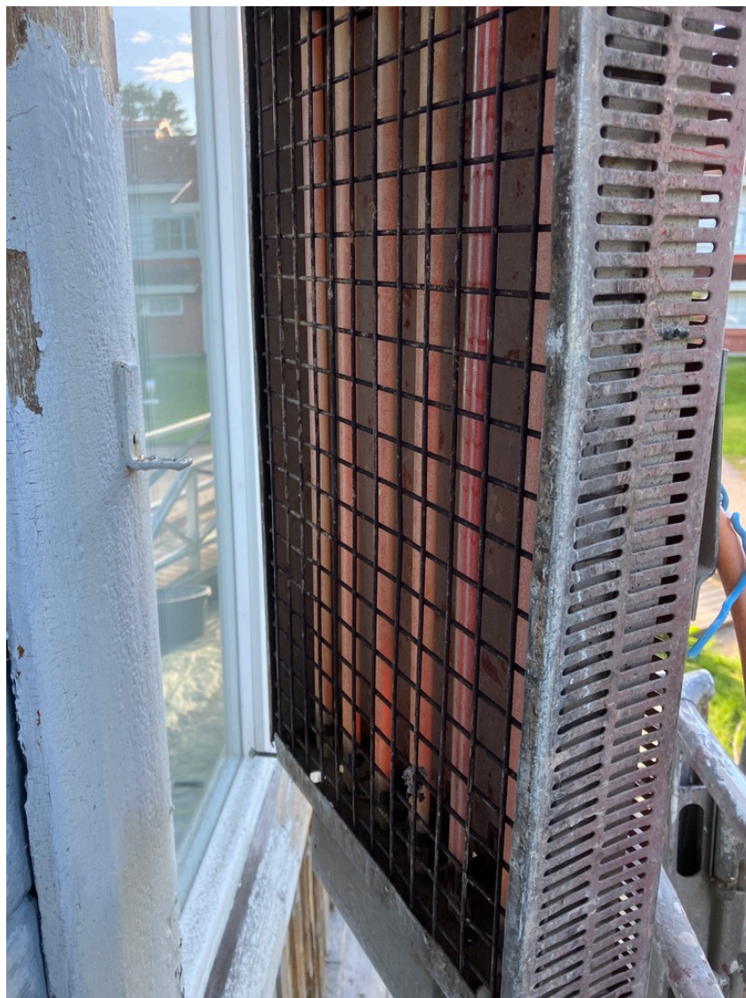
Kuva 1. Speedheater 5100.

Tulityösuunnitelma on yrityksen laatima kirjallinen ohje (SPEK, 2021, s. 8). Se määrittelee yrityksen toimintamallin tulitöiden toteuttamiseksi turvallisesti. Tulityösuunnitelma voi olla osana yrityksen pelastus- tai turvallisuussuunnitelmassa.