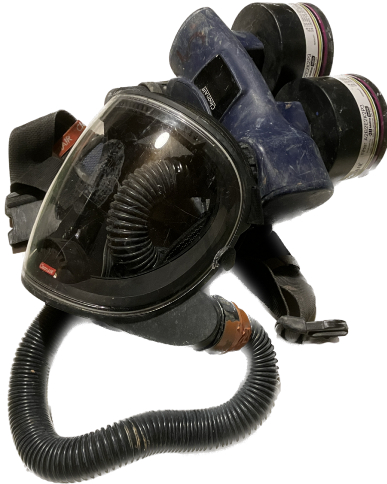
Kuva 8. Työmaalla käytetty hengityssuojain.