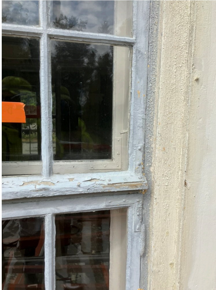
Kuva 4. Maalinpoistoaine ikkunanpuitteessa.

Säteilylämmittimellä tapahtuva maalinpoisto on tulityötä, jolloin ensisijaisesti tulee harkita muiden vähemmän palovaarallisten keinojen käyttöä. Säteilylämmitin on myös altis sääoloille. Etenkin navakka tuuli vaikeuttaa maalinpoistotyötä.