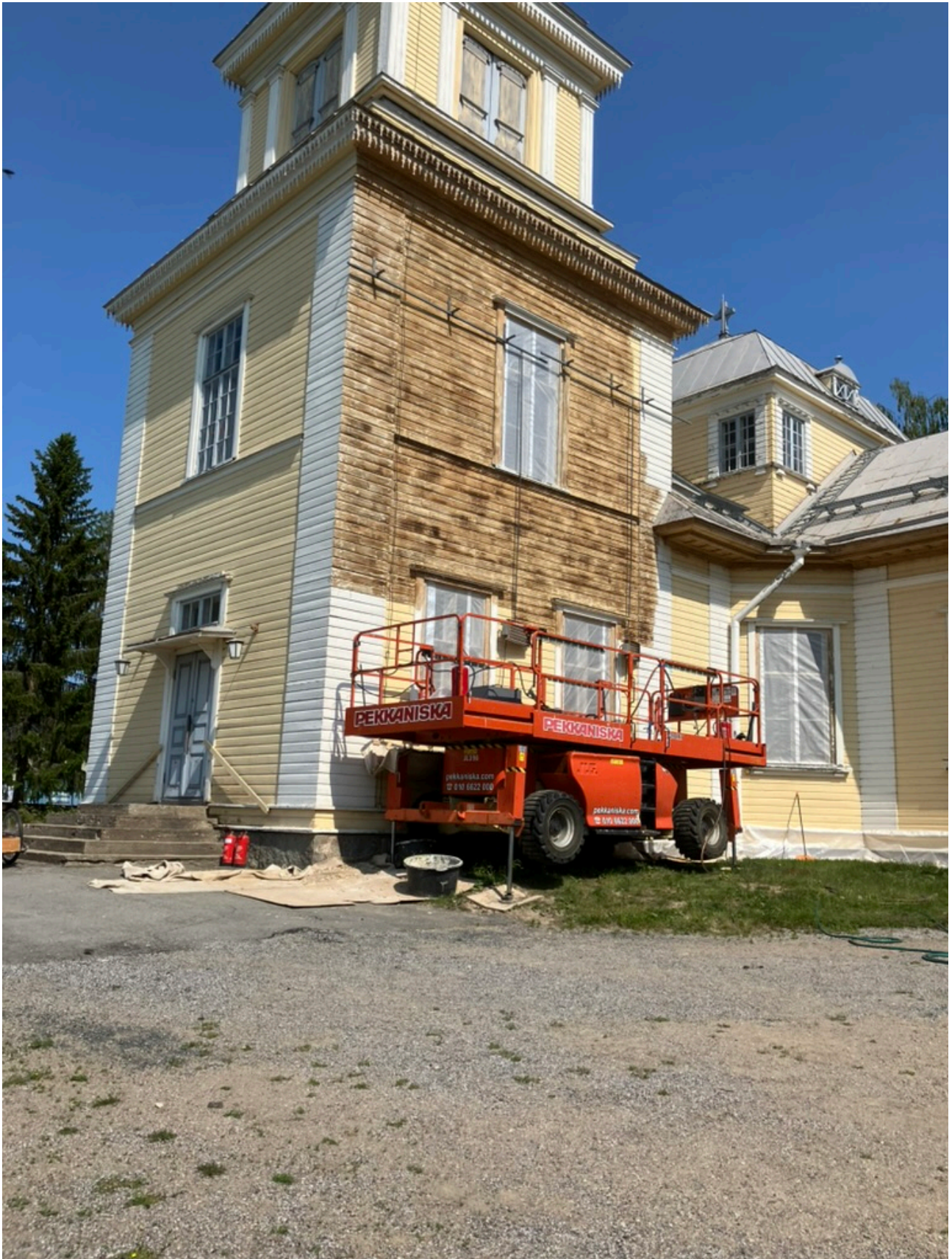
Kuva 6. Saksilava nostolaitteena.