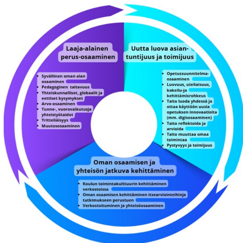
KUVIO 1. Tulevaisuuden opettajan osaamisen tavoitteet (mukaillen Opetus- ja kulttuuriministeriö 2016)

Ammatillisen opettajan toimintaympäristössä on tapahtunut useita merkittäviä muutoksia 2010- ja 2020-luvulla. Viimeisimmät keskeiset ammatillisen opettajan osaamistarpeen muutoksiin vaikuttaneet tekijät ovat olleet ammatillisen koulutuksen reformi 2018 sekä työelämän muutokset, joista yksi merkittävä on digitalisuuden kehittyminen (Kilja & Mäntykangas 2024a). Ammatillisen koulutuksen reformi oli merkittävä uudistus, jonka tavoitteena on vastata sujuvammin työelämän tarpeisiin kouluttamalla osaamisperusteisesti yksilöllisen tarpeen mukaan (Opetus- ja kulttuuriministeriö 2017).