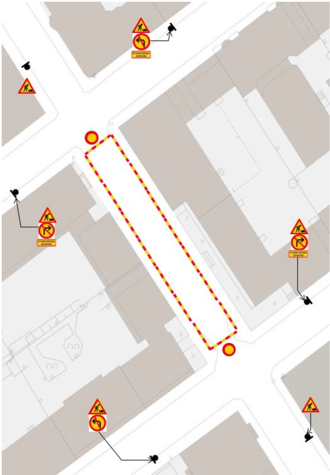
Ohjekortti 3 Kadun sulkeminen kokonaan