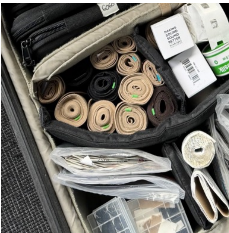
KUVA 8. Lähetinvyöt nappimikkisalkussa

Lähetinvyö on vyö, jossa on lähettimelle oma tasku ja mikrofonin ylimääräiselle johdolle myös oma taskunsa. Eripituisia, -värisiä ja eri tarkoituksiin tarkoitettuja lähetinvöitä on paljon (kuva 8). Lähetinvöitä voi myös yhdistellä, jos niihin tarvitsee lisää pituutta. Lähetinvyötä laittaessa on hyvä tarkistaa, ettei se rullaannu, vaan pysyy ihoa vasten suorana. Silloin lähetinvyökään ei tule niin helposti paidan läpi näkyviin. Näyttelijältä on hyvä myös kysyä, mihin haluaa lähettimen, esimerkiksi vyötärölle vai nilkkaan, jos pystyy antamaan vaihtoehtoja. On myös hyvä varmistaa näyttelijältä, onko vyö liian kireällä tai löysällä, tai antaa näyttelijän itse kiristää se. Tuotannon edetessä oppii myös kunkin näyttelijän preferenssit, mihin he mieluiten haluaisivat lähettimen. Lähetinvöissä on värimerkattuna lähetinvöiden pituus, eli vaikka ne ovat rullalla nappimikkisalkussa, pystyt nopeasti katsomaan minkä pituinen ja mihin käyttötarkoitukseen mikäkin vyö sopii. Osassa lähetinvöistä on myös tahmainen puoli, esimerkiksi reiteen laitettavassa, ettei lähetinvyö lähde valumaan niin helposti. Lähettimen koko vaikuttaa myös siihen, miten hyvin lähettimen saa piilotettua.