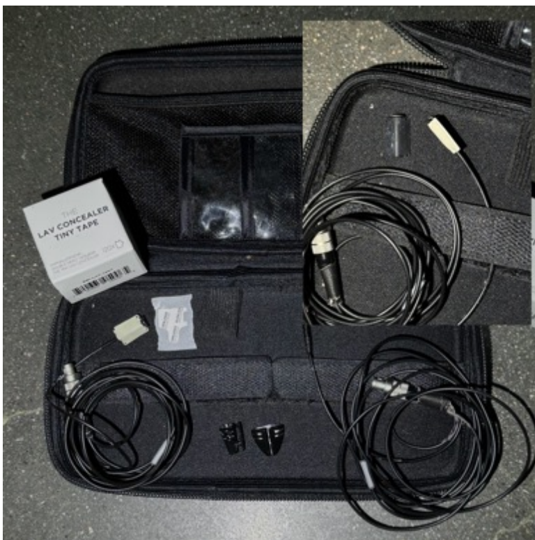
KUVA 6. Nappimikrofoni concealerilla ja rautalangalla sekä kiinnityksiin tarkoitettu teippi.