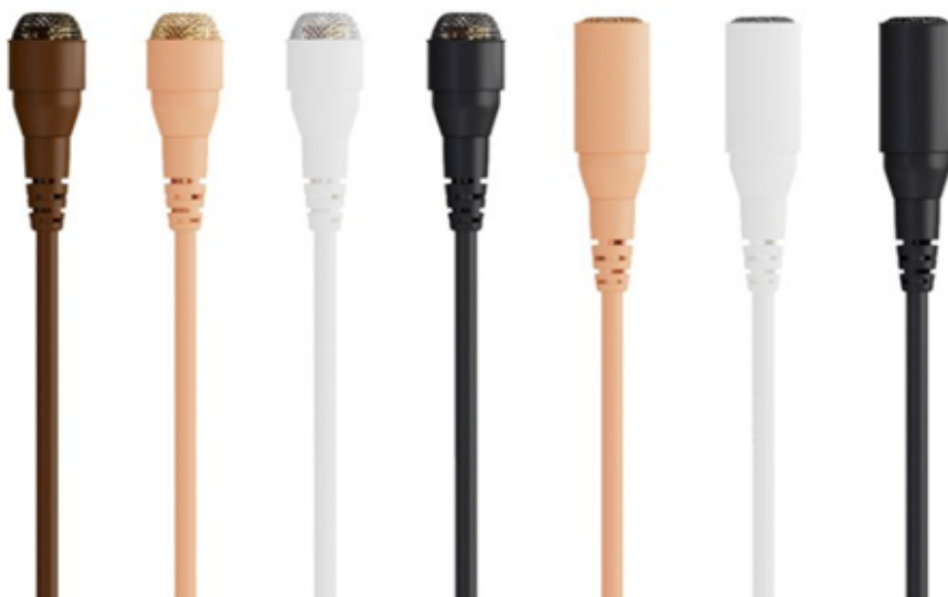
KUVA 1. Erivärisiä DPA merkin nappimikrofoneja

Nappimikitys, eli langattoman mikrofonin piilotus, tapahtuu yhteistyössä monen eri osaston kanssa, mutta vastuussa siitä on vain yksi henkilö, mikittäjä. Mikittäjä on yleensä ääniassistentti, mutta joissain tilanteissa mikitys voi olla myös äänittäjän vastuulla. Piilotustaktiikoita ja nappimikitysvälineitä on monia, eikä piilottamiseen ole oikeaa tai väärää tapaa. Kirjallisia ohjeistuksia on kootusti vähän saatavilla, koska tieto nappimikityksestä kulkee pääasiassa suullisesti kokeneemalta mikittäjältä vasta harjoittelevalle mikittäjälle, ja mikityksen oppii parhaiten tekemällä. Kokemuksesta on hyötyä mikityksessä, sillä silloin kun mikityksen tekninen puoli on hallinnassa, voi keskittyä näyttelijöiden kohtaamiseen entistä enemmän. Mikityksessä voi kehittyä nopeammaksi, ja oppia perusasioita, mutta tylsää se ei ole, koska jokainen mikitys on erilainen ja haasteita tulee eteen jatkuvasti. Siksi pitää olla valmis myös oppimaan lisää ja haastamaan itseään.