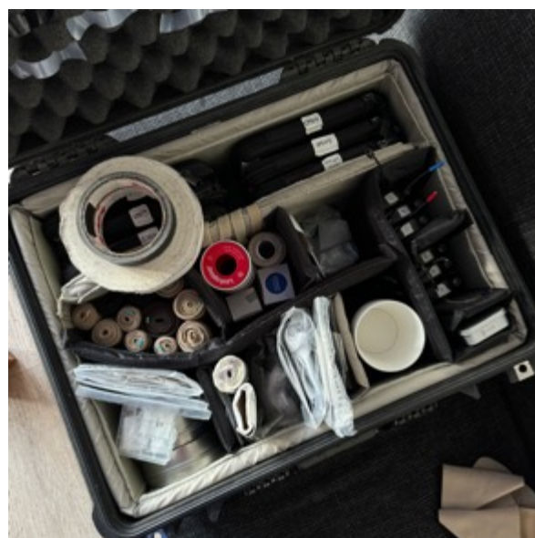
KUVA 4 ja 5. Nappimikkisalkut

Teipit ja muut kiinnitystarvikkeet ovat todella tärkeitä nappimikittäjälle. Nappimikrofonin kiinnitykseen voi käyttää kaikkia erilaisia välineitä, mitkä soveltuvat parhaiten tilanteeseen. Teipit ovat kuitenkin todella tärkeitä. Teippejä on erityyppisiä ja -kokoisia, kuten ympyräteippejä, neliöteippejä ja reiällä tai ilman. Reikiä tei-