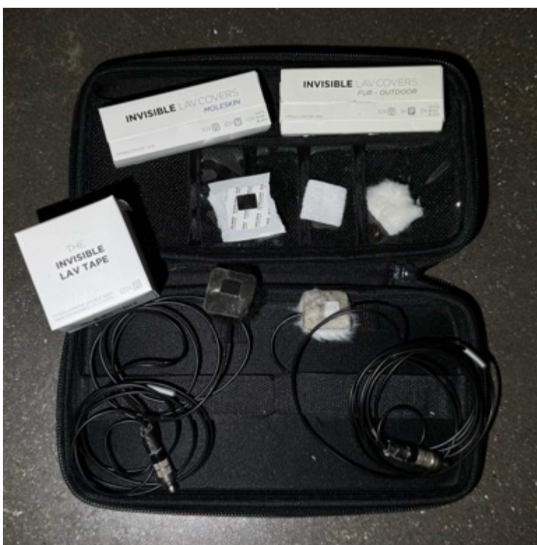
KUVA 7. Nappimikrofoni tuulisuojalla ja moleskinillä, sekä kiinnityksiin tarkoitetut teipit. (Kuvat: Julia Huopainen 2024)