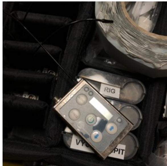
KUVA 2 ja 3. Vasemmalla Sound Devices lähetin (kuva 2) ja oikealla Lectrosonics lähetin (kuva 3).

Myös akun kestosta on huolehdittava, ettei akku lopu kesken kaiken. Nappimikrofonien lähettimet toimivat paristoilla tai akulla, joten niitä pitää muistaa vaihtaa ja ladata. On hyvä pitää täysiä vara- ja vaihtoakkuja tarpeeksi mukana, jotta akun pystyy vaihtamaan nopeasti uuteen sen loppuessa. (Kench 2020.) Nappimikrofoni ei toimi ilman phantom-virtaa. Lähettimen akku tuottaa virtaa paitsi lähettimelle ja sen toiminnalle, mutta myös nappimikrofonille.