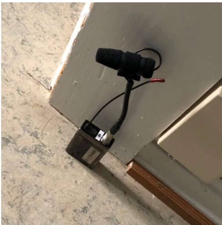
KUVA 12. Piilomikrofoni, DPA merkin mini mikrofoni liittimellä kiinni Lectrosonics lähettimessä.

On hyvä varautua aina myös herkälle iholle sopiviin teippeihin. Baer (2025) mainitsee ihon herkkyuden, herkälle iholle sopiva teippi olisi hyvä olla aina saatavilla heti tuotannon alusta asti. Hän kuitenkin lisää, että pitää tätä myös omana vastuunaan ilmoittaa tuotannolle ajoissa, että tarvitsee herkälle iholle soveltuvaa teippiä. Iho ehtii usein jo ärtyä ennen kuin ongelma huomataan, ja kun iho menee rikki, niin herkän ihon teippi ei enää siinä tilanteessa auta. Se on verrattavissa myös maskeeraukseen, esimerkiksi jos kuukauden kuvausten jälkeen huomaa, että iho on mennyt huonoon kuntoon. Siinäkin näyttelijän pitää kommunikoida, jos joku ei sovi. (Baer 2025.) Rickman (2025) mainitsee myös, että näyttelijöiden herkkä iho on hyvä ottaa huomioon. Voisi olla hyvä käyttää kliinistä suihketta, joka irrottaa liimapinnan helposti, jos on käytetty ihoteippiä nappimikrofonin kiinnityksessä. Näissä kohdissa korostuu ammatillinen huolellisuus ja hienovaraisuus. Tarkoitus ei ole tehdä toisen kehoon mitään tarpeetonta, vaan käyttää mahdollisimman hellävaraisia menetelmiä. (Rickman 2025.) On myös hyvä muistaa se, jos näyttelijän iho näkyy kuvausten aikana siitä kohdasta, mihin nappimikrofoni laitetaan, olla vielä erityisen huolellinen, ettei siitä jää ärsytystä tai jälkiä ihoon. Ja vaikka Baer kertoo sen olevan myös näyttelijän vastuulla, on mikittäjän hyvä varmistaa jo kaluston läpikäynnin yhteydessä se, että nappimikkisalkusta