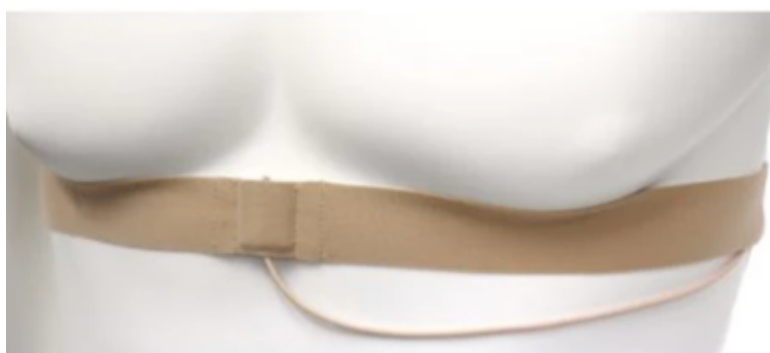
KUVA 9. Rintaremmi nappimikrofonille.

Nappimikrofoneja on erivärisiä, niin kuin karvoja ja teippejäkin. Väri olisi hyvä valita vaatteiden mukaan, niin ettei mustan paidan kaula-aukosta pilkistä valkoista karvaa. Tässä joutuu myös ennakoimaan ja miettimään etukäteen, jos nappimikrofoneja tai tarvikkeita on rajattu määrää. Esimerkiksi jos jollakin näyttelijällä on läpikuultava paita, kannattaa priorisoida ja varata hänen ihonväriään vastaava