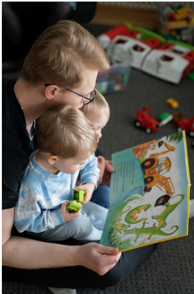
Kuva 1. Monikkoperheessä kaikkien vanhempien läsnäolo ja kiireetön aika lasten kanssa on tärkeää.

Monikkoperheellä tarkoitetaan perhettä, johon on syntynyt useampi kuin yksi lapsi kerrallaan eli kaksoset, kolmoset tai neloset. Suomessa kaksosia syntyy vuosittain noin 600 perheeseen ja kolmosia 5–10 perheeseen. Neloset ovat syntyneet Suomessa viimeksi vuosina 2016 ja 2014. Kun työntekijä kertoo siitä, että hänen perheeseensä odotetaan monikkolapsia syntyväksi, on syytä onnitella lottovoitosta! Monikkoraskauden erityispiirteistä kannattaa käydä avoin keskustelu mahdollisimman varhaisessa vaiheessa, jotta mahdollisilta yllätyksiltä vältyttäisiin. Monikkoraskautta seurataan terveydenhuollossa tavanomaista raskautta tiheimmin. Perhemyönteisyyden ilmapiiriä lisää se, että työnantaja myöntää mielellään vapaata raskauden seuranta- ja neuvolakäyntejä varten myös monikko-odottajan puolisolalle.