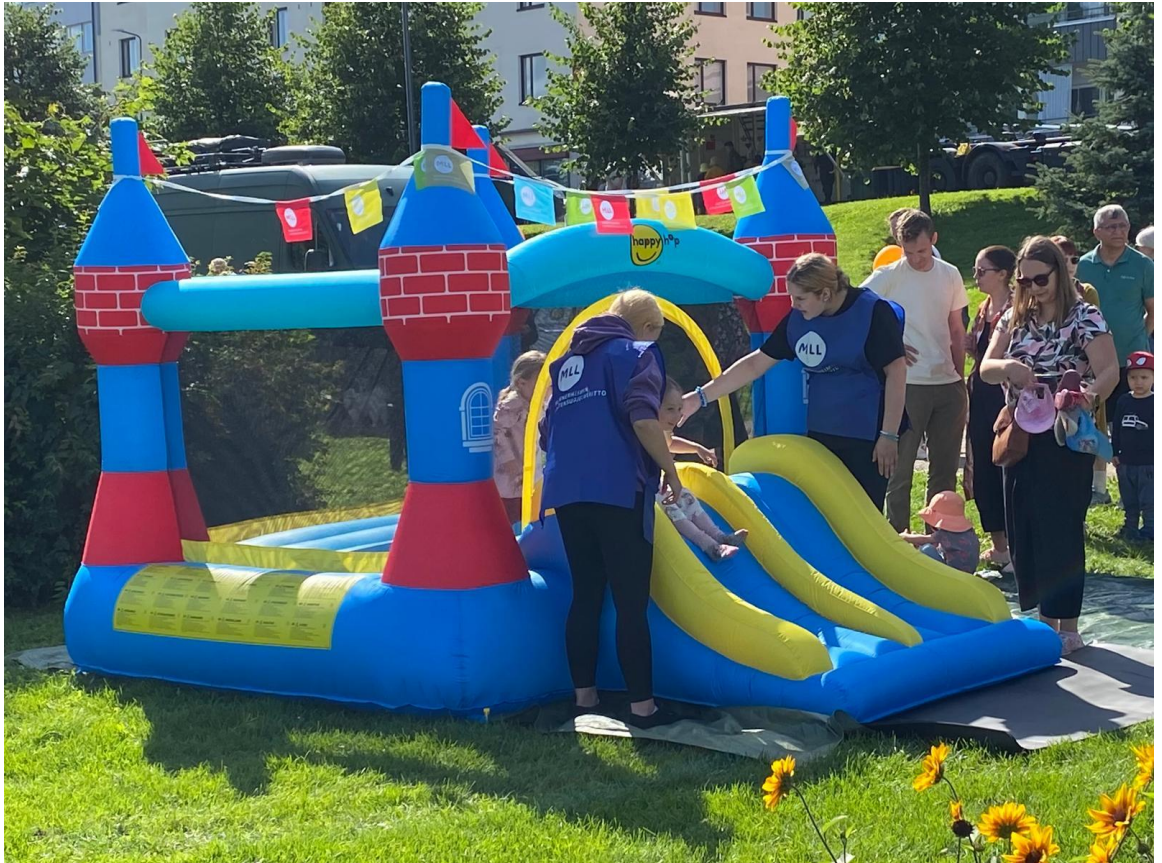
Kuva 1. MLL suunnittelee ja toteuttaa mielellään perhepäiviä ja tapahtumia yhteistyössä yritysten kanssa.