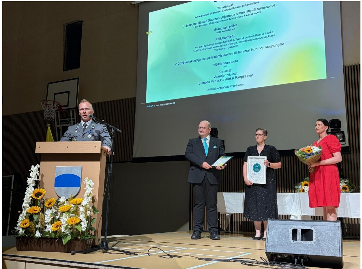
Kuva 1. Kainuun prikaati palkittiin Kainuun maakuntajuhlissa Sotkamossa 10.8.2025 Perhemyönteinen työpaikka -palkinnolla.