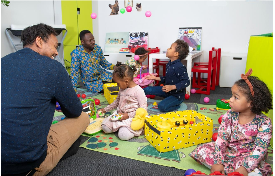
Kuva 1. Kahden kulttuurin perheissä vanhemmilla on eri kieli-, kulttuuri- tai kansallisuustausta.