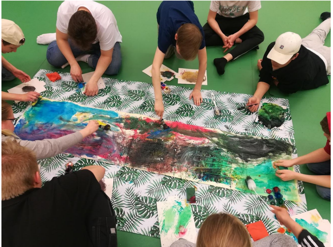
Kuva 1. YVPL ry järjestää ammatillisesti ohjattuja eroryhmiä sekä lapsille, nuorille että aikuisille. Kuva on vanhempien eron kokeneiden nuorten erotyöpajasta.

Näiden haasteiden vuoksi työnantajan joustot ja ymmärtävä suhtautuminen ovat yhden vanhemman perheille keskeisiä hyvinvoinnin edellytyksiä. Kun työaikoja ja työn tekemisen tapoja voidaan sovittaa elämäntilanteeseen, työntekijän sitoutuminen ja työkyky vahvistuvat, ja samalla koko työyhteisö hyötyy.