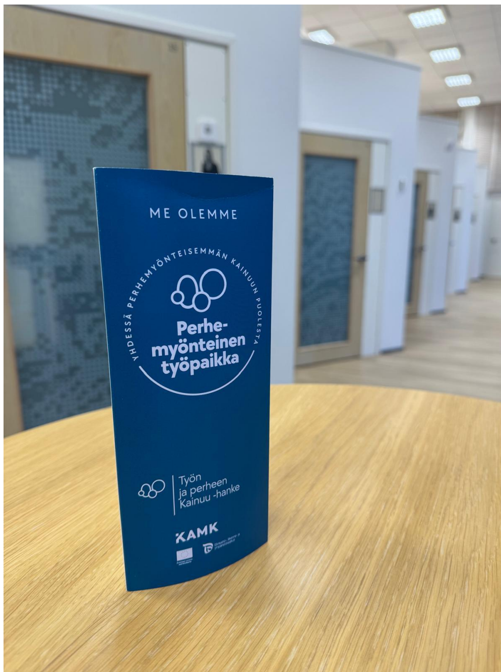
Kuva 3. Työn ja perheen Kainuu -kehittämishankkeessa mukana oleville yrityksille tarjottiin erilaisia sähköisiä ja fyysisiä viestintämateriaaleja yrityksen perhemyönteisyydestä viestimiseksi.

Yhteistyössä Radio Sandelsin, Kainuun liiton ja Kajaani Kampus 2025 -kehittämishankkeen kanssa toteutettiin radiosarja Perhe ja periferia – kotona Kainuussa , joka vahvisti keskustelua perhemyönteisestä arjesta Kainuun maakunnassa. Lisäksi hanke tuotti yrityksille fyysisiä viestintämateriaaleja – kuten Perhemyönteinen työpaikka -logon, tarrat, julisteet, pöytäkoristeet ja paidat