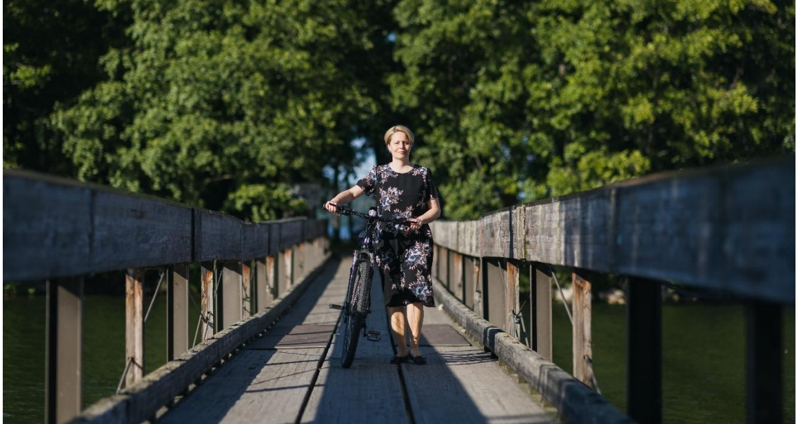
Kuva 1. ValmennuksetVanhemmille: Rakennetaan yhdessä siltaa kohti kokonaisvaltaista hyvinvointia ja mielekästä elämää! Kuva: Tommi Mattila.

Myös esihenkilöt voivat tarvita valmennusta perheystävällisen arjen johtamiseen. Tällaiseen tarpeeseen voi vastata vaikkapa verkkovalmennuksella, jossa tavoitteena on lisätä esihenkilöiden osaamista inhimillisestä johtamisesta ja antaa heille päätöksenteon tueksi työkaluja erilaisiin käytännön tilanteisiin. Valmennuksen on hyvä olla tiivis, konkreettinen ja käytännönläheinen ja sitä voi suunnitella yhdessä esihenkilöiden kanssa ja heidän tarpeidensa pohjalta.