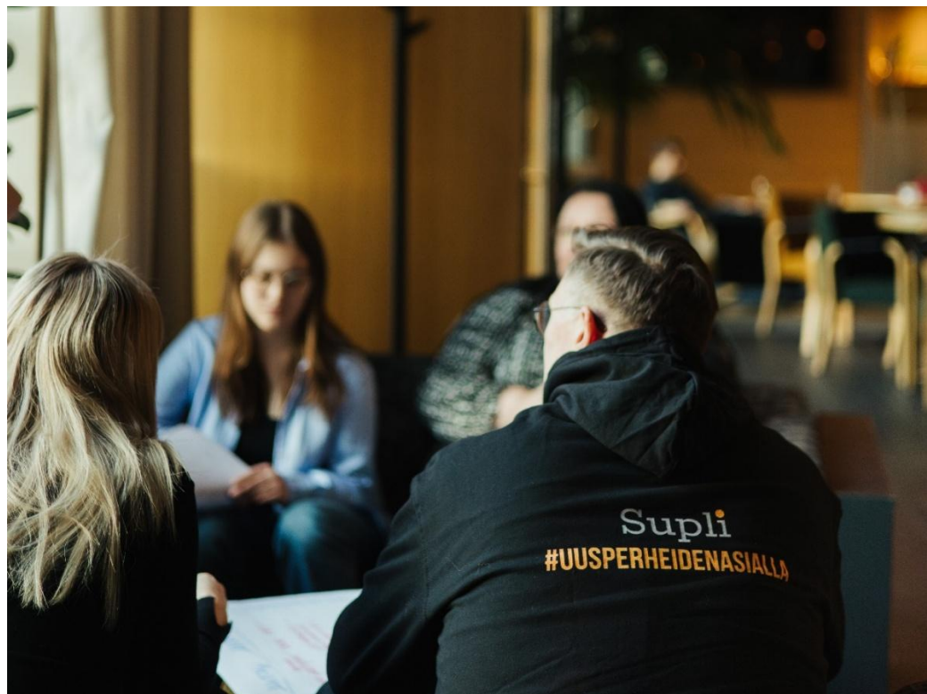
Kuva 1. Suuri osa Liiton toiminnan laajuudesta ja monimuotoisuudesta nojaa vapaaehtoisten aktiivisuuteen.