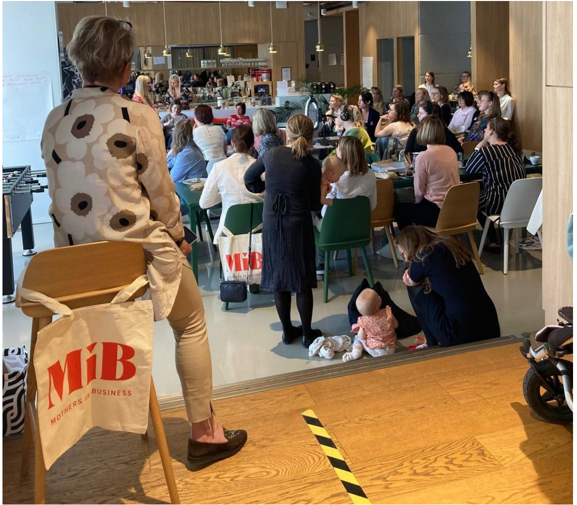
Kuva 1. Vaikuttamistyön lisäksi Mothers in Business MiB ry tarjoaa mm. satoja tapahtumia vuodessa, jotka suurimmaksi osaksi ovat vapaaehtoisten toteuttamia, äideiltä äideille. Tapahtumiin saa aina osallistua lapsen kanssa.