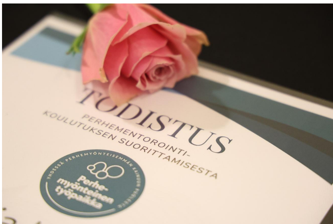
Kuva 2. Perhementoreiden valmistumista juhlistettiin KAMKilla 9.12.2025.

Kehittämishankkeen kolmannen työpaketin tavoitteena oli rakentaa uusi toimintamalli vapaaehtoiseen vertaismentorointitoimintaan, jonka avulla voitaisiin tarjota apua uusille kuntiin muuttajille. Vertaismentoroinnin toivottiin lisäävän mm. uusien työntekijöiden mukana muuttavien puolisoitten työllistymistä sekä parantavan kainuulaisten yritysten mainetta perhemyönteisinä työnantajina. Lisäksi vertaismentoroinnin tarkoituksena oli vahvistaa hankkeessa mukana olevien työpaikkojen houkuttelevuutta perheellisten muuttajien näkökulmasta sekä edistää muuttajien sitoutumista alueeseen ja sen työpaikkoihin.