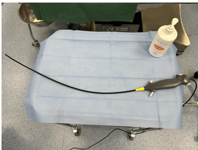
Kuva 1. Kertakäyttöinen fiberoskooppi.

Fiberoskooppi, eli kuitutähystin on ohut, ohjattava ja taipuisa putkimainen tähystin, jolla saadaan kamerayhteys potilaan suun tai nenän kautta äänihuulten ohi henkitorveen (Niemi-Murola & Ahlmén-Laiho 2021). Taipuisa tähystin koostuu joustavasta putkesta, jonka sisällä kulkee vaihteleva määrä kanavia eri toimenpiteitä varten, kuten työskentelyyn sekä huuhtelu- ja imutoimintoihin. Tähystimen päässä on kamera, joka välittää kuvan tarkasteltavasta kohdasta (Karhumäki ym. 2017: 164.) Kertakäyttöisiä fiberoskooppeja on eri kokoisia ja niiden ominaisuuksia on sovitettavissa käyttötarkoituksen mukaisiin vaatimuksiin (Karl Storz 2022).