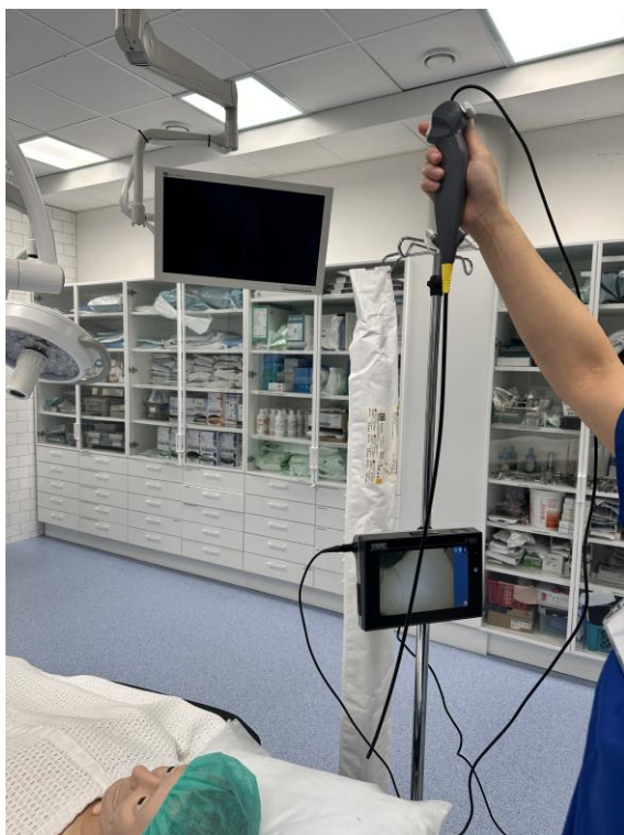
Kuva 4. Ote opetusvideolta. Fiberoskoopin käsittelyä.

Opetusvideon tuottamisprosessissa havaittiin, että visuaalinen materiaali toimii tarkoituksenmukaisesti kirjallisen osuuden lisänä. Tämä mahdollisti sen, että opetusvideon sisältö pystyttiin pitämään selkeänä ja käytännönläheisenä ilman liiallista tietoa opetusvideolla. Kokonaisuutena opetusvideo täydentää olemassa olevaa oppimateriaalia tarjoamalla suomenkielisen, visuaalisesti jäsennellyn ja helppokäyttöisen materiaalin fiberoskooppisen intubaation valmistelusta. Materiaali on hyödynnettävissä niin perehdytyksessä kuin itsenäisen oppimisen tukena, mikä parantaa sen käytännön arvoa perioperatiivisessa hoitotyössä.