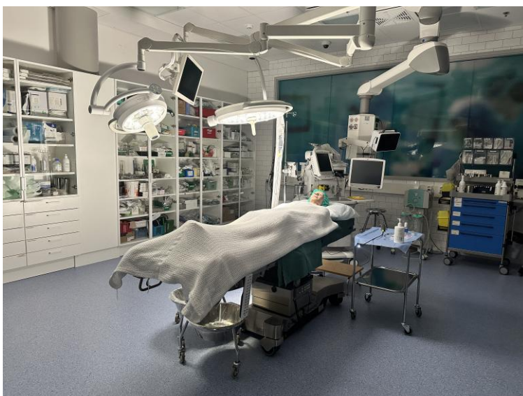
Kuva 6. Ote opetusvideolta. Kuvauspaikkana toimi Metropolia Ammattikorkeakoulun tilat.