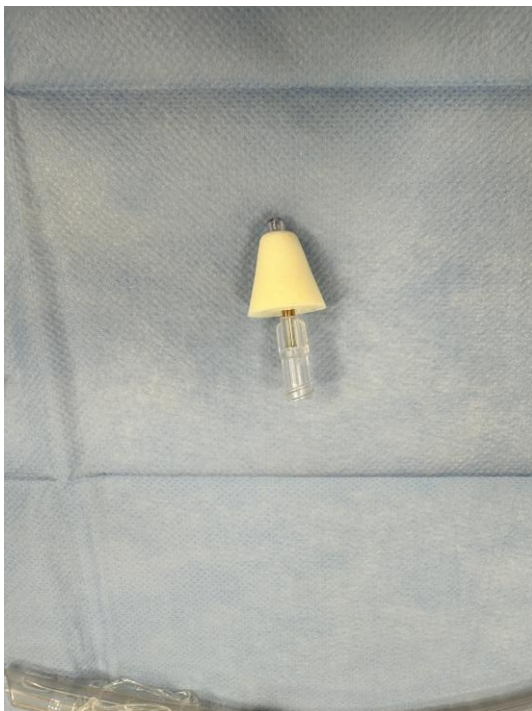
Kuva 3. Nenän atomisaattori.