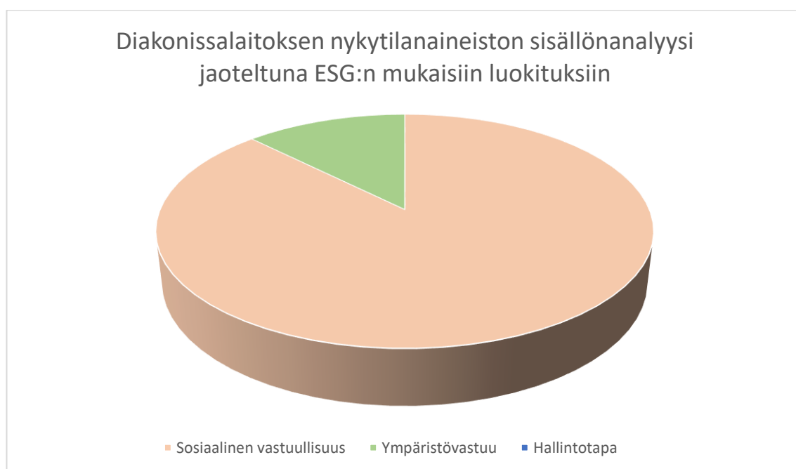
Kuvio 2. Nykytilan sisällönanalyysi jaoteltuna ESG:n mukaisiin luokituksiin

Ympäristön näkökulma uudistavan ajattelun kontekstissa oli vähemmän tunnistettu ja miellettiin lähinnä kestävän kehityksen mukaisiin toimiin ja yritysvastuun velvoitteisiin, kuten kierrätykseen, vastuullisiin hankintaprosesseihin, kestävyysraportointiin ja toiminnan vaikutusten arviointiin. Liitteessä 2 on nykytilan sisällönanalyysin mukainen luokkakohtainen jaottelu, jossa aineisto on luokiteltu yhdeksään pääluokkaan, ja edelleen ESG-standardien mukaisesti: sosiaalinen vastuullisuus 87,5 %, ympäristövastuu 12,5 % ja hallintotapa 0 % (kuvio 2).