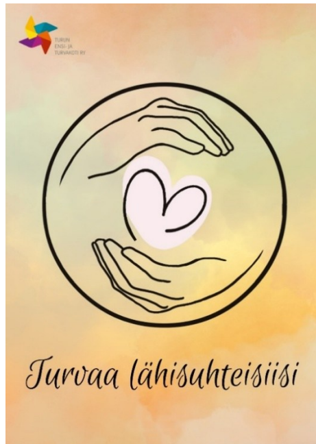
Kuva 2. Lähisuhdeväkivaltatyö Pilarin esitteen etupuoli