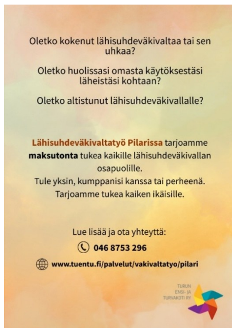
Kuva 3. Lähisuhdeväkivaltatyö Pilarin esitteen kääntöpuoli

Etupuolen (Kuva 2. Lähisuhdeväkivaltatyö Pilarin esitteen etupuoli) elementit koostuvat Pilarille luodusta logosta sekä sen alle sijoitetusta kaunokirjoituksella kirjoitetusta slogan-tyylisestä toteamuksesta ”Turvaa lähisuhteisiisi”. Logo on pyöreä ja sen keskellä on organisaatiossa toisaalla käytössä oleva