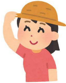
pitää hattua päässä