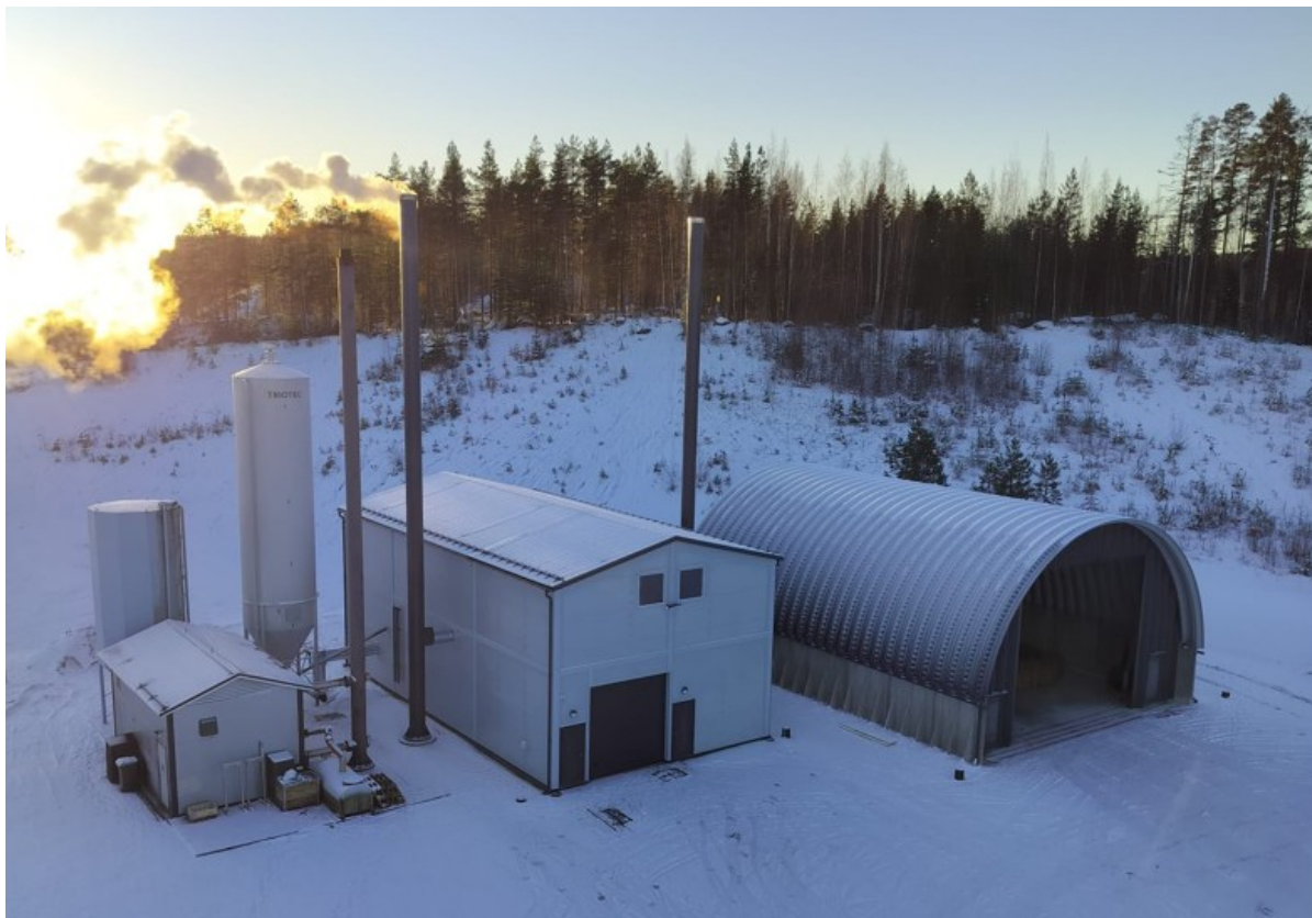
Kuva 3. sorajyvän lämpölaitos (Antti Alakotila,2025)