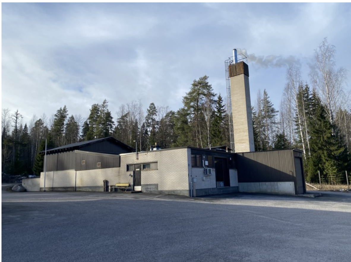
Kuva 2. Kelkkamäen lämpölaitos

Lämpölaitoksen varavoimajärjestelmänä toimii kevyt polttoöljy. Varavoimaa käytetään tilanteissa, joissa pääasiallinen polttoaine ei ole käytettävissä esimerkiksi huollon tai häiriötilanteen seurauksena. Varavoimajärjestelmän ansiosta kaukolämpöverkoston lämmöntoimitus pysyy katkeamattomana kaikissa toimintatilanteissa.