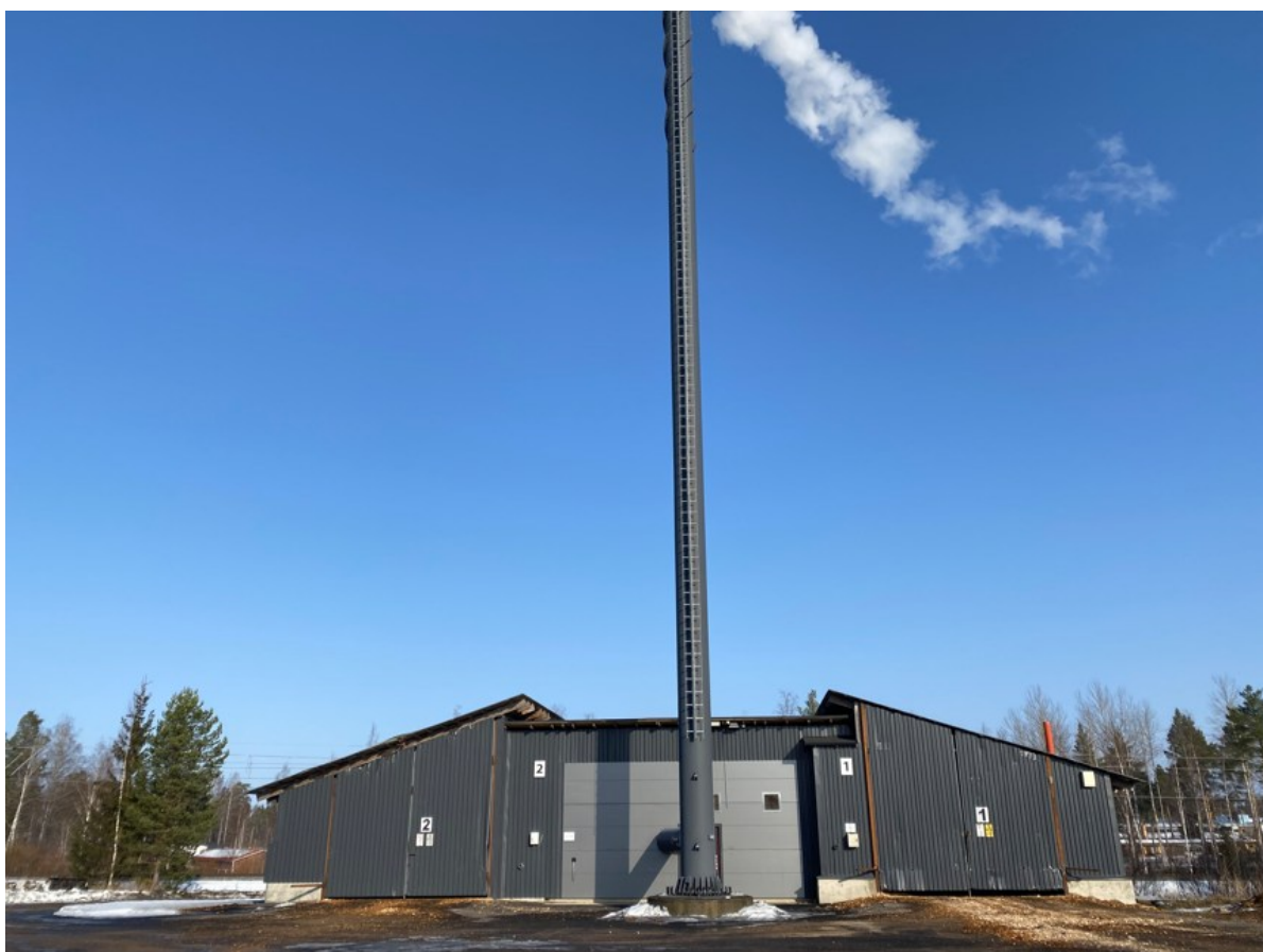
Kuva 1. Keskustan lämpölaitos

Laitoksen varavoimajärjestelmänä toimii kevyt polttoöljy. Varavoimaa käytetään tilanteissa, joissa pääasiallinen tuotantolaitteisto on pois käytöstä esimerkiksi huolto- tai häiriötilanteiden vuoksi tai kun lämmöntarve ylittää laitoksen tuotantokapasiteetin. Varavoiman avulla voidaan varmistaa keskeyty- mätön lämmöntuotanto sekä kaukolämpöverkoston toimintavarmuus kaikissa käyttötilanteissa.