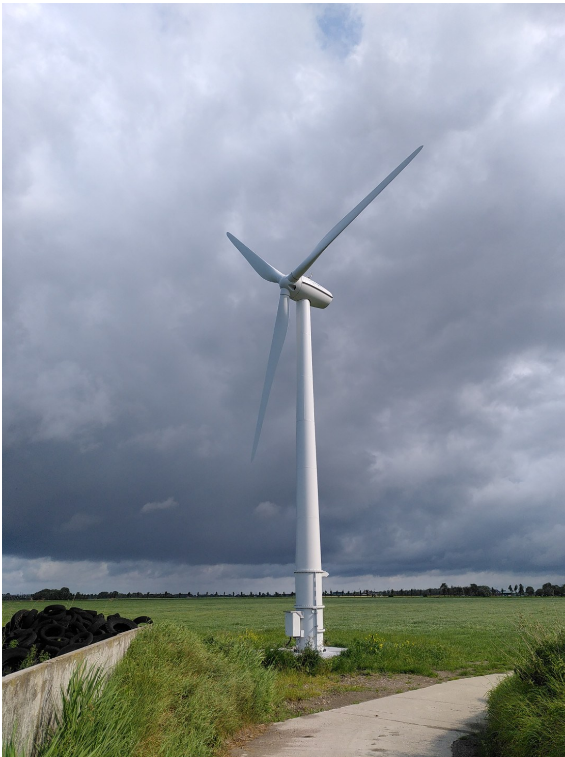
Kuva 4. Mastoon asennettu pientuulivoimala maatilalla [13].

Pientuulivoimaloita hankitaan yleensä joko sähköverkon ulkopuolisiin kohteisiin tai verkkoon kytkettynä kotitalouksien omaan käyttöön. Sähköverkon ulkopuolisisa kohteissa kyse on useimmiten kesämökistä, ja silloin pientuulivoimalaan