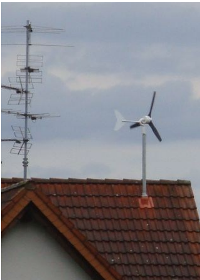
Kuva 5. Pientuulivoimala katolla [16].

Pientuulivoimalan hyvä puoli on se, että se on ekologinen ratkaisu tuottaa sähköä, aivan kuten tuulivoimapuistojen voimalat. Se ei tuota päästöjä ilmakehään, ja tuulivoimaa on saatavilla rajattomasti. Myös pientuulivoimaloiden rakentaminen tuottaa vain vähän päästöjä, jotka voidaan kompensoida itse tuulivoiman tuotannolla. Pientuulivoimalan avulla voi siis pienentää omaa hiilijalanjälkeä ja korvata mahdollisesti fossiilisia polttoaineita päästöttömillä ratkaisulla. Voimalan tuottaman sähkön avulla voi myös pienentää omaa sähkölaskuaan. Kuuden kylmimmän kuukauden aikana tuulivoiman tuotanto on suurempaa, joten voimala tuottaa sähköä silloin, kun sille on eniten tarvetta [1]. Lisäksi pientuulivoimalasta on olemassa monenlaisia eri ratkaisuja, joten on mahdollista mukauttaa pientuulivoimala olosuhteisiin sopivaksi ja siten valita itselleen sopivin ratkaisu.