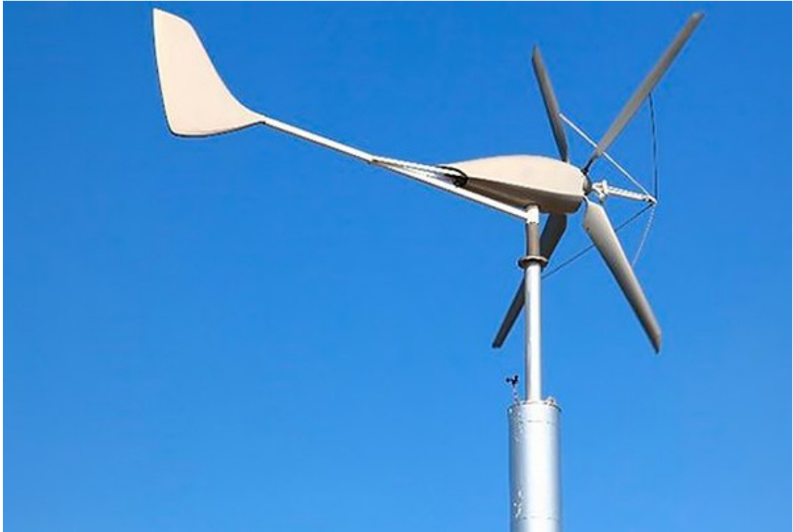
Kuva 2. Vaaka-akselinen pientuulivoimala potkurilla [9].

Vaaka-akselisen tuulivoimalan suurin etu on korkea kärkinopeussuhde ja sitä kautta korkea hyötysuhde. Voimala voi siis tuottaa sähköä melko pienilläkin tuulen nopeuksilla. Voimalan lapojen kulmaa säätelemällä voidaan myös vaikuttaa sähköntuotannon tehokkuuteen sekä voimalan kestävyys korkeammilla tuulen nopeuksilla. Tämä tekee vaaka-akselisesta tuulivoimalasta helpommin hallittavan kuin pystyakselisen voimalan, jonka lapoja ei ole mahdollista säädellä sähköntuotannon aikana. Lisäksi lapojen oikeanlaisella muotoilulla voidaan myös lisätä voimalan hyötysuhdetta entisestään. [8, s. 10–11.]