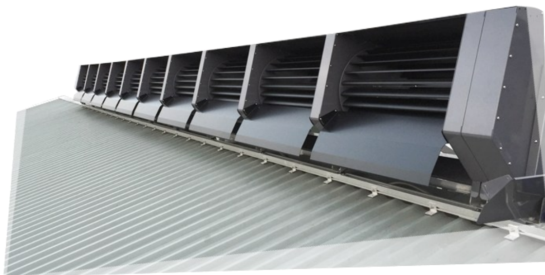
Kuva 3. Ridgeblade-tuulivoimala [11].

lopulta saavuttaa itse tuulivoimalan. Saavutettuaan huippunopeuden tuulimassa pyörittää turbiineja, jolloin saavutetaan voimalan maksimaalinen hyöty. Optimaalisin katon kulma Ridgeblade-voimalalle on 45 astetta, jolloin tuulen nopeus kaksinkertaistuu kattoa pitkin kulkiessaan. Voimala kestää hyvin koviakin tuulen nopeuksia, ja sen on mitattu kestävän jopa tuulia 160 km/h. Ridgeblade-voimaloita myydään sekä kotitalouksille että teollisuuskäyttöön. [11.] Kuvassa 3 on esitetty katolle asennettu Ridgeblade-tuulivoimala.