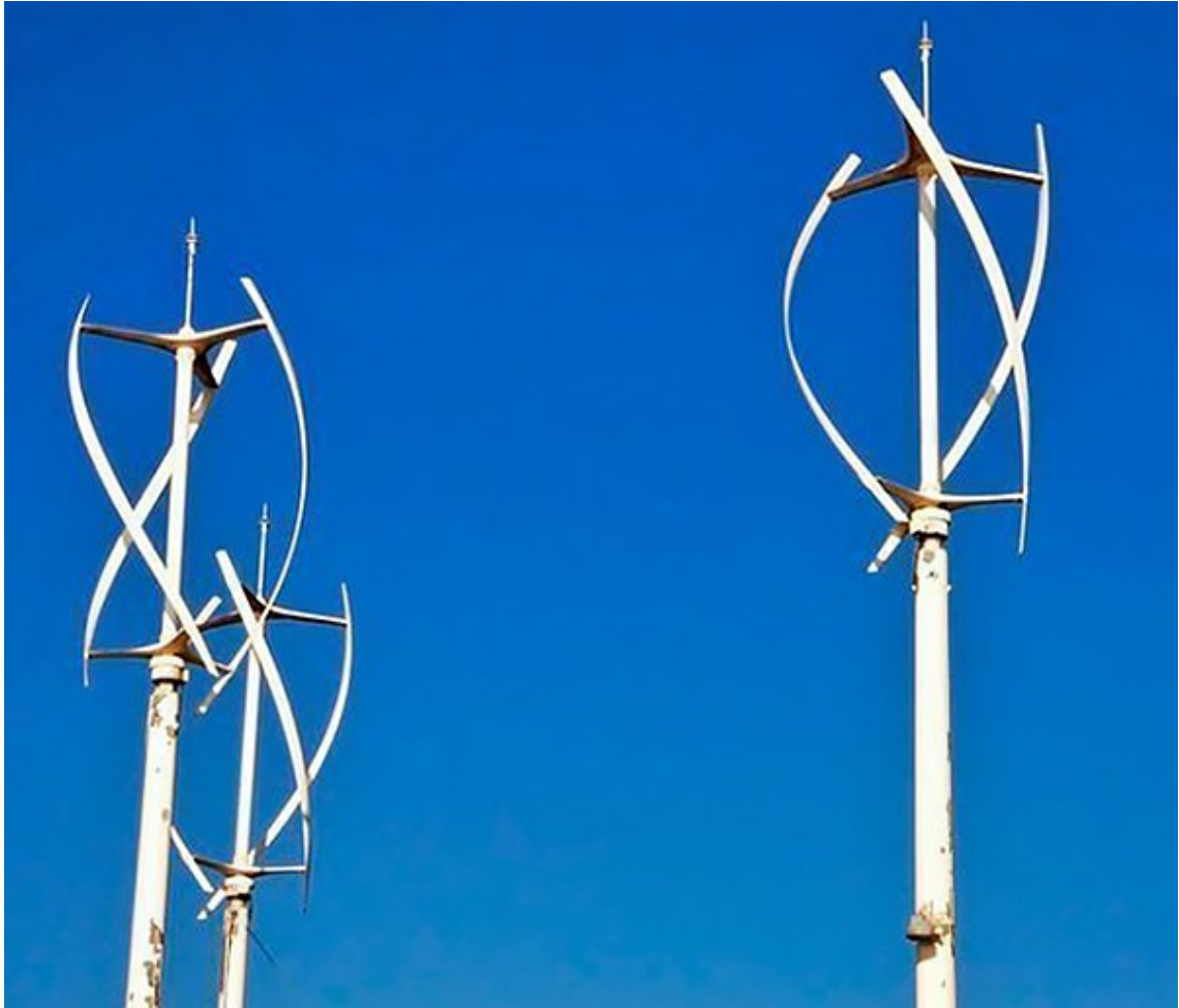
Kuva 1. Pystyakselinen pientuulivoimala, tyypiltään Darrieus [9].

Pystyakselisen voimalan etu on se, että se voi vastaanottaa tuulta mistä suunnasta tahansa, joten tuulen suunnalla ei ole vaikutusta voimalan toimintaan. Lisäksi itse voimalaa ei tarvitse käännellä tuulen suunnan mukaisesti. Tämä tarkoittaa myös sitä, että voimala on helpompi ja yksinkertaisempi suunnitella ja rakentaa. Lisäksi pystyakselinen voimala kestää paremmin koviakin tuulen nopeuksia, joten se soveltuu myös myrskyalttiille alueelle. Melua aiheutuu myös tyypillisesti vaaka-akselista voimalaa vähemmän, joten se on siltäkin osin soveltuva asuinalueiden käyttöön. Lisäksi pystyakseliset voimalat on myös helpompi sovittaa maisemaan ja arkkitehtuuriin kuin vaaka-akseliset voimalat, jotka mielletään usein maisemahaitaksi. Pystyakseliset voimalat ovat myös helposti muokattavissa kokonsa puolesta, joten voimaloita voidaan suunnitella monenlaisiin tarkoituksiin sopiviksi. [8, s. 10–11.]