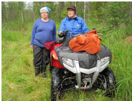
Kuva 1. Marjametsälle (Hjulberg 2015).

Janssonin (2022) mukaan luonto on tärkeä osa ikääntyvien parissa tehtävää työtä. Luonto on läsnä ihmisen elämässä, syntymästä kuolemaan. Luonto toki saa erilaisia merkityksiä elämänsä aikana. Se pihapihlaja, joka on merkityksellinen lapsuudesta jollekin toiselle, on toiselle vain yksi puu muiden joukossa.