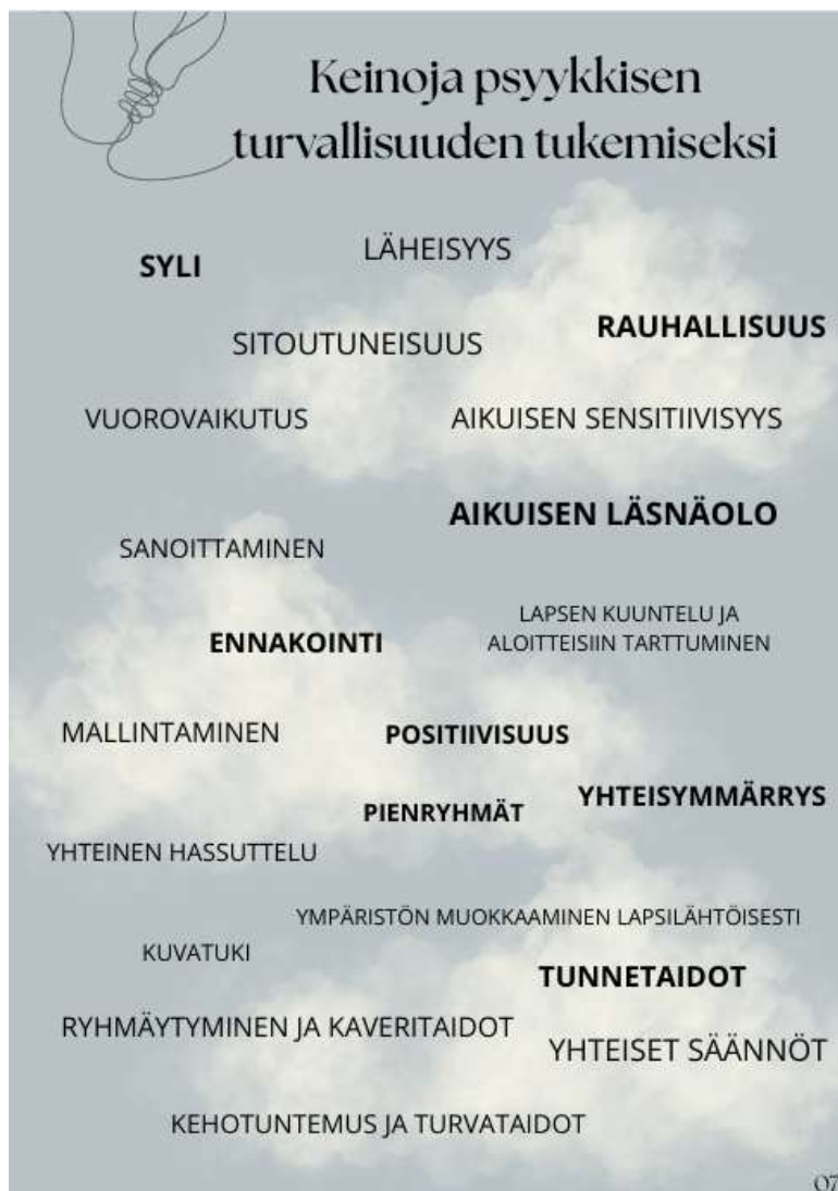
Kuva 3: Oppaan keinoja

Oppaaseen koottiin tiimeissä esiin tulleita keinoja ja toimintatapoja turvallisuuden ja turvallisuuden tunteen tukemisesta (ks. kuva 3). Keinot koottiin ainoastaan tiimeissä ja keskusteluissa esiin tulleista asioista. Tällä vahvistettiin ajatusta siitä, että henkilöstöllä oli jo olemassa olevia keinoja, ne täytyi vain tunnistaa ja ottaa tietoisemmin käyttöön. Oppaan sisältö pyrittiin luomaan vastaamaan työelämäkumppanin toiveita ja tarpeita vastaavaksi. Keinojen lisäksi tuotiin esiin eri menetelmiä, joita henkilöstö voi käyttää arjessa apuna. Menetelmävalinnoilla pyrittiin tuomaan esiin arjessa toimivia ja saavutettavia menetelmiä, jotka valikoitiin vastaamaan Brainwriting-menetelmän aikana esiin tulleisiin tarpeisiin.