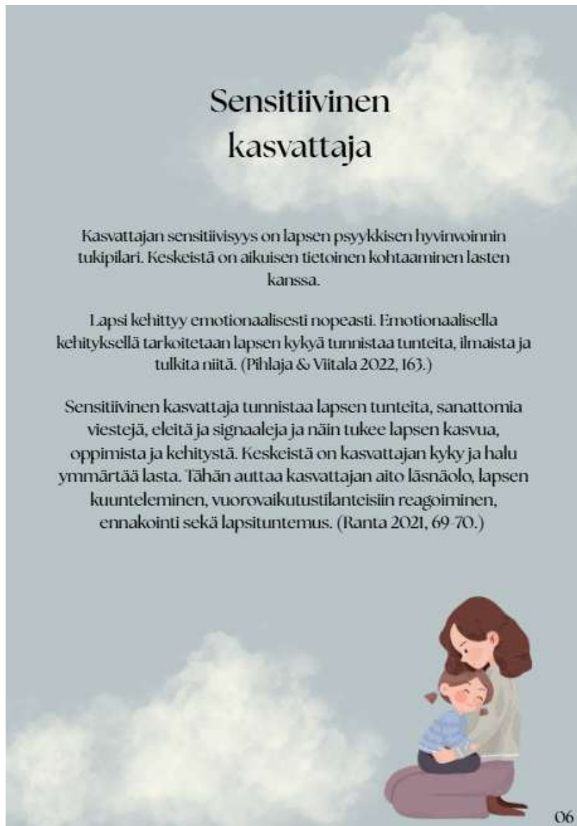
Kuva 2: Oppaan teoriaa

teoriaosuus koettiin tärkeäksi osaksi opasta, jotta saataisiin tuotua lisätietoa ja jo olemassa olevaa tietoa aiheesta henkilöstölle. Oppaan työstöä varten syvennettiin myös omaa ammatillisuutta koko prosessin ajan.