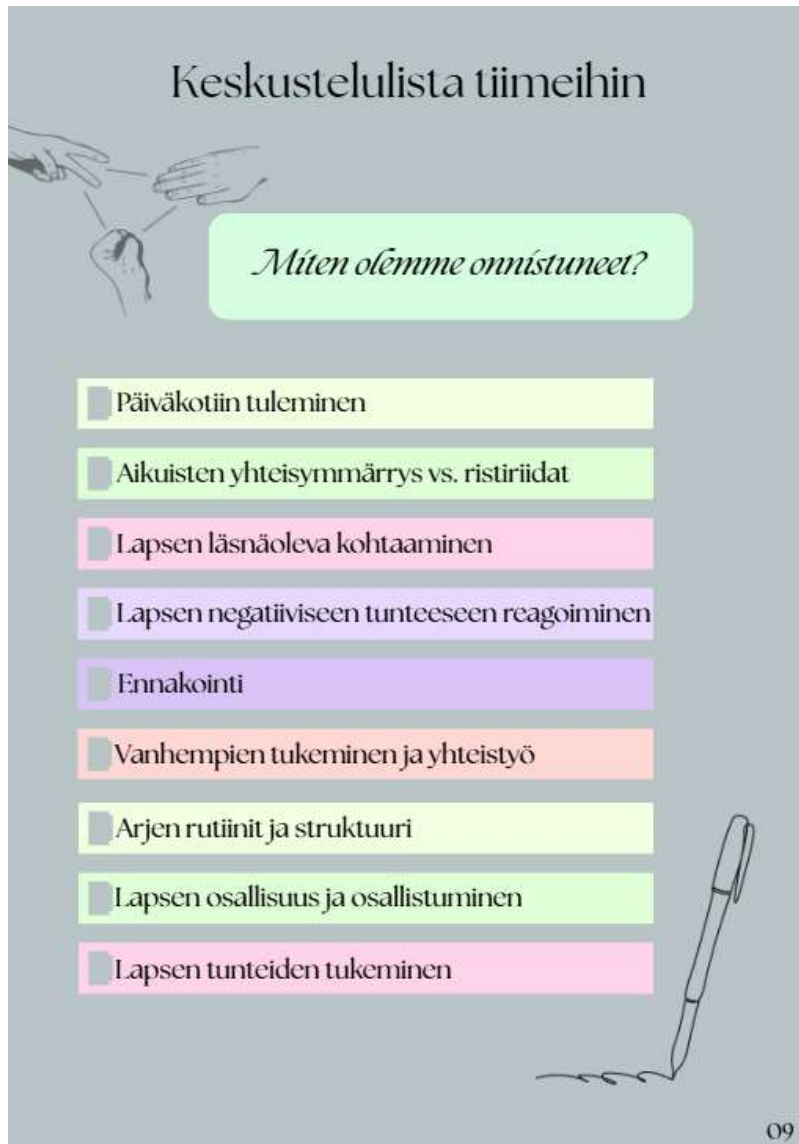
Kuva 4: Oppaan keskustelulista

Kuvasta 4 alla löytyy oppaan keskustelulista tiimien työn tueksi, jonka avulla tiimit voivat yhdessä keskustella psyykkisen turvallisuuden toteutumisesta arjen keskellä. Keskustelulistan tarkoituksena oli saada henkilöstölle valmis pohja, jonka avulla he voivat pohtia psyykkisen turvallisuuden tilanteiden kulkua ja toteutumista varhaiskasvatuksen arjessa.