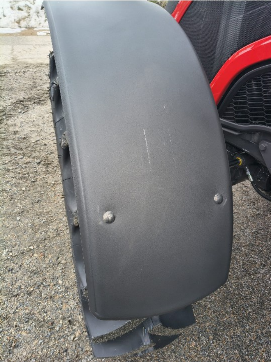
Kuvio 2. Ulkopinnat tulee tarkastaa huolella, jotta reklamaatioilta välttyään.

Kun terminaalityöntekijä on löytänyt traktorin, tulee hänen tehdä silmämääräinen katselmus. Maalipintavauriot, repsottavat lokasuojat ja muut irtonaiset osat tulee kirjata ylös ja ilmoittaa välittömästi Valtralle. Puutteet ilmoittamalla ajoissa välttyään reklamaatioilta ja aiheettomilta kustannuksilta.