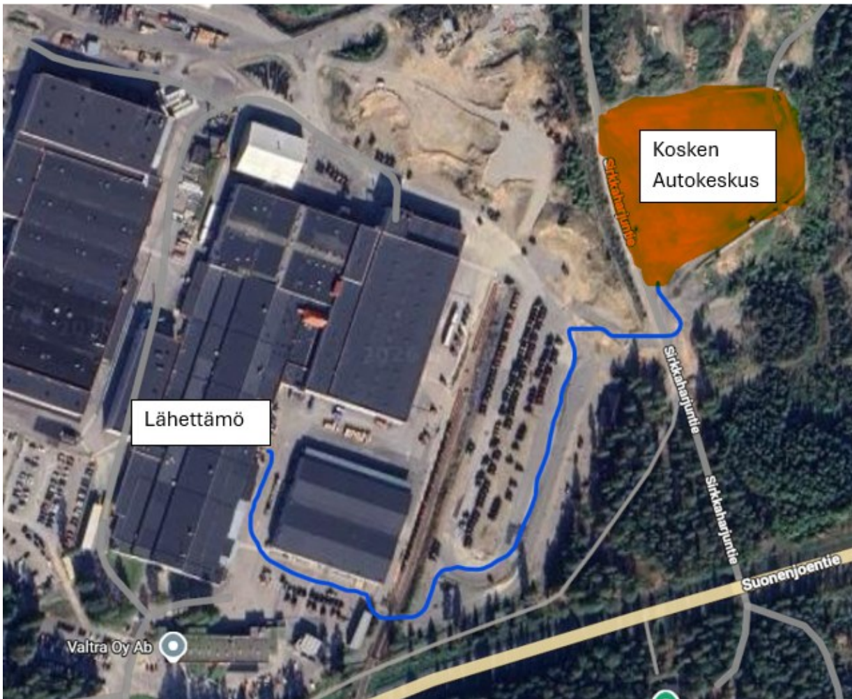
Kuvio 7. Kulkureitti lähettämöön.