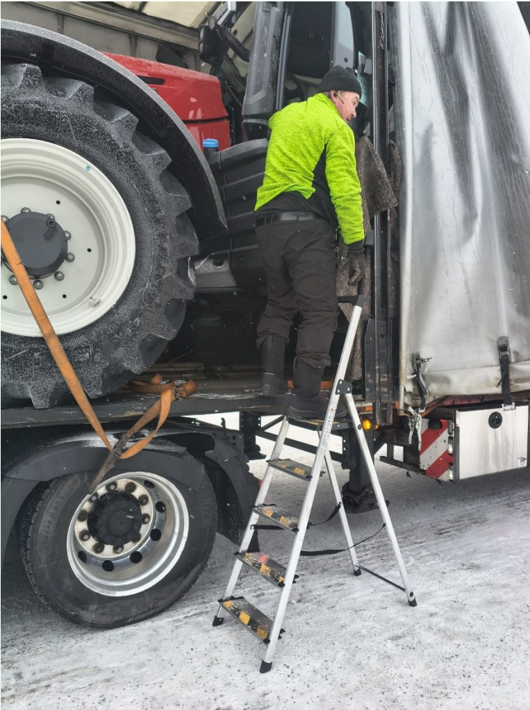
Kuvio 8. Kuljettaja laskeutumassa traktorista alas portaiden avulla.