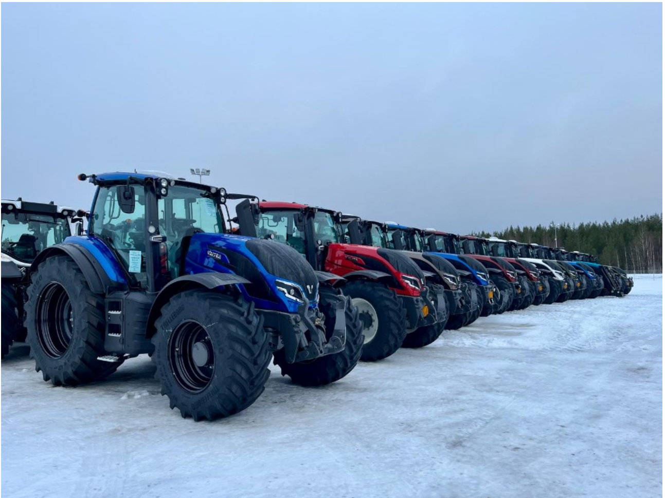
Kuvio 3. Valtran T-sarjan traktoreita terminaalissa.

Kosken Autokeskuksen Suolahden traktoriterminaali on klassinen esimerkki välivarastosta, jota hyödynnetään asiakkaan tuotannon sujuvoittamiseksi (Tikka 2016). Kun valmistuneet koneet saadaan siirrettyä pois Valtran pihasta tilaa viemästä, se antaa heille mahdollisuuden tuottaa lisää traktoreita ja sitä kautta kasvattaa liikevaihtoa. Valtra saa välittömästi laskutettua traktorin, kun se siirtyy pois heidän pihastaan, joten he voivat kasvattaa volyymiaan, kun pääoma saadaan kiertoon.