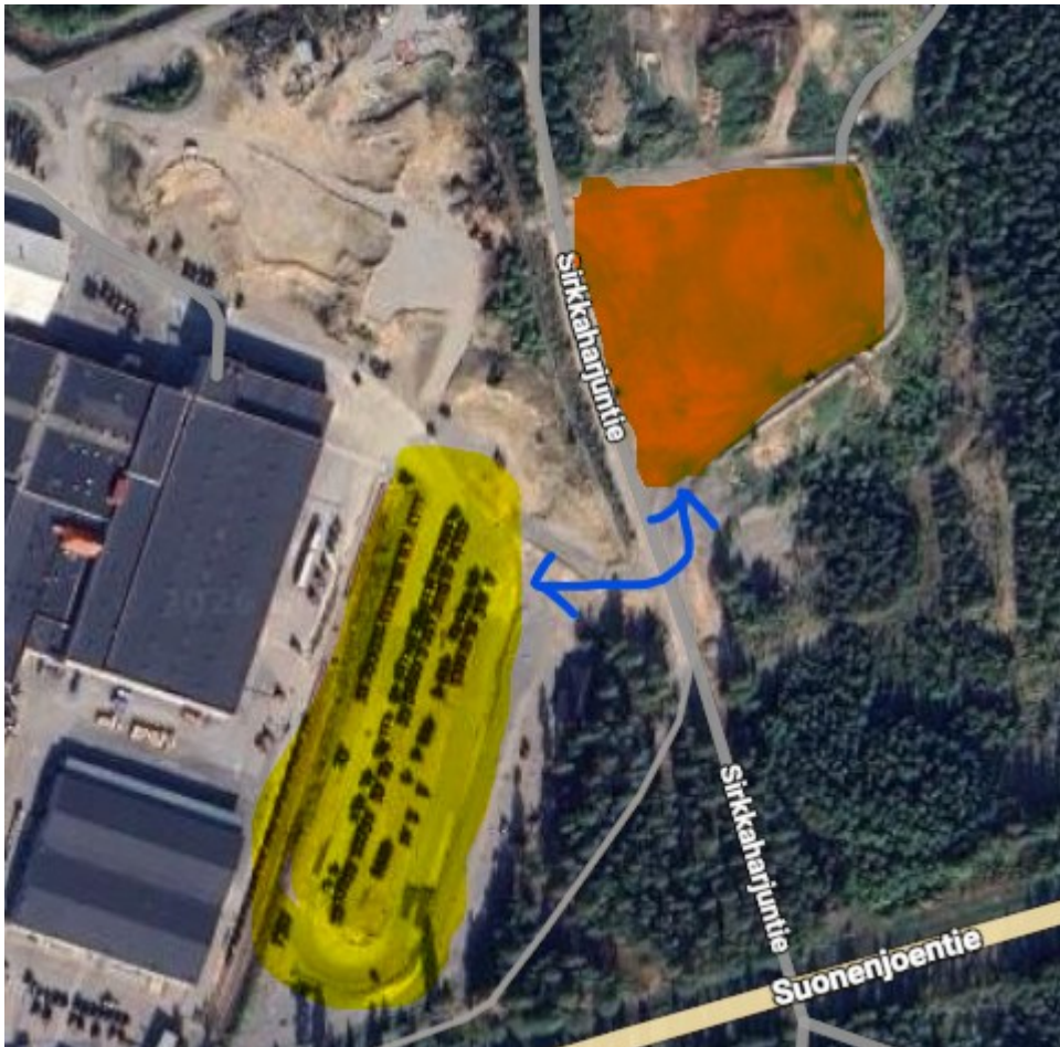
Kuvio 5. Valtran traktorikenttä sekä Kosken Autokeskuksen terminaali Google Mapsin satelliittikuvasta.

Traktorin sijoittelussa on lisäksi otettava huomioon, terminaalityöntekijän kävelymatka. Yleisimmät traktorityypit tulisi sijoittaa mahdollisimman lähelle kulkureittiä. Koneita haetaan kävellen, joten askeleiden määrä tulee minimoida, jotta kävelyyhyn kulutettua aikaa saadaan pienennettyä. Muille kuljetusyrityksille koneita menee suhteessa vähemmän, kuin omalle yritykselle, joten ne voidaan sijoittaa kauempaan nurkkaukseen. Ulkopuolisten yritysten traktorit eivät myöskään tarvitse erillistä sarjoittaista erittelyä.