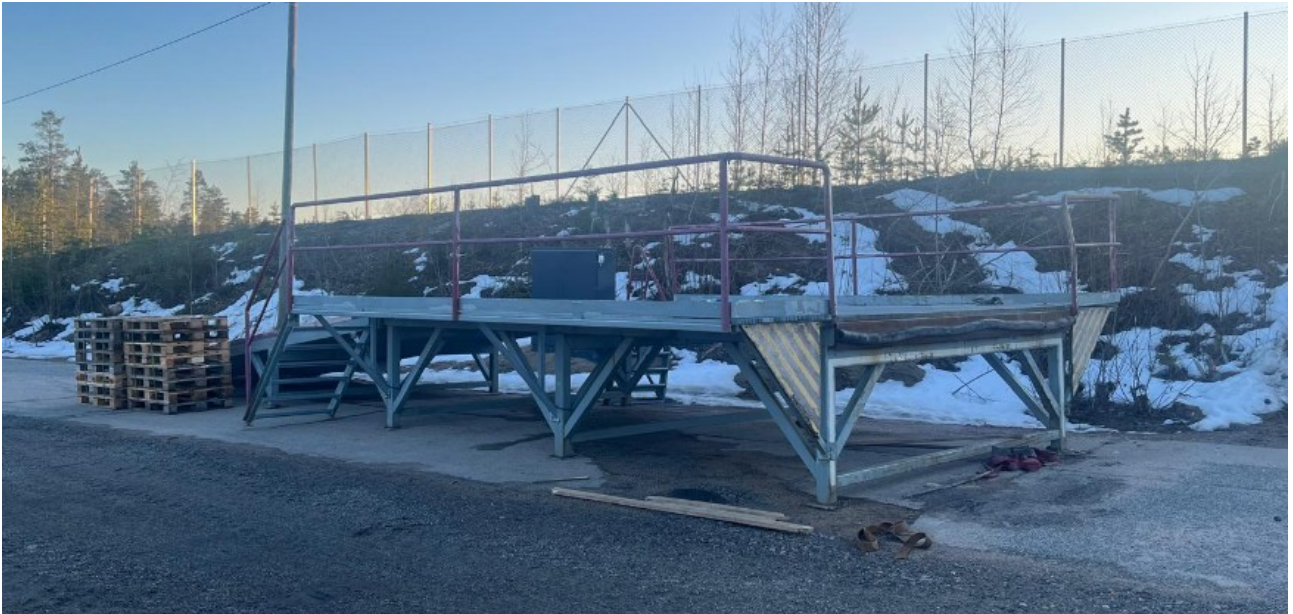
Kuvio 4. Lastausramppi.

Traktorit sidotaan kuljetuskalustoon liinoilla ja/tai ketjuilla. Sidontaan on annettu Valtran puolesta tarkat ohjeet. Sidontavälineitä ei saa vetää akseleiden tai nostolaitteiden päältä, jotta maalipinnat eivät vaurioidu, vaan traktorit kiinnitetään renkaiden päältä.