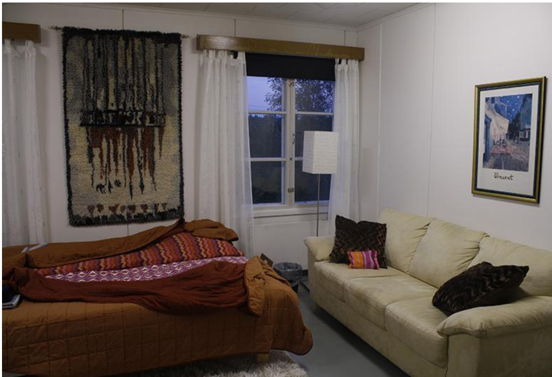
Kuva 3, Majatalo Yli-iissä (Luoma 2014)

”Innostamisen ohjelmien ja projektien toteuttamisen perustaksi on tunnettava se todellisuus, jossa toiminnan on tarkoitus tapahtua. Siksi tietyt ”arkeologiset” tutkimusmatkat siihen ympäristöön, missä toimintaa aiotaan käynnistää, ovat välttämättömiä.”