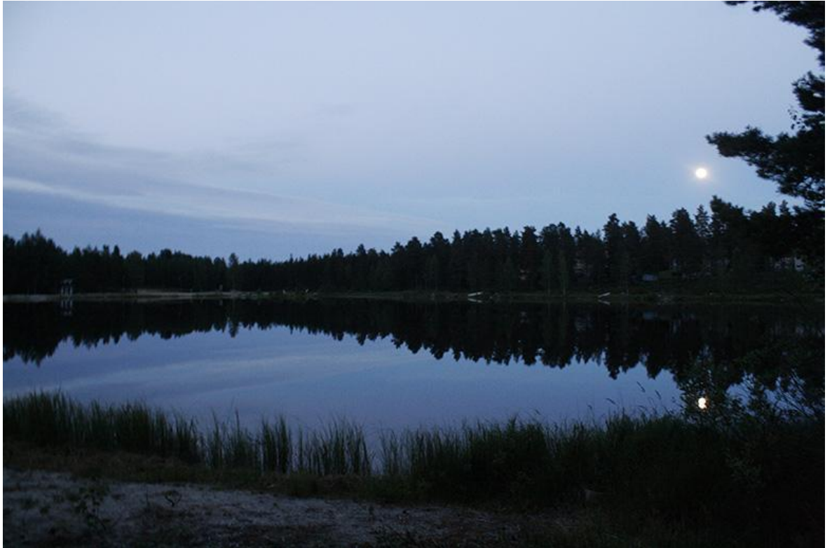
Kuva 6, Villenranta, Sievi (Luoma 2014)

Tavallinen vuorokausirytmimme oli se, että aamupäivällä n. klo 12-14:n välillä katusoitimme, jonka jälkeen kävimme kokoamassa ajatuksiamme päivän soitoista päiväkirjaamme sekä teimme matkasuunnitelman seuraavaan kaupunkiin saakka. Pyöräilemään lähdimme n. klo 15-16:n ja päivän matkasta riippuen olimme perillä seuraavassa kaupungissa illalla klo 20-23:n välillä. Ilta-ajan jälkeen leiriydyimme ja menimme nukkumaan.