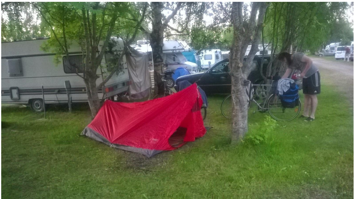
Kuva 5, Kaustisen leirintäalue (2014)

Yövyimme matkan aikana pääosin teltassa. Kokemukset telttayöpymisestä olivat hyvinkin vaihtelevia ja toisinaan oli oman terveyden puolesta kannattavaa satsata parempaan yöpymismahdollisuuteen. Lisäksi pääsimme muutaman kerran yöpymään myös oikeassa sängyssä teltan ja makuupussin sijaan. Hyvät yöunet raskaan fyysisen päivän ovat myös merkittävä tekijä katusoittamisen kannalta.