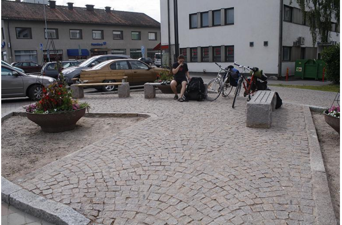
Kuva 7, Ylivieskan soittopaikka, Myllypuro (Luoma 2014)

serttitilanteesta, jossa kuulijoiden pääasiallinen huomio on soittajassa. Kuten Perttiläkin (2010, 14) opinnäytetyössään huomioi, katusoittotilanne on osittain konserttimainen ja osittain vain taustamusiikkia. Pääasiallinen huomio ei ole katusoittajassa kuin vain hetkellisesti.