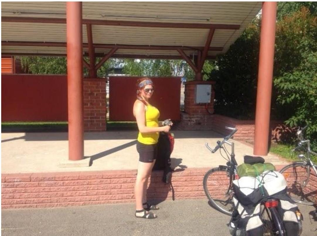
Kuva 8 Pudasjärven torin katusoittopaikka (Törmä 2014)

tuneisuus. Jokaisen katusoitto-kerran jälkeen tuli mietittyä aina uudestaan, että ei-pä tämä nyt taas tämän kauheampaa ollut. Jossain vaiheessa soittamista tapahtui aina myös se, mikä katusoittoamisesta tekee hienoa; unohti esiintyvänsä ja nautti vain musiikista. Koemme, että tällöin tunne välittyy myös yleisölle.