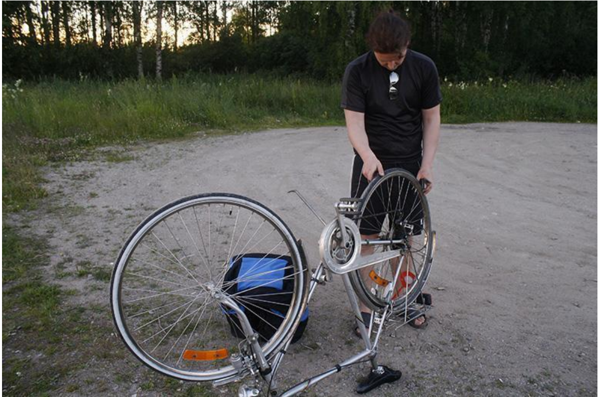
Kuva 1, Vastoinkäymiset ovat väistämättömiä, Vimpeli (Luoma 2014)