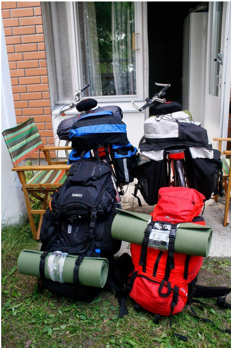
Kuva 4, Pyörät ja varusteet (Luoma 2014)

Halusimme katusoittamisen lisäksi taittaa välimatkat nimenomaan pyöräillen sen sijaan, että olisimme matkustaneet junalla tai autolla. Pyöräilyn valitsimme omasta mielenkiinnostamme nähdä Suomea uudesta kulmasta sekä halustamme haastaa itsemme fyysisesti ja psyykkisesti. Näemme lisäksi, että tietynlainen matkustus-kulttuuri on olennainen osa kiertävän katusoittajan arkea ja halusimme lisätä myöskin tämän näkökulman opinnäytetyöhömmö sekä tutkia myös, miten pyörällä reissaaminen vaikuttaa katusoittamiseen.