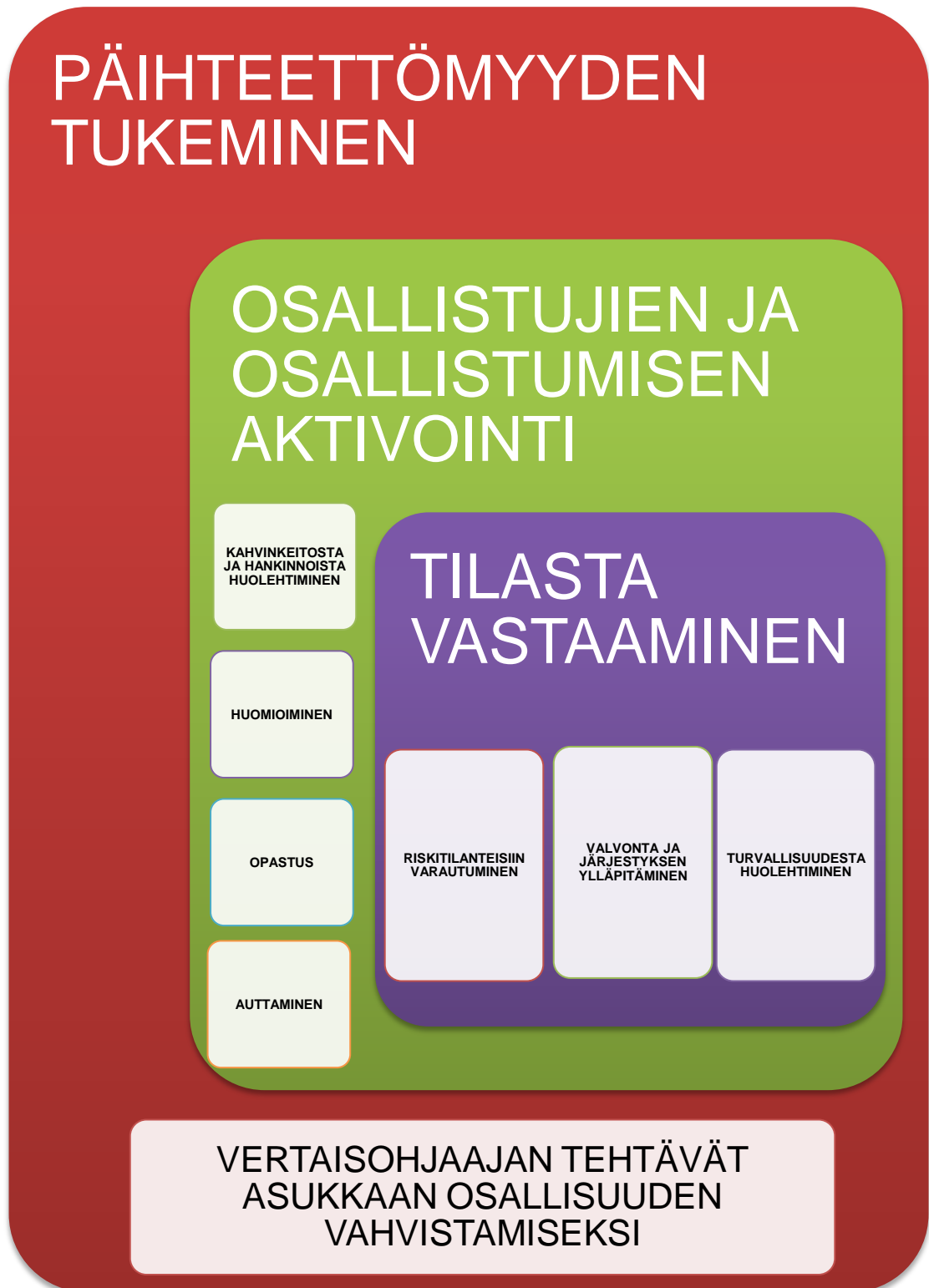
kuvio 2. Tutkimuksellisen kehittämistyön tuloksien pohjalta ”Vertaisohjaajan tehtävät asukkaan osallisuuden vahvistamiseksi”