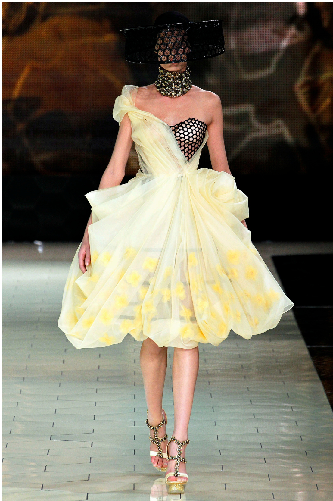
Figur 7. Surrande sekreterare