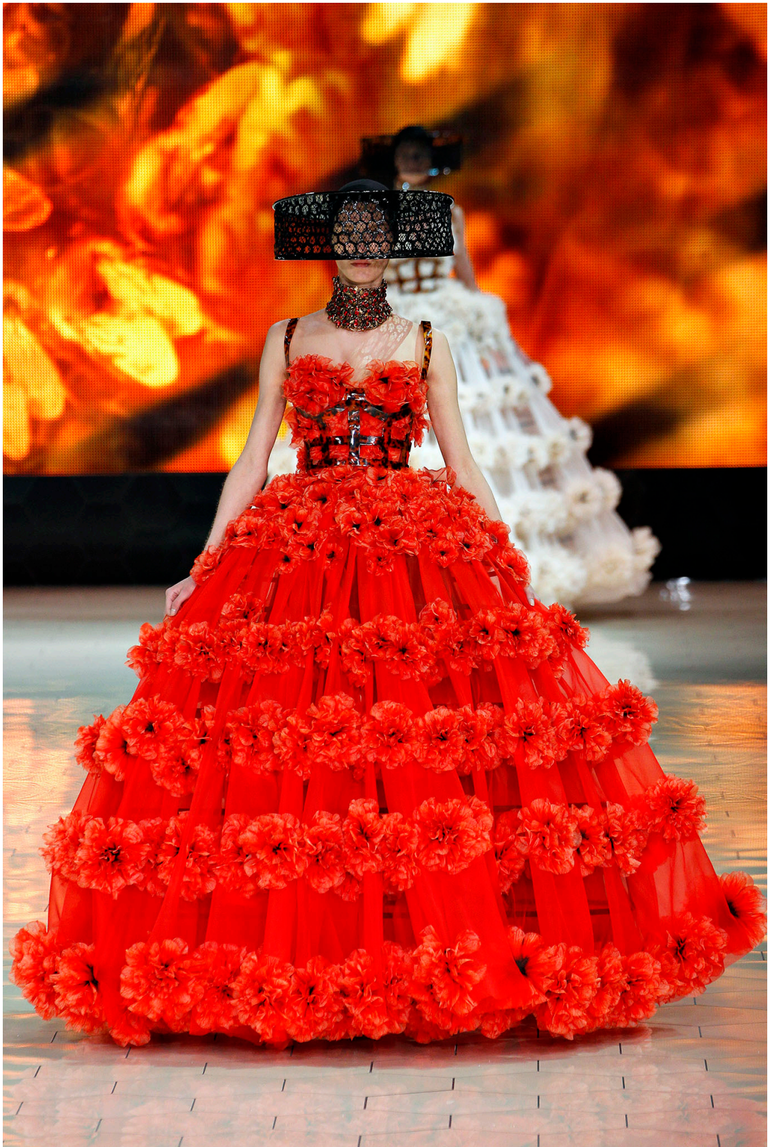
Figur 8. Bidrottning