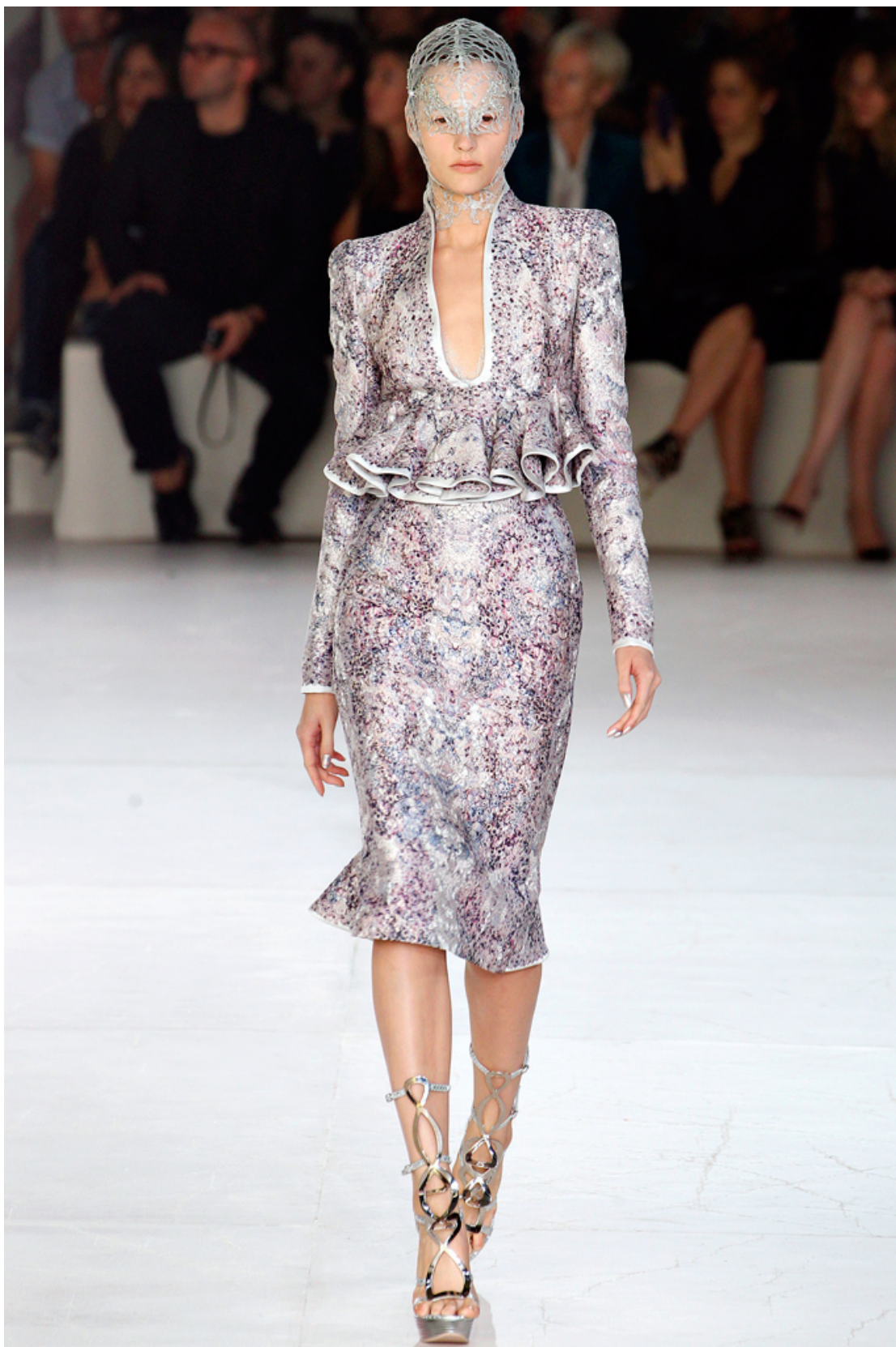
Figur 6. Sofistikerad och vulgär