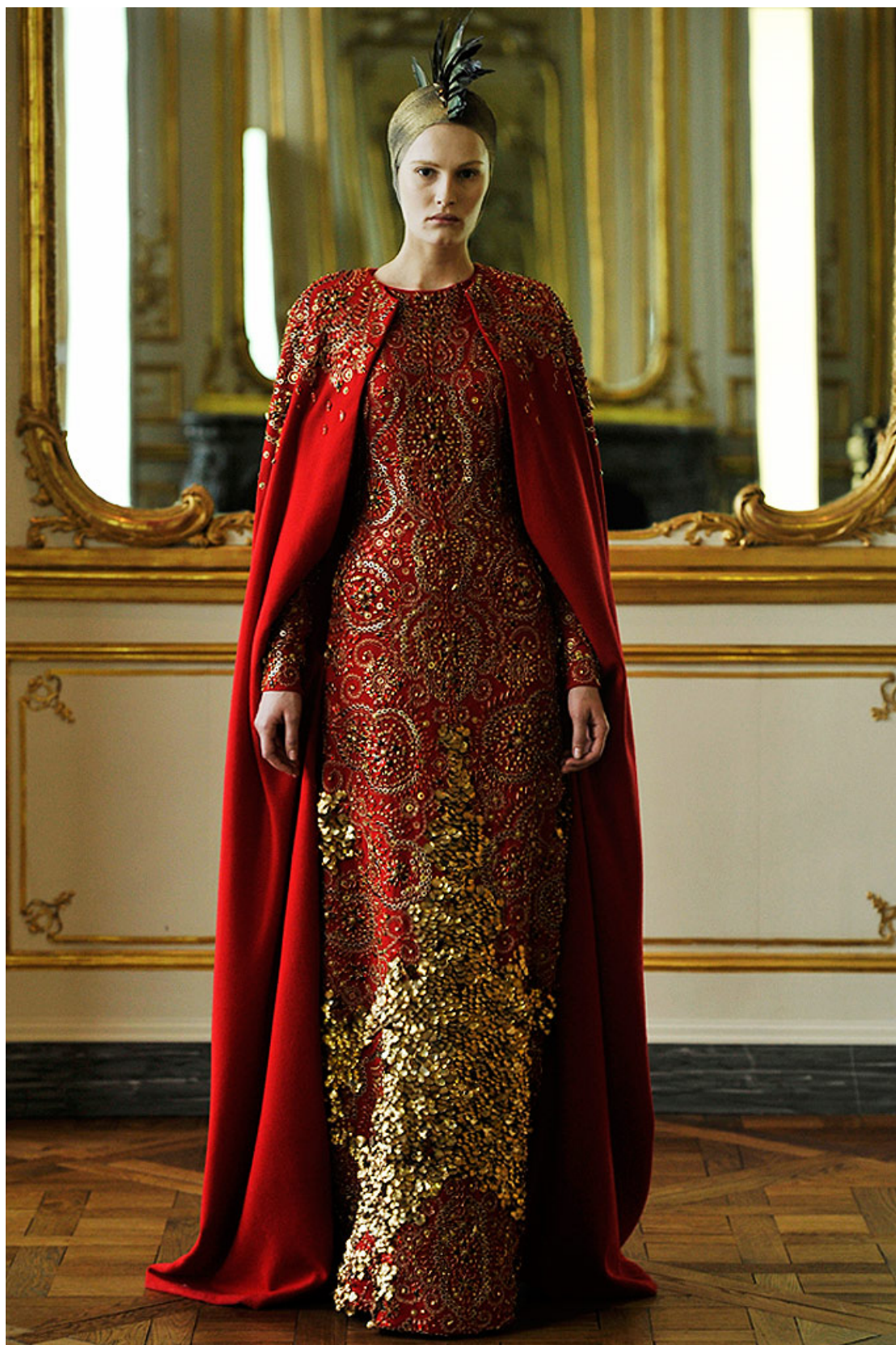
Figur 3. Legendarisk kreation