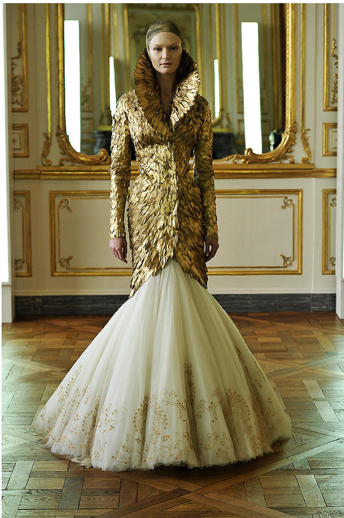
Figur 4. Änglaskapelse