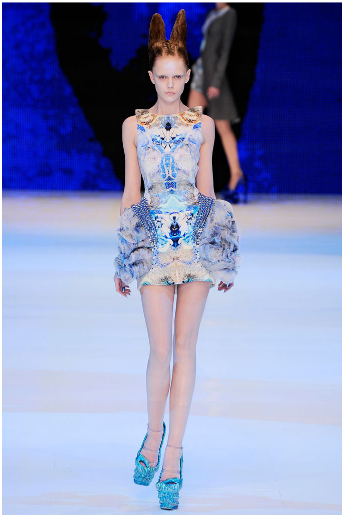
Figur 1. Feminint- korallrev