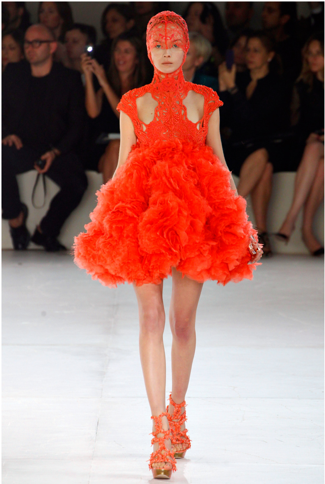
Figur 5. Giftig sockervadd