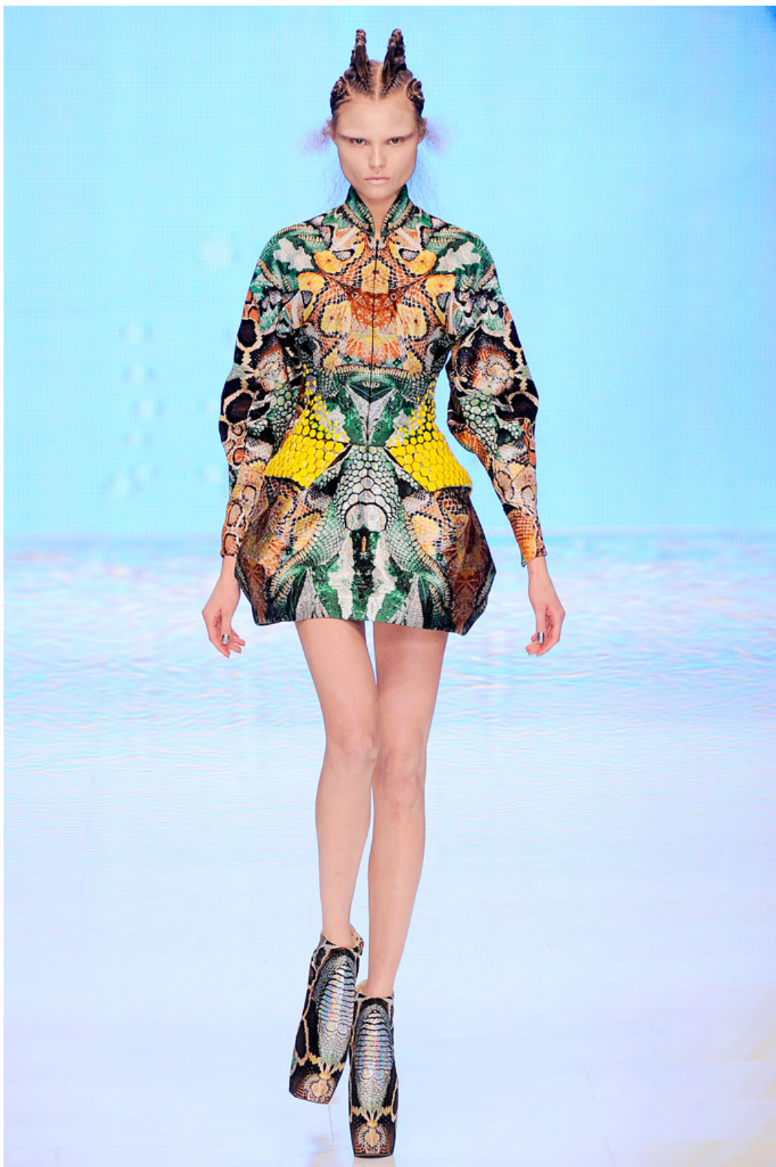
Figur 2. Mode-reptil