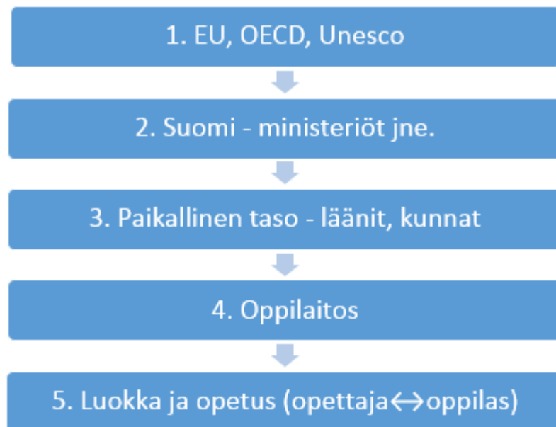
Kuvio 1 Yrittäjyyskasvatus monikerroksisena ilmiönä (Pihkala ym. 2011, 30–32.)

Yrittäjyyskasvatuksen tavoitteet ja strategiat eivät välity suoraan EU:lta luokkaopetukseen, vaan yrityskasvatuksen toteutuminen oppilaitoksissa rakentuu erilaisten toimijoiden portaittaisesta yhteistyöstä. Tämän hallintorakenteen eri toimijoiden sekä niiden välisten toimintojen sujuva yhteistyö on järjestelmän toiminnan kannalta ensiarvoisen tärkeää. Kuvio 1 selventää yrittäjyyskasvatuksen hallintorakennetta monikerroksisena poliittisena kokonaisuutena. (Pihkala ym. 2011, 30–32.)