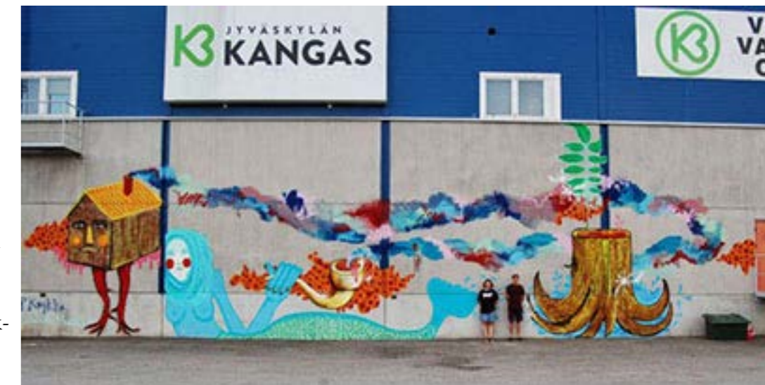
Seinämaalaukset, Ryminä 2014