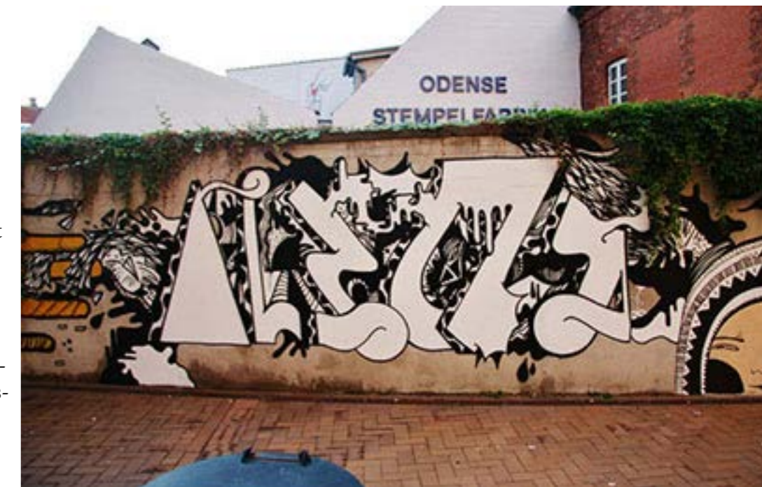
Graffiti maalaus, Kunsthallen Brandts, Odense Tanska