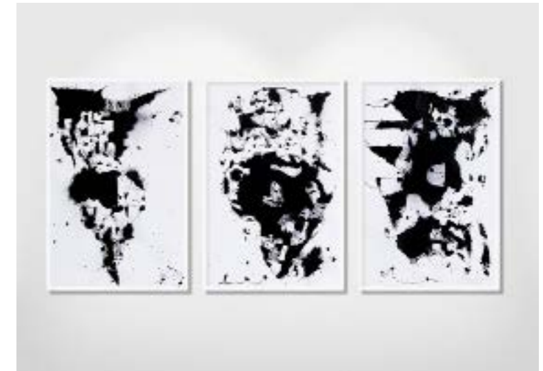
World Map Triptych, 2014, indian ink on watercolor paper, 3 x 100 x 70