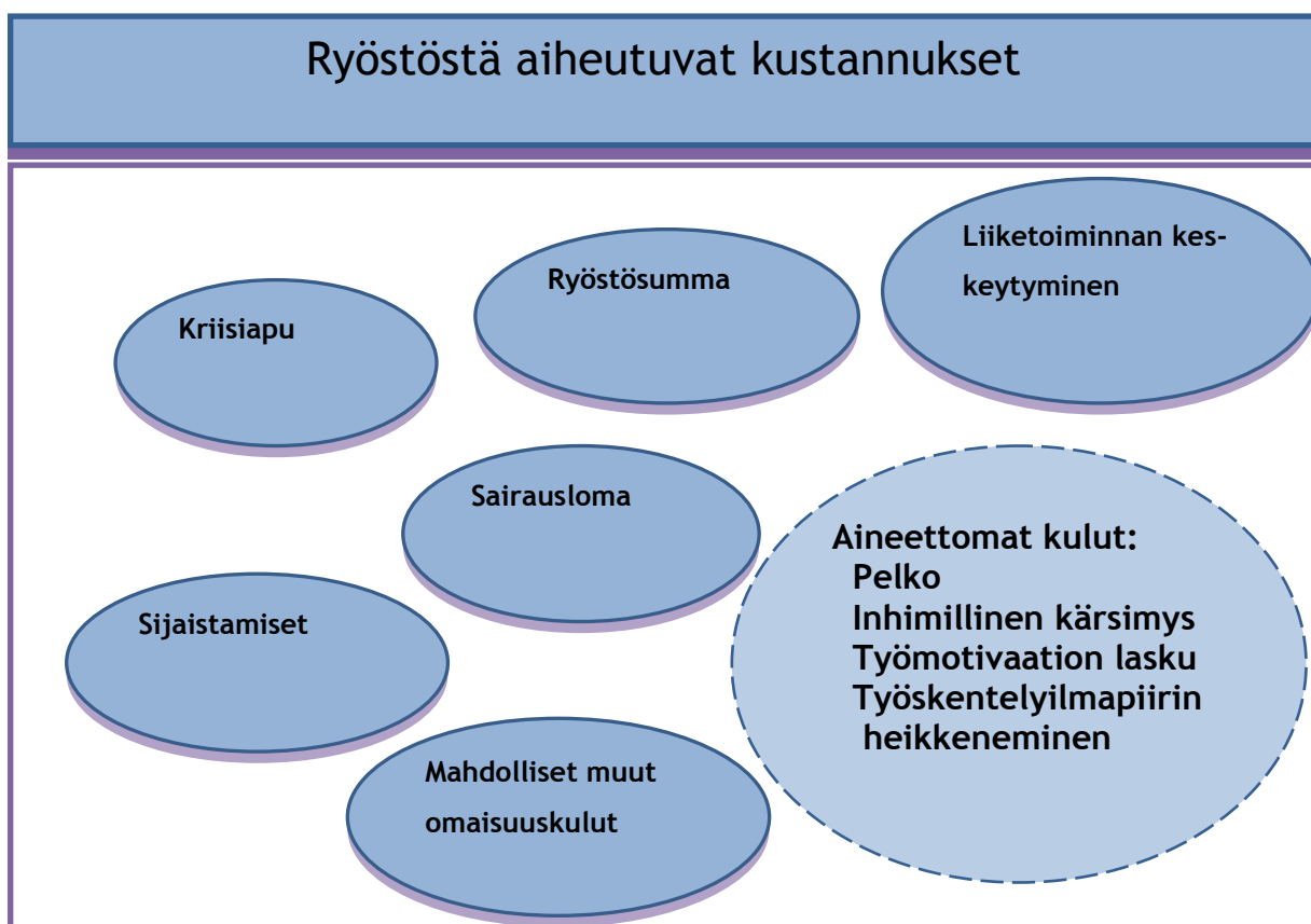
Kuvio 3. Ryöstön mahdollisesti aiheuttamat kustannukset

Edellä mainittujen kustannusten lisäksi on runsaasti aineettomia kustannuksia, joille on mahdotonta laskea tarkkaa rahallista arvoa. Näitä ovat esimerkiksi pelko ja siitä aiheutuva inhimillinen kärsimys sekä mahdollisesti työmotivaation lasku ja koko myymälän työskentelyilmapiirin heikkeneminen. Työntekijät ovat yritykselle toisaalta suuri voimavara ja toisaalta suuri riski. Työkykyinen ja tuottava henkilökunta on yritykselle elinehto toimialasta riippumatta, mutta palvelualalla sen merkitys korostuu entisestään. Väärästä kuormituksesta oirehtiva henkilöstö puolestaan heikentää yrityksen kannattavuutta: tyytymättömät työntekijät eivät ole kiinnostuneita antamaan täyttä panosta yrityksen kannattavuudelle. (Sosiaali- ja terveystieteiden tutkimuskeskus 2013; Hietala, Kaivanto & Kuikko 2006, 12-13.) Sitä vastoin työhyvinvoinnin lisääminen vaikuttaa positiivisesti työpaikan työskentelyilmapiiriin, ja voi näin tehostaa tuottavuutta.