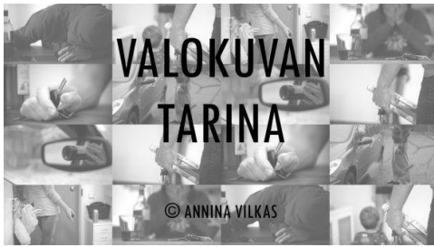
KUVA 2. Kuvasarjan kuvien kääntöpuoli