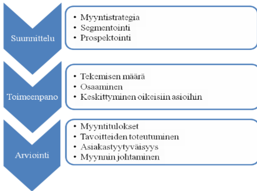
Kuvio 1. Myyntiprosessin johtaminen (mukailee kuviota Nieminen & Tomperi 2008, 74).

Myyntiprosessin ensimmäinen vaihe on myynnin suunnittelu, joka toteutetaan myyntistrategian avulla. Toisena vaiheena on myynnin toimeenpano, joka tarkoituksena on tehostaa myynnin organisointia ja kohdentaa resursseja oikeisiin kohteisiin. Viimeisempänä vaiheena on seuranta arviointi, jotka ovat erittäin merkittäviä toimia myynnin kehittämisen kannalta. (Nieminen & Tomperi 2008, 73.)