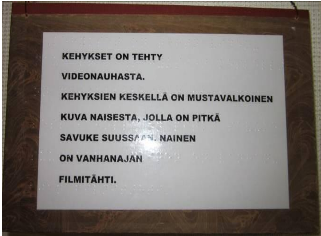
KUVIO 5. Kuvailu taideteokseen