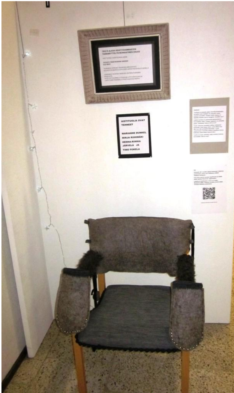
KUVIO 8. Aistituoli näyttelyssä