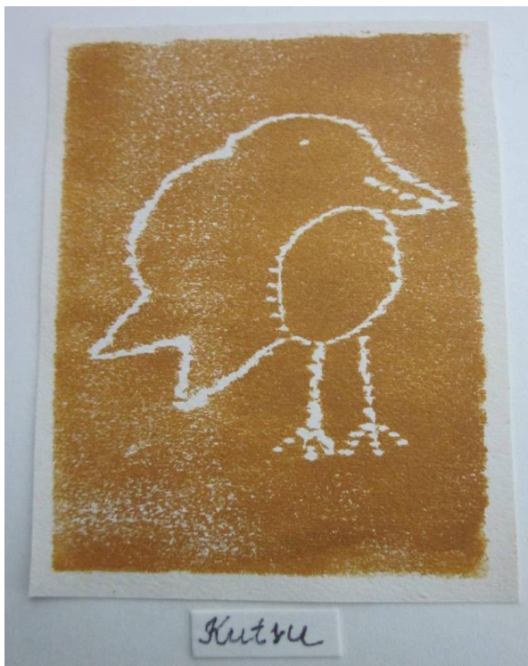
KUVIO 2. Kutsukortti