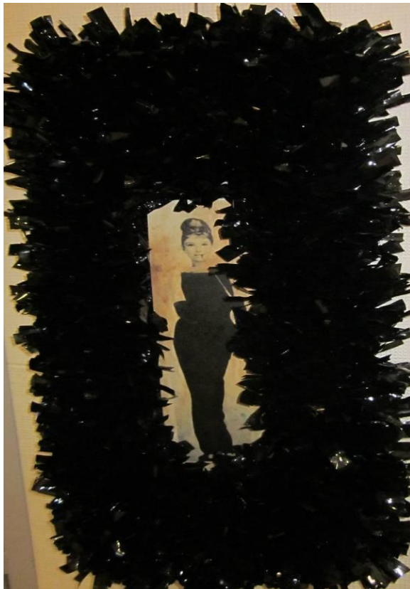
KUVIO 6. Kosketeltava taideteos