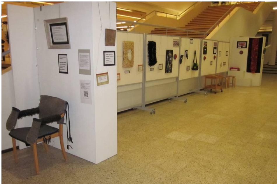
KUVIO 9. Asettelu näyttelyssä

Moniaistisessa taidenäyttelyssä taideteokset kiinnitettiin sermeihin ja sermit aseteltiin toinen toisensa viereen niin, että näyttely oli selkeä jatkumo, jolla oli myös selkeä aloitus. Tämän ajatuksena oli, että mahdollisimman moni henkilö pystyisi taideteoksiin tutustumaan itsenäisesti.