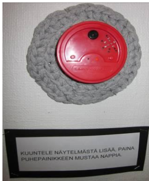
KUVIO 4. Puhepainike

Näyttelyssä oli neljän vesivärimaalauksen kollaasi, jossa oli kuvattuna Vaaja-harjun toimintakeskuksen asiakkaiden sekä ohjaajien esittämä näytelmä ”Kokateissa roiskuu”. Tästä näytelmästä oli mahdollista kuunnella puhepainikkeeseen tallennettu kuvaus. Myös taiteilijoista otettujen kuvien yhteydessä oli pienet puhepainikkeet, joista kuuntelemalla kuuli selkokielisten, lyhyen kuvauksen siitä, mitä valokuviiin oli kuvattuna.