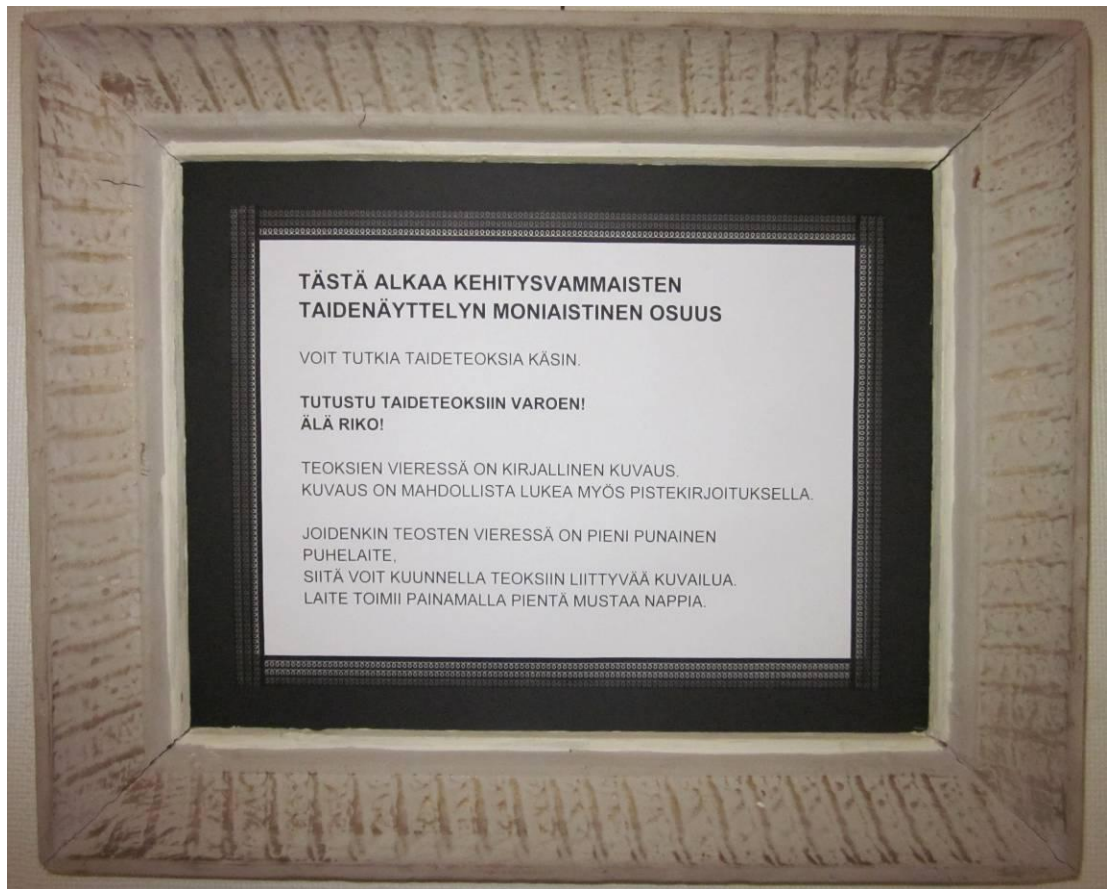
KUVIO 10. Ohjeistus näyttelyyn

tutustuessa. Vaikka teosten tunnusteleminen ja tutustuminen oli sallittua ja suotavaa, piti tämä kuitenkin tehdä varoen, teoksia rikkomatta.