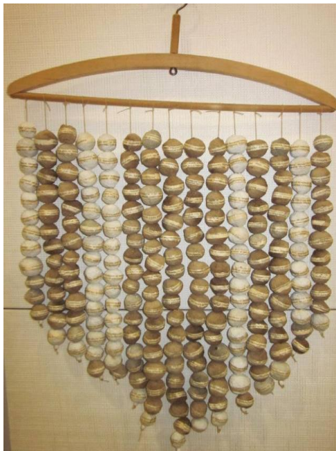
KUVIO 3. Kosketeltava taideteos

Kaikki moniaistisessa taidenäyttelyssä olevat teokset olivat sellaisia, että niitä oli mahdollisuus tutkia ja tunnustella käsin. Tutkimalla taideteoksia käsin näkövammaiset henkilöt pystyvät muodostamaan käsityksen taideteoksesta. Muille kuin näkövammaisille käsin tutkiminen ja materiaalien tunnusteleminen antoi lisätietoa taideteoksesta sekä aistikokemuksia. Taideteoksissa oli käytetty monia mielenkiintoisia materiaaleja, kuten videonauhaa, vanhoja kirjan sivuja, kenkiä, laukkuja sekä mosaiikkeja. Materiaalit olivat kaikki kierätettyjä ja ne tarjosivat tutkijoilleen monenlaisia aistikokemuksia. Kosketeltavissa taideteokset valittiin niin, että niitä olisi turvallista käsin tutkia.