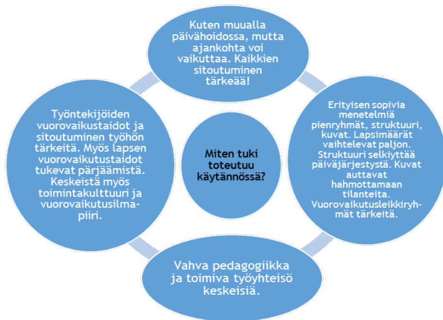
Kuvio 4. Tuen toteutuminen käytännössä.