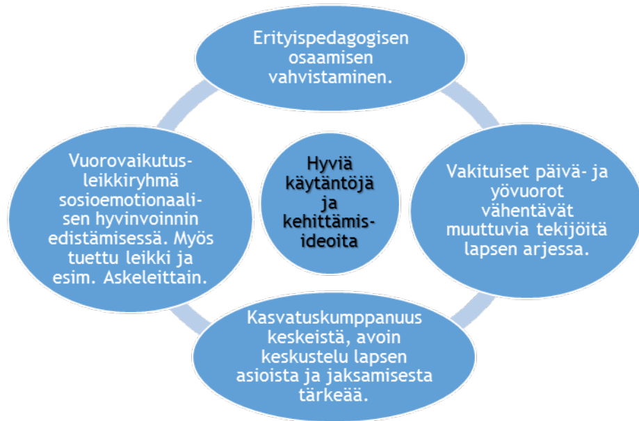
Kuvio 5. Hyviä käytäntöjä ja kehittämisideoita.

Myös kasvatuskumppanuuden ja muun aikuisten väliseen toimivaan yhteistyöhön liittyvät asiat ovat samassa linjassa aiemman tiedon kanssa. Huhtanen (2004, 75) mukaan perheen voimavaroja voidaan vahvistaa avoimella ja keskustelevalle kumppanuudella, jonka lähtökohtana on kunnioitus, luottamus ja osallisuus.