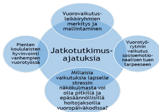
Kuvio 6. Jatkotutkimusajatuksia.