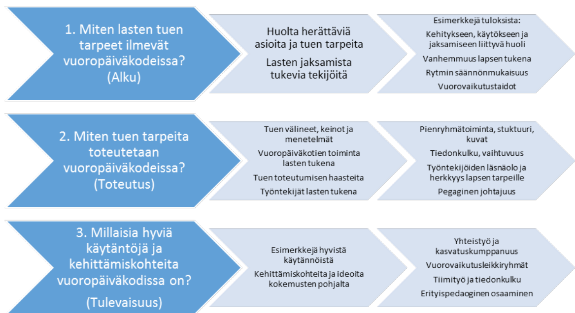
Kuvio 2. Tutkimuskysymykset, teemoittelun pääteemat ja aineistosta muodostuneet alateemat sekä esimerkkejä tuloksista.

Tuen alkuvaiheen tekijöihin ja vallitseviin olosuhteisiin liittyen nousivat huoltien heräämiseen, tuen tarpeen ilmenemiseen ja lapsen jaksamiseen liittyvät ilmaukset.