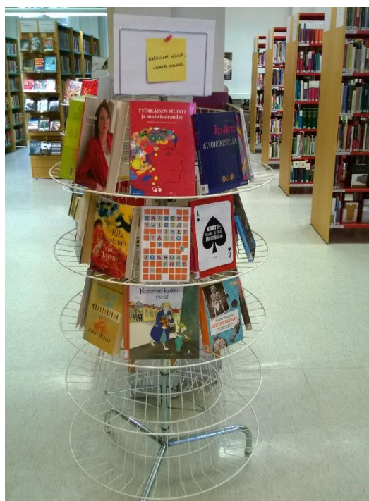
Kuva 8. Loimaan pääkirjaston aineistoesittely omaishoidon teemasta.

Ajankohtaisten aiheiden seuraaminen ja niiden esittely on hyvä keino esitellä kirjaston kokoelmaa. Ajankohtaisia aiheita voi seurata eri medioista. Ajankohtaisuuksiin voidaan laskea myös teemapäiviin kiinnittyvät aiheet. Esimerkiksi kaikissa Loisto-kirjastoissa kävi edustaja paikallisesta Omaishoitajien liitosta, ja monissa kirjastoissa koottiin tähän aiheeseen liittyvää kirjallisuutta aineistoesittelyyn. Kuvassa kahdeksan on esimerkki Loimaan pääkirjaston esittelystä, jota on jatkettu jo melko pitkään itse vierailun jälkeen sen suosion vuoksi. Esittelyyn on koottu paitsi omaishoitoon liittyvää materiaalia, myös muistisairauksia yms. koskevaa kirjallisuutta.