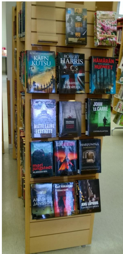
Kuva 1. Loimaan pääkirjaston hyllynpäätiesittely.

Yksinkertaisimmillaan aineistoesittely voi olla sitä, että hyllyjen pätyihin tai hyllyille on poimittu teoksia niin, että niiden kansikuvat näkyvät. Karhusen tutkielmassa todetaan, että sijoitettaessa kirjoja hyllyyn siten, että vain selkämykset näkyvät, asiakkailta vaaditaan kirjaston luokittelun tuntemusta. Kirjan kansien esittely taas edistää impulsiivista toimintaa. (Karhunen 2014, 14.) Kuvassa 1 on hyllynpäätiesittely Loimaan pääkirjastosta. Esittelyyn ei ole valittu erityistä teemaa, vaan siihen on poimittu hyväkuntoisia ja vaihtelevia teoksia, joiden tarkoitus on herättää mielenkiintoa asiakkaissa.