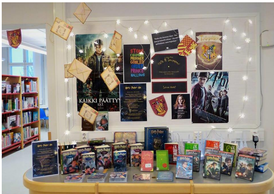
Kuva 7. Loimaan pääkirjaston Harry Potter -näyttely.

Kokonaisten kirjallisuuden lajin sijaan voin esitellä myös yhtä kirjaa/kirjasarjaa ja siihen liittyviä hahmoja. Joidenkin teosten ympärille on noussut suoranaisia ilmiöitä. Tästä hyvä esimerkki on Loimaan pääkirjaston Harry Potter -näyttely (Kuva 7). Näyttely liittyi Harry Potter -päivään, jota vietettiin 5.2.2015. Vaikka J. K. Rowlingin Harry Potterit ovat jo monille tuttuja, aineistoesittely saattaa kuitenkin houkuttaa vielä uusia lukijoita.