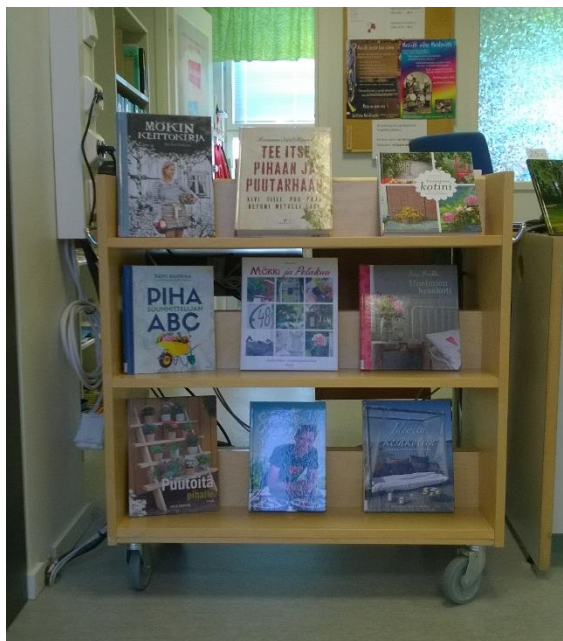
Kuva 5. Oripään kunnankirjaston aineistoesittely puutarhasta ja mökkeilystä.

Myös tieteet ja taiteet on laaja aihealue, joka kattaa aloja aina tähtitieteestä kuvanveistoon. Tähän sisältyy myös eri eläinlajien esittely. Sekä lemmikki- että villieläimistä voi tehdä aineistoesittelyä esimerkiksi maailman eläinten päivänä 4.10.