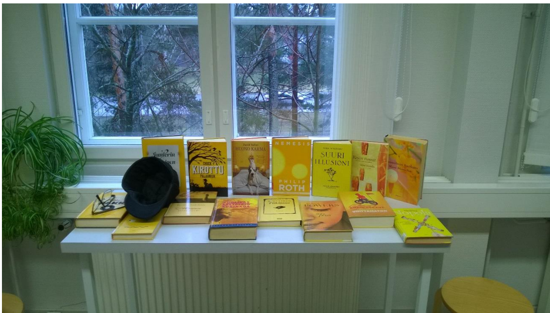
Kuva 2. Loimaan pääkirjaston aineistoesittely keväisen keltaisista kirjoista.

Aineistoesittelyn ei välttämättä tarvitse koostua vain tieto- tai kaunokirjallisuudesta, vaan niitä kannattaa yhdistellä. Esimerkiksi jostakin maasta kertovaan näyttelyyn on hyvä yhdistää paitsi faktatietoa ja matkailukirjallisuutta, myös kaunokirjallisuutta, elokuvia ja musiikkia. Esittelystä tulee näin monipuolinen sekä aineiston muodon että laadun puolesta. Almgren & Jokitalo (2010, 228) toteavat, että teemanäyttelyillä voidaan esitellä unohdettuja aarteita tai kokoelman helmiä. Samoin he korostavat ajankohtaisuutta: ”Päätysesittelyihin voi yhdistää ajassa liikkuvia tapahtumia, trendejä tai uutisia. Leikkisyys ja hauskuus eivät poissulje asiasisältöjä”. (Almgren & Jokitalo 2010, 228.) Seuraavissa kappaleissa käsitellään tarkemmin joitakin mahdollisia aihekategorioita.