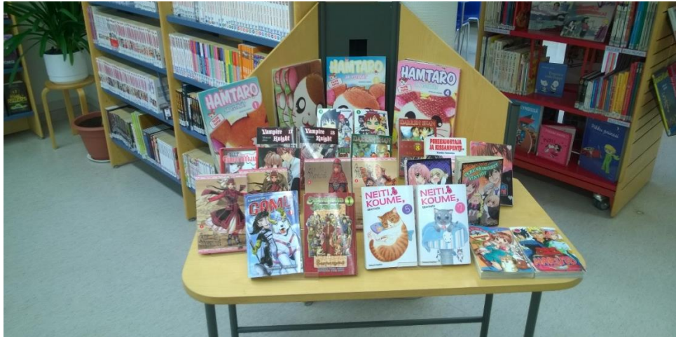
Kuva 6. Manga-esittely Loimaan pääkirjastossa.

Kokonaisten kirjallisuuden lajin sijaan voin esitellä myös yhtä kirjaa/kirjasarjaa ja siihen liittyviä hahmoja. Joidenkin teosten ympärille on noussut suoranaisia ilmiöitä. Tästä hyvä esimerkki on Loimaan pääkirjaston Harry Potter -näyttely (Kuva 7). Näyttely liittyi Harry Potter -päivään, jota vietettiin 5.2.2015. Vaikka J. K. Rowlingin Harry Potterit ovat jo monille tuttuja, aineistoesittely saattaa kuitenkin houkuttaa vielä uusia lukijoita.