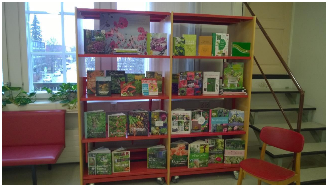
Kuva 4. Loimaan pääkirjaston puutarha-aiheisten kirjojen esittely.

Keväisin usein kirjastoihin koottava aineistoesittely käsittelee puutarhanhoitoa. Vaikka puutarhanhoito on yleinen aihe, se on siitä huolimatta toimiva aihe vuodesta toiseen. Kuitenkaan ei kannatta toistaa esittelyä samanlaisena joka vuosi. Kuvassa neljä on Loimaan pääkirjaston esittely puutarha-teeman tiimoilta ja kuvassa viisi vastaava esittely Oripään kunnankirjastosta. Oripään kirjaston näytellyyn on vaihtelevuuden lisäksi otettu mukaan myös mökkeilystä kertovia kirjoja.