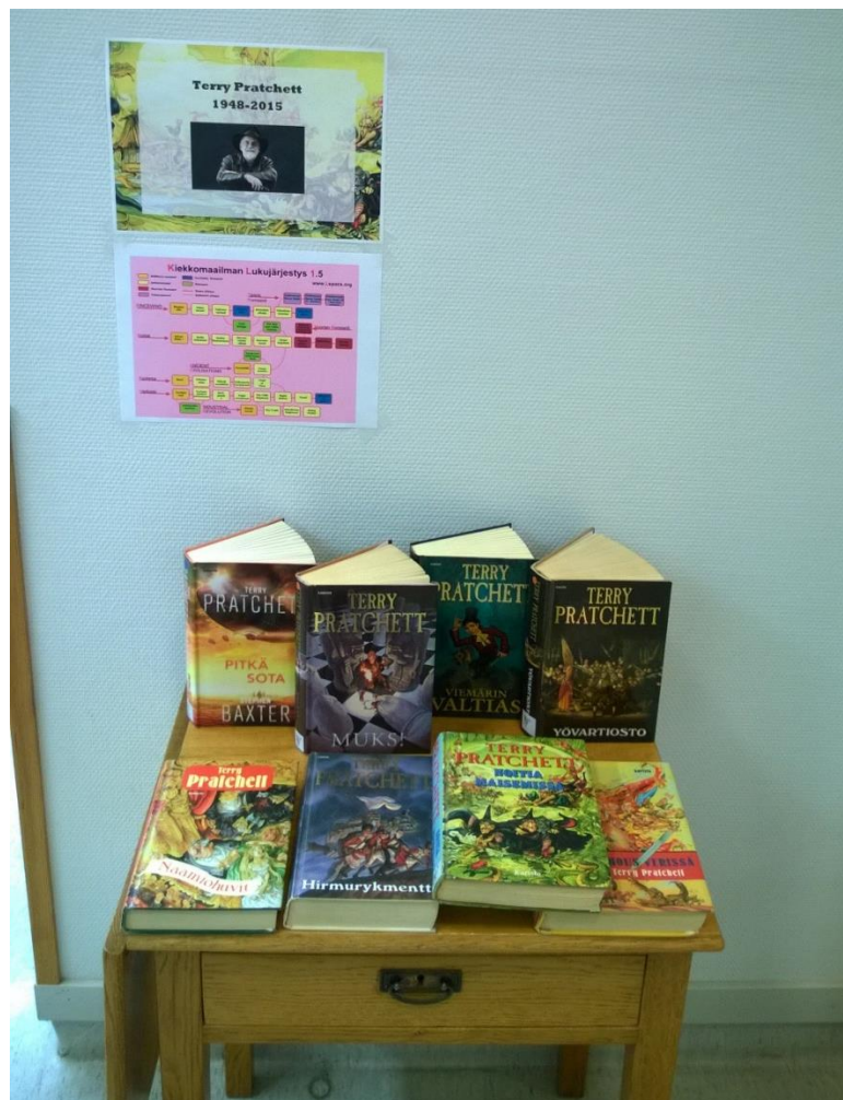
Kuva 3. Loimaan pääkirjaston Terry Pratchett -esittely.