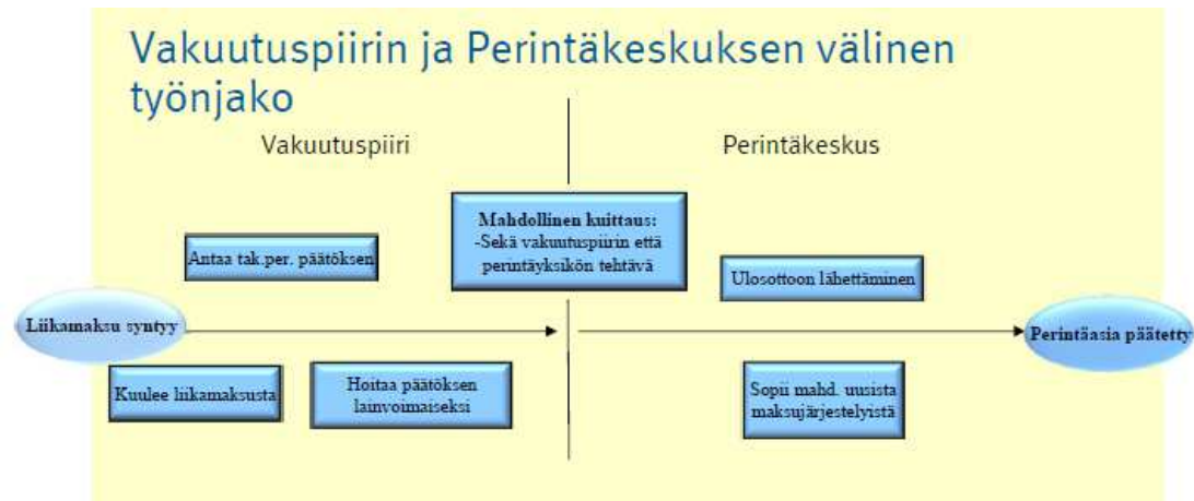
Kuvio 2. Vakuutuspiirin ja perintäkeskuksen välinen työnjako (Etuuksien perintä 2013. N.d.)

nousee 21 päivän kuluttua 2. maksukehotuksen lähettämisestä. Jos perittävää määrää ei ole maksettu takaisin annetussa määräajassa eivätkä Kelan antamat maksukehotukset ole tuottaneet tulosta, Kela antaa takaisinperintäpäätöksen täytäntöönpanon ulosottoviranomaisen hoidettavaksi. (Takaisinperintä N.d.)