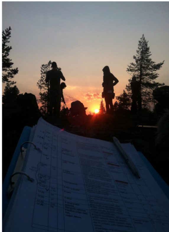
Kuva 7. Retki-lyhytelokuvan yökuvaukset ja call sheet.

Lisäksi tunturi osoittautui hyväksi valinnaksi myös ryhmän ulkopuolisten ulkoilijoiden osalta. Vaikka Käyrästunturi on yleisten vaellusreittien varrella, sai työryhmämme kuvata täysin omassa rauhassaan. Koiviston (2015) mukaan kuvausaikataulu pyrittiin rakentamaan taloudellisen ajattelun perusteella välttämällä turhanpäiväistä edestakaista ajelua kuvauspaikkojen välillä. Tuotannon ollessa pienen budjetin opiskelijaprojekti, oli taloudellisuus avainasemassa koko tuotannon suunnittelun ja toteutuksen ajan.