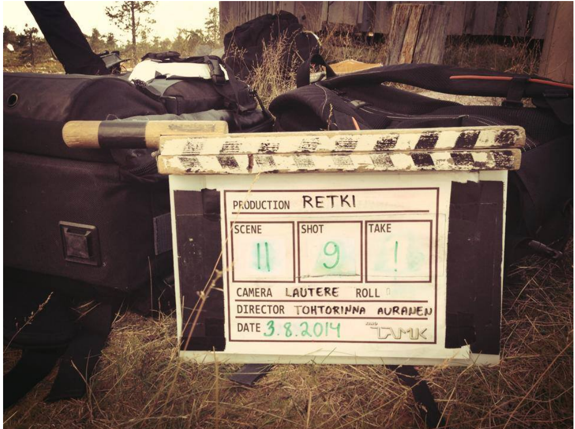
Kuva 6. Retki-lyhytelokuvan klaffitaulu.

nitelmia kannattaa miettiä, sillä yksikin muuttuja voi aiheuttaa tarpeen koko aikataulun uudelleen organisointiin.