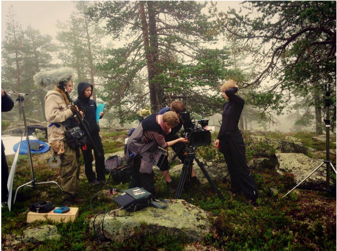
Kuva 8. Retki-lyhytelokuvan kuvausvalmistelut.

Retki-lyhytelokuvatuotannon aikataulus toteutui mielestäni suhteellisen hyvin, joskin kuvausaikataulussa ei kuvauspäivinä pysytty. Kuvaustilanteessa aikataulusta myöhästyessä tapahtuu helposti ns. lumipalloefekti, jolloin asiat lähtevät vyörymään kasvattaen mittasuhteitaan samalla. Aikataulusta myöhästyminen aiheuttaa helposti seuraaville kuvauspäiville lisää myöhästelyä, sillä kuvaamatta jääneet kohtaukset siirtyvät kuvausaikataulussa eteenpäin. Kuvausten edetessä jouduimme muokkaamaan aikataulua ja jättämään kuvia pois välistä, jotta aikataulua saataisiin kurottua kiinni. Loppujen lopuksi saimme kuvattua kaiken tarpeellisen ja koko työryhmä oli lopputulokseen tyytyväinen.