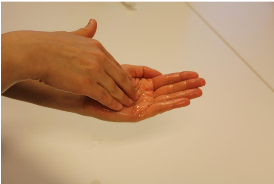
Kuvio 1. Käsien desinfektio.

Käsien desinfektiossa on noudatettava huolellisuutta ja oikeaa tekniikkaa desinfektion onnistumiseksi. Kuviossa 1 suoritetaan sormenpäiden desinfektiota. Olennaista on käsihuuhteen määrä, jonka on oltava vähintään kaksi painallusta käsihuhdetta annostelevasta laitteesta eli noin 3-5 millilitraa. (Infektioiden torjuntaohjeet 2012: 2.1.2.)