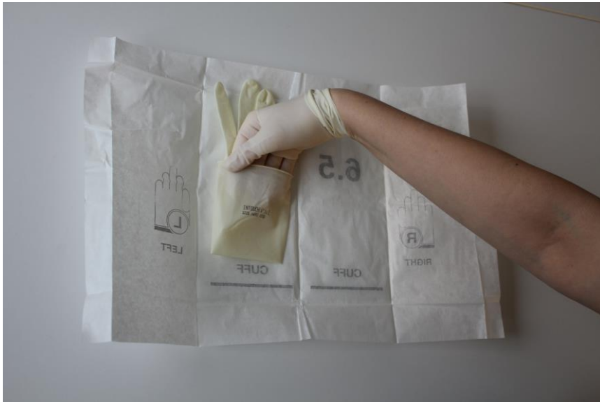
Kuvio 2. Steriilien käsineiden pukeminen.

(Piirtola 2015). Ennen steriilien käsineiden pukemista desinfioidaan kädet, sen jälkeen avataan käsinepakkaus valmiiksi pöydälle (Guidelines on Hand Hygiene in Health Care 2009: 142). Tämän jälkeen suoritetaan kirurginen käsien desinfektio (HUS Infektioiden torjuntaohjeet 2.2). Kun kädet ovat täysin kuivuneet, puetaan steriilit käsineet ohjeiden mukaisesti välttämättä kontaminaatiota (Lukkari ym. 2010: 298). Kuviossa 2 esitetään steriilin käsineen pakkauksesta ottaminen, kun toiseen käteen on jo puettu steriili käsine.