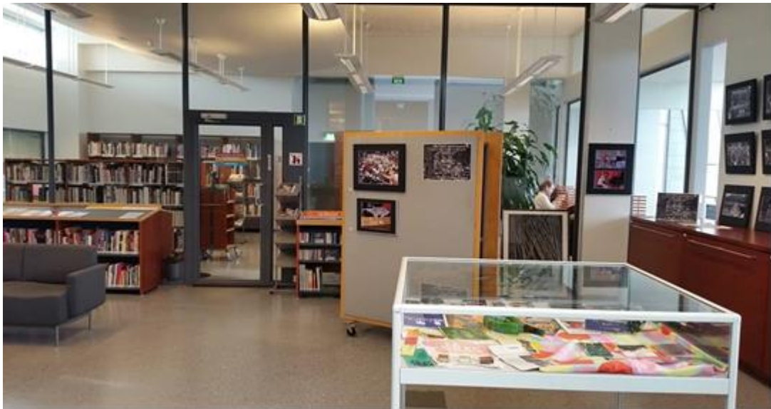
Kuva 9. Schjerfbeck-aineistonäyttelyn myötä kirjaston musiikki- ja taideosastolle lanseerattiin uusi näyttelytila. Kuvassa valokuvanäyttely keväällä 2015.