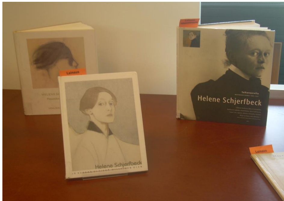
Kuva 8. Lainattavissa oleva aineisto merkittiin oransseilla lapuilla.

Schjerfbeck-aineistonäyttelyn myötä taide- ja musiikkiosastolla lanseerattiin käyttöön uusi tila aineistonäyttelyitä tai pienimuotoisia muita taideaiheisia näyttelyitä varten (Kuva 9). Avara ja valoisa huonetila on osin näköetäisyydellä heti toisessa kerroksessa sijaitsevalle taide- ja musiikkiosastolle saavuttaessa, josta sinne kuljetaan musiikki- ja taideosaston huonetiloja jakavan, siltamaisen väylän kautta.