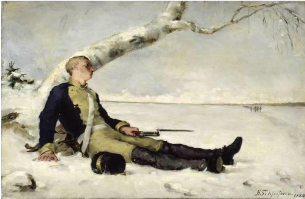
Kuva 1 Haavoittunut soturi hangella (1880) edusti Schjerfbeckin aikana naistaitelijalle sopimatonta aihepiiriä.

Schjerfbeckin elämään kuului vahvasti varhaisista vaiheista asti kokemansa ulkopuolisuuden tunne, joka juonsi juurensa pitkäaikaisesta lapsuusajan sairastelusta. Alkunsa sairauden kierre sai 4-vuotiaana loukkaantumisen seurauksena saadusta lonkkavammasta, joka piti hänet sekä vuoteenomana että erossa läheisistään vuosia. Vamman myötä hänestä tuli pysyvästi liikuntarajoitteinen. Vahvan jälkensä lapsuudessa eletty pitkä sairauskausi jätti Schjerfbeckiin myös henkisesti. (Konttinen 2004, 27–28.) Kuin kohtalon ivana Schjerfbeckin lonkkavamma oli syynä myös nuoruuden kihlauksen purkautumiseen. Schjerfbeck tuli jätetyksi tuntemattoman, englantilaisen taiteilijasulhasen pelättyä kihlattunsa lonkkavaivan olevan tuberkuloottista laatua. Tämän jälkeen Schjerfbeck ei edes harkinnut uutta avioliittoa, vaan valitsi yksinäisyyden, joka ei häntä koskaan jättäisi. (Hämäläinen-Forslund 2001, 94–96.)