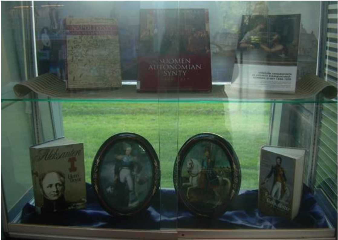
Kuva 13. Hallitsijoiden kuvat ja muut yksityiskohdat vitriinissä toivat esiin kuninkaallista ajan henkeä.