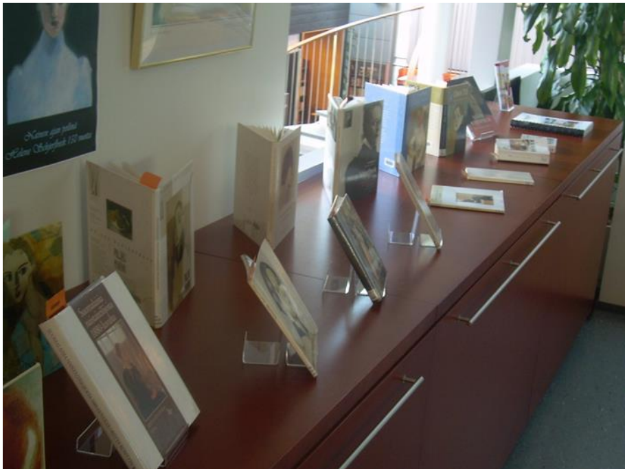
Kuva 4 Schjerfbeck-aineistoa oli saatavilla runsaasti.

tessa epävarmaa, sillä niiden sisältö ei täysin avautunut pelkkien luettelointitietojen avulla. Kaikki teokset tuli ainakin pikaisesti selaten käydä läpi ennen näytteille asettamista, jotta käsillä olevan niteen kunto tuli tarkistetuksi.