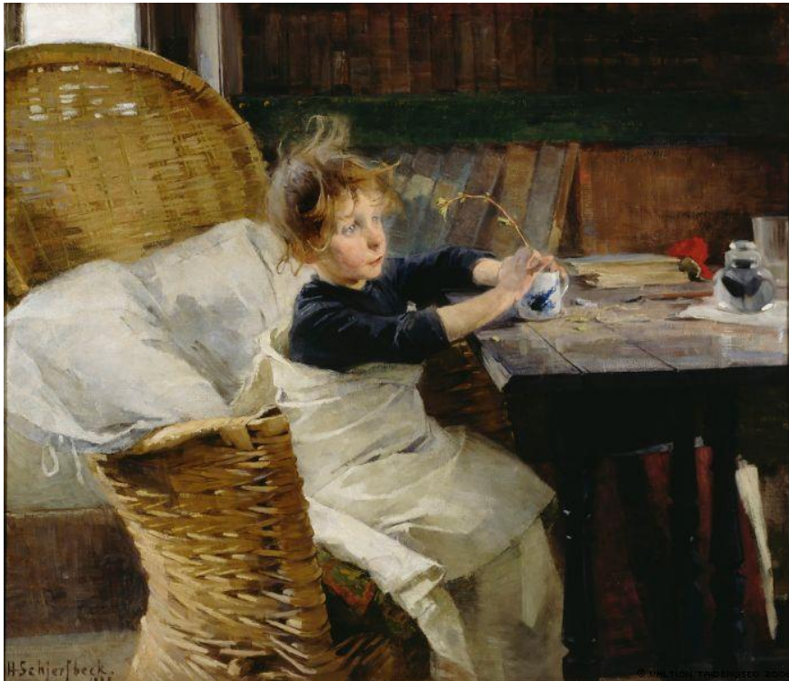
Kuva 2. Toipilaassa (1888) on henkilökohtaisuutta Schjerfbeckin omien kokemusten kautta.

vät taiteilijan lapsuuden traumaattinen vammautuminen ja siihen välillisesti liittynyt myöhempi hylkääminen. (Laurila-Hakulinen 2001, 17.)