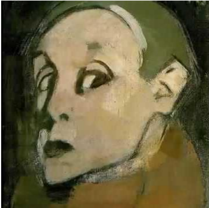
Kuva 3. Omakuva (1935). Omakuvat ovat Schjerfbeckin tunnetuimpia teoksia. (Kuva Youtube 2015.)

Raision kaupunginkirjaston Schjerfbeck-juhlavuoden aineistonäyttelylle annettu nimi ”Nainen ajan peilinä – Helene Schjerfbeck 150 vuotta” valikoitui juuri taiteilijan monipuolista naiskuvausta ajatellen, ja se sisältää samalla viittauksen myös Schjerfbeckin runsaaseen omakuvien maailmaan. Vuosikymmeniä jatkunut omakuvien sarja kertoo katsojalle niin taiteilijan mielenmaiseman muutoksista kuin jatkuvasta tyyllisestä uusiutumisesta.