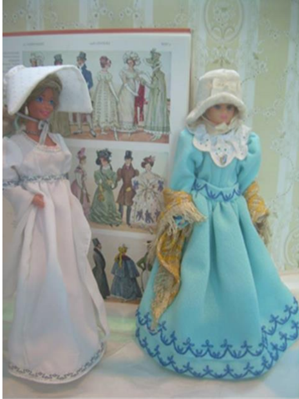
Kuva 11. 1812-tyyliin puettujen nukkien taustalle valikoitui aikalaispuvustoa kuvaava aukeama

Ennen esillepanoa tehtävänä oli kirjoittaa asianmukaiset esittelytekstit Maakunta-arkiston historiallisista teoksista sekä näyttelyn tarkoitusta tukemaan esille laitettava, lyhyt selostus vuoden 1812 tapahtumista ja vaikutuksista (Kuva 12). Tärkeää oli merkitä näkyvästi ja selkeästi esille teosten omistaja eli Varsinais-Suomen maakunta-arkisto. Sovittava oli myös näyttelyjulisteen visuaalinen ulkoasu ja muu tarvittava graafinen materiaali asiasta vastaavan kirjastotyöntekijän kanssa.