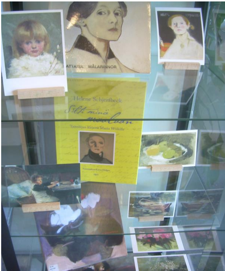
Kuva 5. Taidekortteja ja Schjerfbeck-kirjoja sisältävä vitriini

Aineistonäyttelyt kaipaavat usein oheismateriaalia ollakseen kiinnostavia ja täyttäkseen tarkoituksensa katseenvangitsijoina. Siksi erilaiset yhteistyötahot ja niiden onnistunut löytyminen ovatkin usein kullanarvoista näyttelyiden onnistumisen kannalta (Liutta ym. 2002, 39–41). Kuvataideharrastajat omistavat usein julisteita tai muita painatteita esimerkiksi taidemuseoista ja -näyttelyistä hankittuina. Schjerfbeck-näyttelyn kohdalla eduksi oli lopputyön tekijän taideharrastuneisuus, joka edesauttoi löytämään paikallisen taideyhdistyksen kautta Schjerfbeck-materiaalia omistavia henkilöitä. Yritys tuotti hedelmää, ja näyttelyn ajaksi lainaan saatiin sopivia taidekortteja ja -julisteita Schjerfbeckin teoksista.