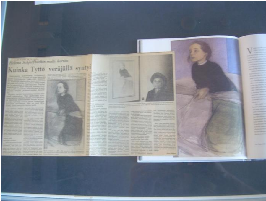
Kuva 6. Turun Taidemuseon kokoelmista löytyi näyttelyyn muun muassa vanha lehtijuttu erään Schjerfbeckin maalauksen synnystä.

Ennen näyttelyn rakentamista kirjoitettiin näyttelyn osaksi esille tuleva, Schjerfbeckin elämää ja uraa käsittelevä esittelyteksti kirjastoasiakkaita varten. Lisäksi oli sovittava erillisen näyttelyjulisteen ulkoasu teksteineen ja kuvineen kirjaston visuaalisesta viestinnästä vastaavan työntekijän kanssa. Näidenkin tuotosten lopullinen paikka näyttelyssä tuli miettiä tarkkaan pystytysvaiheessa.