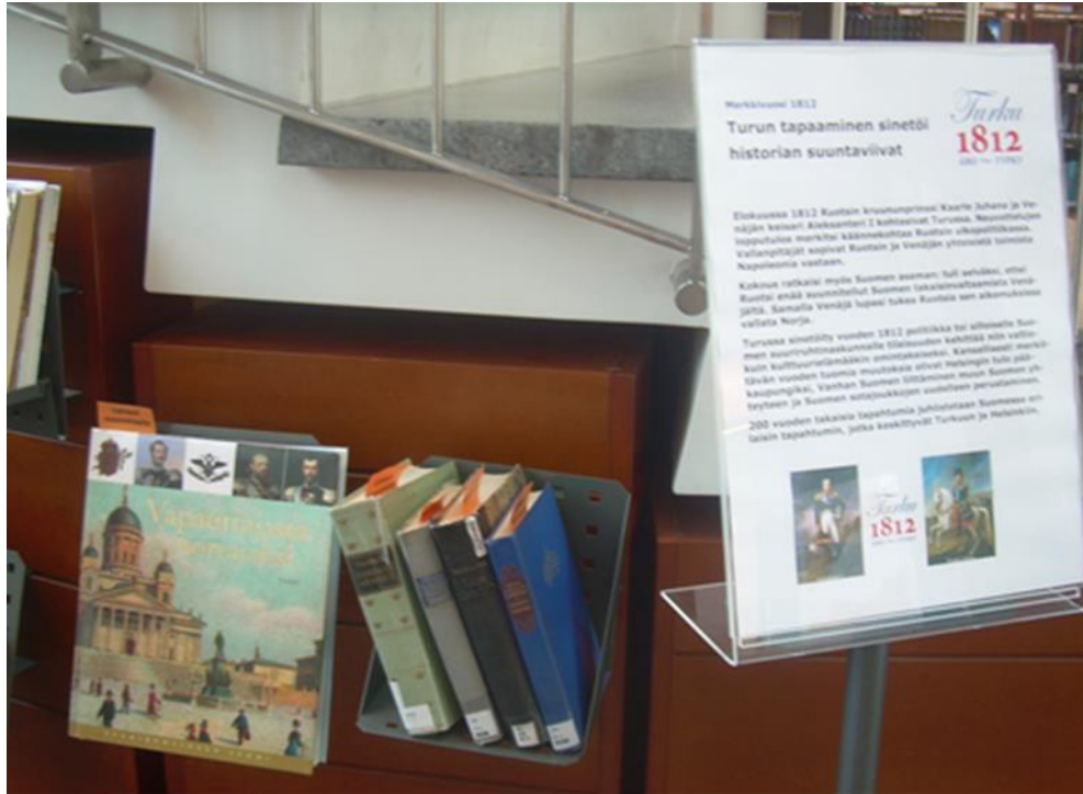
Kuva 12. Näyttelyn aihetta katsojalle avaava teksti ja lainattavissa olevia teoksia vuoden 1812 aihepiiristä.

Oheismateriaaliksi tulostettiin internetistä löytynyt empiresetappikuvio elävöittämään nukellista vitriinitasoa sekä taiteilijoiden aikalaiskuvausta vuodesta 1812, myös vitriinien taustaseinää elävöittämään. Aleksanteri I:n ja Kaarle Juhanan tulostetut aikalaiskuvat pääsivät antiikin kaltaisiin kehyksiin, ikään kuin kunnia-paikalle vitriiniin (Kuva 13). Kirjaston aineistonäyttelyjen materiaalin säilytysva-rastosta löytyi sattumalta sopivaksi osoittautuva, kiiltävän sininen kankaanpala, joka sopi hyvin hallitsijoiden kuvien hyllytasoa koristamaan. Antiikkikehysten jäljitelmät löytyivät lopputyön tekijän läheiseltä ja lunastivat paikkansa kunin-kaallista arvokkuutta luomaan.