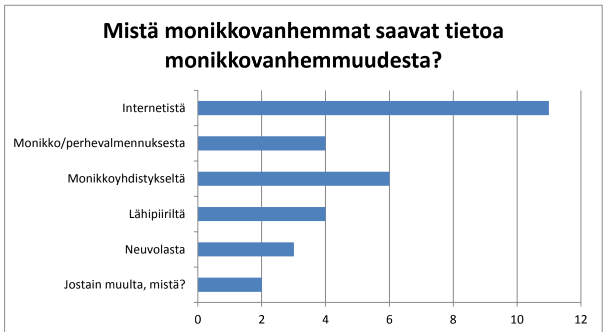
Kuvio 1. Monikkoperheiden tiedonsaanti

Kyselyyn on vastannut 12 perhettä, joista lähes jokaisessa on kaksi vanhempaa. Perheissä on keskimäärin 2,8 lasta vaihdellen kahdesta viiteen. Kyselyyn vastanneiden perheiden monikkolasten keski-ikä on 3,25 vuotta. Lasten iät vaihtelevat yhden ja kahdeksan vuoden välillä.