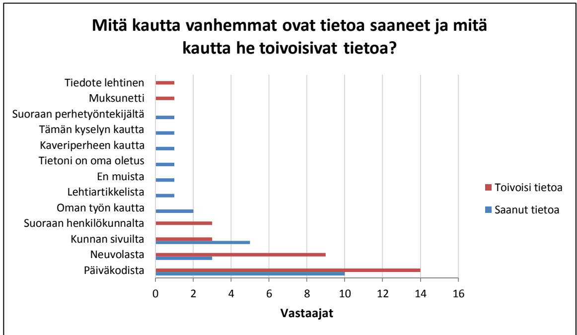
Kuvio 5. Vertailu mitä kautta vanhemmat ovat saaneet tietoa ja mitä kautta he toivoisivat tietoa.

Jos vanhempien vastauksia lähestyy sitä kautta haluaako vanhemmat mieluiten etsiä tietoa itseksensä vai haluavatko he tietoa kanssakäymisessä ja vuorovaikutuksessa muiden kanssa, niin selkeästi enemmän vastauksista löytyy toive saada tieto toiselta ihmiseltä. Neuvolasta ja päiväkodista saatuun tietoon liittyy useimmiten jonkinlainen yhteys myös työntekijään. Muutama vastaaja oli maininnut henkilökunnan ihan erikseenkin, mutta myös päiväkodin tai neuvolan kautta tietoa haluavien vastauksista henkilökunnan rooli tuli esille esimerkiksi seuraavasti: