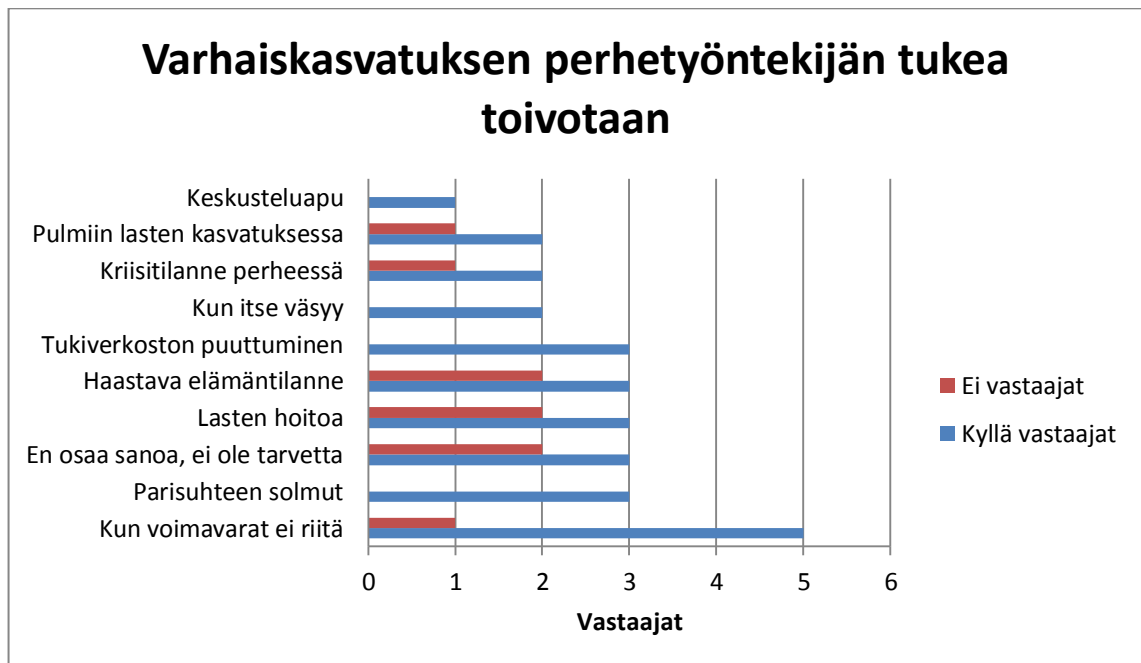
Kuvio 6. Missä tilanteissa toivoisit saavasi tukea Varhaiskasvatuksen perhetyöntekijältä?

vastaajia tässä kysymyksessä oli 69 % (20/29) vanhempaa. Tukiverkoston puuttuminen nousi esiin kolmen vanhemman vastauksissa. Kasvatuksellisissa ongelmissa sekä perhettä kohdanneessa kriisi tilanteessa tuki oli myös toivottavaa. Vanhempien omien voimavarojen puuttuminen nousi esiin 21 % (6/29) vastaajalla. Jos tilanne perheessä on haastava, voi käydä niin että perheen voimavarat unohtuu ja keskitytään ongelmien ympärille. Työntekijällä on tärkeä rooli nostaa esiin toimivat asiat. On helpompaa vahvistaa toimivia asioita, kuin poistaa toimimattomia. (Vilén, Seppänen, Tapio & Toivanen 2010, 237.) Vastauksista nousi esiin myös ennaltaehkäisevän työn merkitys ja tukea toivottiin ajoissa, ennen isoja kriisejä. Perhetyöntekijän toimenkuva on moniulotteista ja ennaltaehkäisevään työhön kuuluu voimavarojen tukeminen. Sosiaalihuoltolaissa sanotaan, että lasten kasvuun ja kehitykseen, perhe-elämään, ihmissuhteisiin ja sosiaalisiin taitoihin liittyvää arviointia, ohjausta, asiantuntijaneuvontaa ja muuta tukea on oltava kunnassa tarjolla (Sosiaalihuoltolaki 1301/2014 3:26 §).