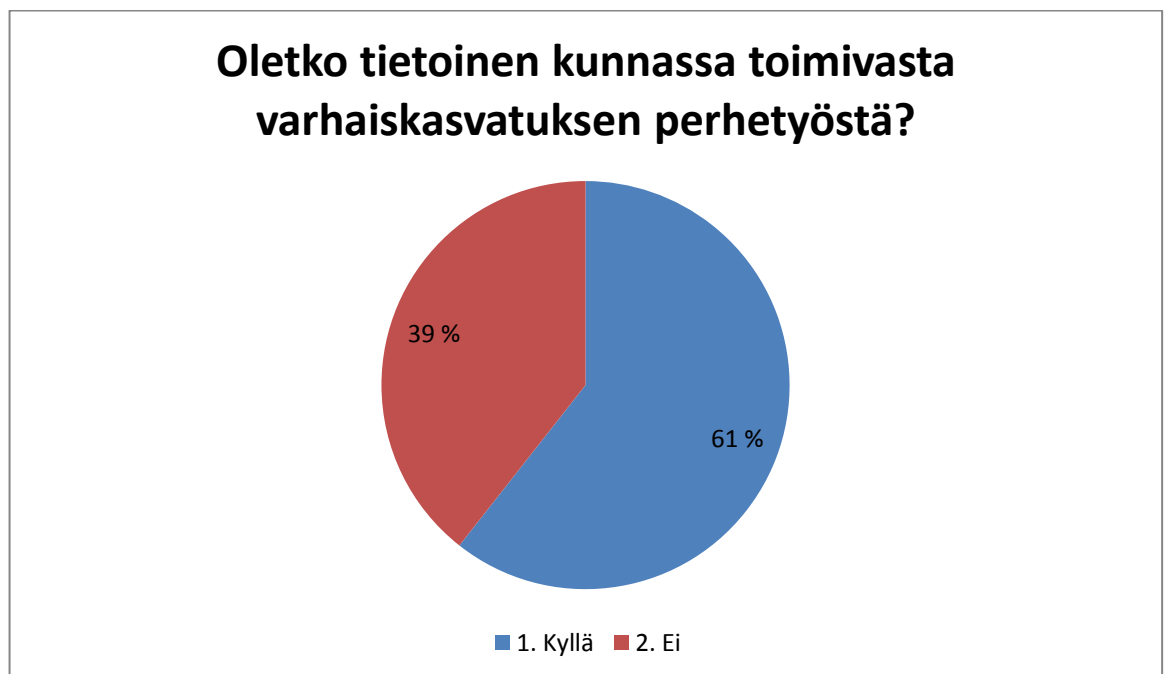
Kuvio 1. Vanhempien tietoisuus varhaiskasvatuksen perhetyöstä

Kysymyslomakkeen ensimmäisessä kysymyksessä kartoitimme selkeillä kyllä tai ei vastauksilla, onko vanhemmilla tietoa kunnassa toimivasta varhaiskasvatuksen perhetyöstä.