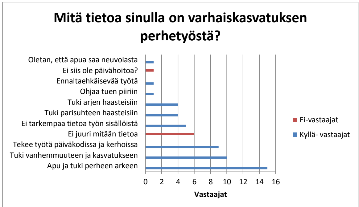
Kuvio 2. Mitä tietoa vanhemmilla on varhaiskasvatuksen perhetyöntekijän työstä?

Seuraavaan kuvioon on koottu lukumäärittäin ne perhetyöntekijän työhön kuuluvat tehtävät, jotka vanhempien vastauksissa tulivat ilmi. Sinisellä näkyvät vastaajat, jotka olivat tietoisia varhaiskasvatuksen perhetyöstä ja punaisella vastaajat joilla tietoa ei ollut.