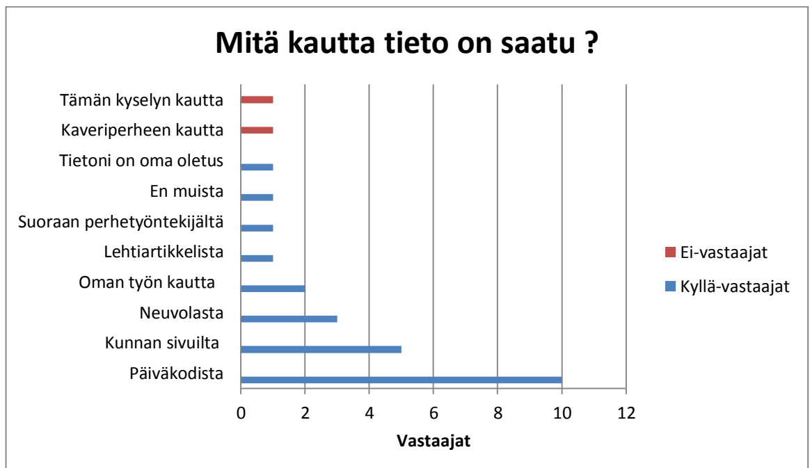
Kuvio 3. Mitä kautta vanhemmat ovat saaneet tietoa?