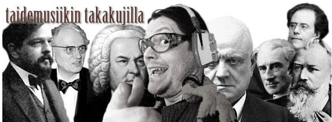
Kuva 1. Kuunteluryhmä WaGaWan taustakuva.

Maaliskuussa testasin ensimmäistä prototyyppiä kahden edellä mainitun henkilön kanssa. Kävi ilmi, että äänitteen kataloginumeron kopiointi ja liittäminen Naxos Music Libraryn hakukenttään oli älypuhelimella vaivalloista. Ratkaisu oli kappalekohtainen suora linkki, jonka tosin pystyin antamaan vain Vaski-asiakkaille. Kirjoitin Naxos-ohjeet uusiksi. Graafikkoni toivoi myös Spotify-linkkejä. Tutorini hyväksyi Spotifyn käytön. Loin maaliskuussa myös lopullisen, aluksi salaisen Facebook-ryhmän. Graafikkoni työsti taustakuvan.