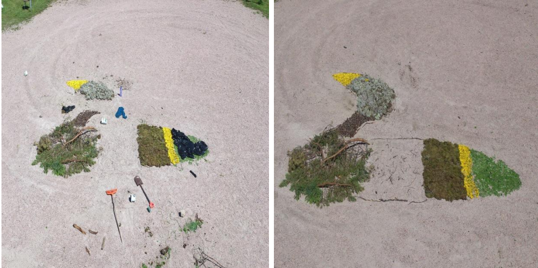
KUVIO 5. Ympäristötaidetta tekovaiheessa ja valmis joutsen.