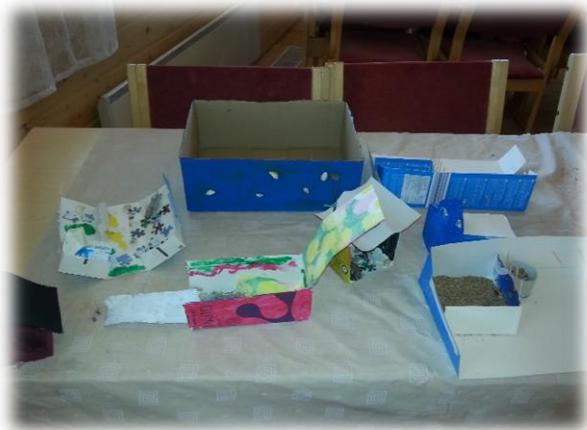
KUVIO 2. Oma turvapaikka, kierrätysmateriaalista tehtyä