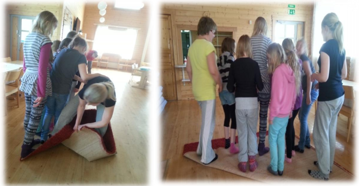
KUVIO 7. Kuinkas tämä matto käännetään? Näin se hoituu!

kaupungin, joka muodostui kaupasta, kirjastosta, uimarannasta, puistosta, rautatieasemasta, omakotitalosta, hotellista sekä kerrostalosta. Loppupäivä meni töiden rakentelussa ja viimeistelyssä. Tyttöillä oli enemmän vapaata aikaa juttelulle ja omalle leikille. Päivän päätteeksi oli jälleen tunnelmapiiri nallekorttien avulla.