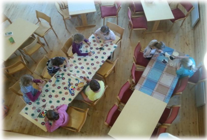
KUVIO 6. Taikataikinasta saa aikaan monenlaisia eläimiä.

män mitä olimme suunnitelleet. Tytöt maalasivat vielä edellisenä päivänä tekemänsä taikataikina eläimet. Päivän lopuksi kokoontuimme punaiselle matolle nallekorttien kanssa.