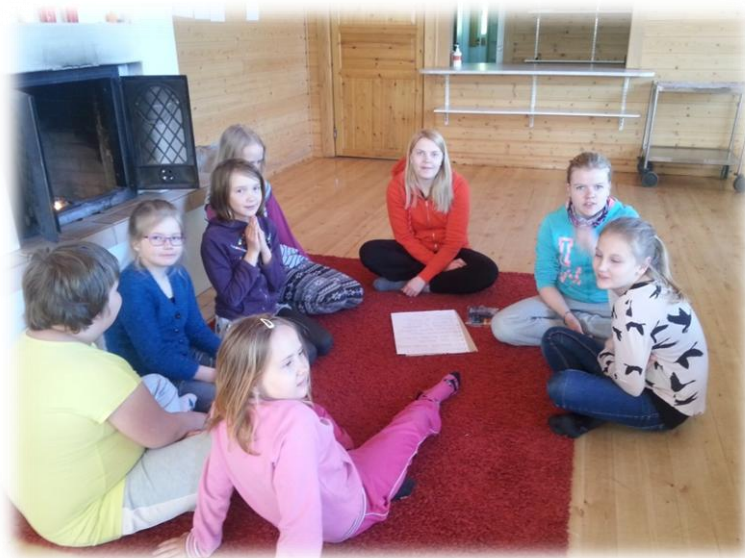
KUVIO 3. Kokoontuminen punaiselle matolle

Pyssyhovissa järjestelimme materiaalit ja tarvittavat työvälineet valmiiksi paikoilleen ja sisustimme paikkaa hieman kotoisammaksi matolla, liinoilla ja kynttilöillä. Takan eteen toimme punaisen lankamaton, jossa oli tarkoitus kokoontua päivän aluksi ja päätteeksi. Teimme vielä puutelistaa tarvittavista tavaroista ja kävimme läpi viikon ohjelman sekä listan leiriläisistä. Leiriläisiä oli kahdeksan 9-13 – vuotiasta tyttöä. Poikia ei valitettavasti leirille osallistunut yhtään.