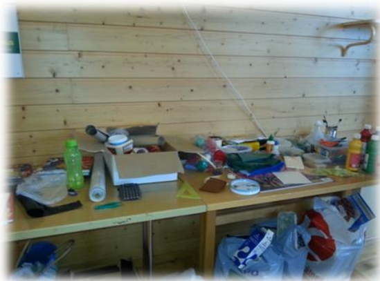
KUVIO 1. Käytettävissä oleva materiaali

Neljännän päivän teema oli minun vahvuuteni ja tavoitteina ovat rohkeus ilmaista itseä sellaisena kuin on ja positiivinen kuva itsestä. Aloitimme aamun leipomalla pullaa. Varsinainen työ oli oman kuvan piirtäminen ja täyttäminen paperimosaiikkiteknikalla. Tarkoituksena oli tuoda esille, että kukaan meistä ei ole täydellinen, vaan jokaisesta löytyy rosoisuutta ja epäsymmetrisyyttä. Päivän lopuksi kirjoitimme positiivisia asioita ensimmäisenä päivänä piirretyn oman kuvan ympärille. Tämän harjoituksen tarkoituksena oli, että jokaiselle jää positiivinen kuva itsestä. Viimeisen päivän kunniaksi grillasimme ja herkuttelimme.