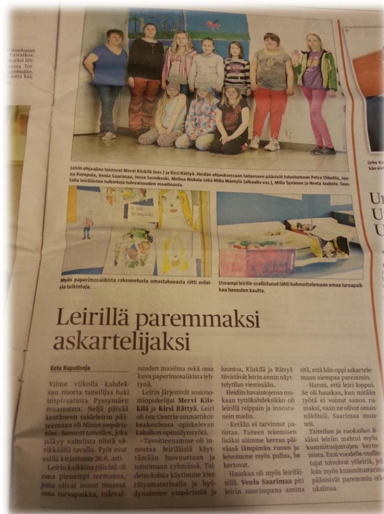
KUVIO 8. Juttu Nivala-lehdessä 17.6.2015

leppoisaa ja tytöt kertoivat tuntemuksiaan leiriltä. Leiriä oli vielä parisen tuntia jäljellä ja siirryimme sisätiloihin. Haimme seinältä ensimmäisenä päivänä piirretyt omat kuvat, joihin jokainen kirjoitti toisistaan jotain positiivista. Jaoimme tytöille diplomit leirille osallistumisesta. Tämän jälkeen siivosimme sisällä sekä ulkona ja pakkasimme autoon taideteokset ja ajoimme kirjastolle pystyttämään näyttelyyn. Nivalan paikallislehti kävi tekemässä leiristä jutun ennen kuin suuntasimme kotiin. Näyttely sai olla kirjaston aulassa reilun viikon, jonka jälkeen kävimme purkamassa sen.