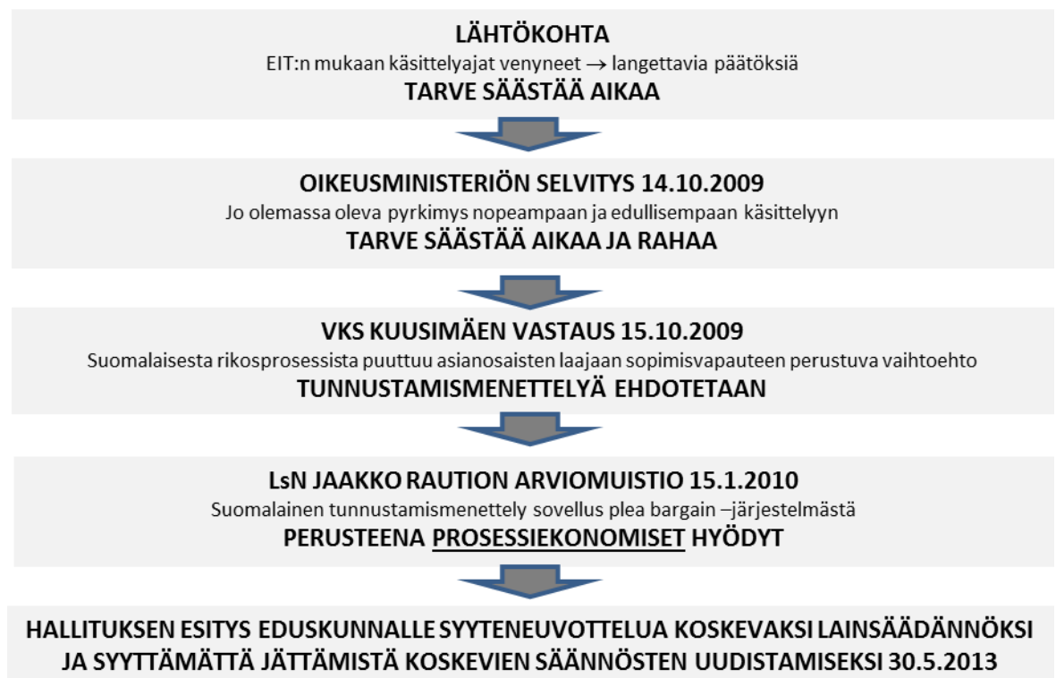
Kuva 1. Syyteneuvottelujärjestelmän lähtökohdat ja tavoitteet.

Syyteneuvottelujärjestelmän käyttöönottoa pohdittiin Suomessa ensimmäisen kerran vuonna 2001 VKSV:n asettamassa työryhmässä. Silloin työryhmän kanta oli, että syyteneuvottelu ei sovellu Suomen säädösoikeudelliseen järjestelmään. Tuomioistuinelaitoksen kehittämiskomitea päätyi samaan lopputulokseen vuonna 2003. Myöhemmin oikeusministeriön työryhmä ehdotti tarkoin rajattua syyteneuvottelun mallia, joka eteni hallituksen esitykseksi HE 58/2013 vp. (HE 58/2013, 4) Tunnustamismenettelyn mahdollistavat lain muutokset tulivat voimaan 1.1.2015.