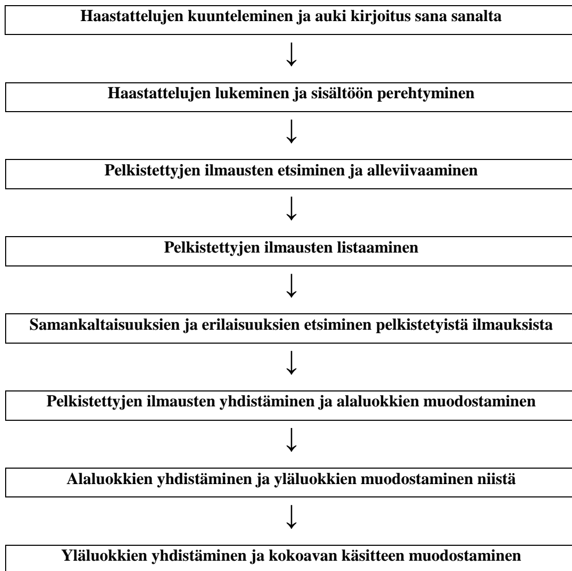
KUVIO 1. Sisällönanalyysin menetelmätapa (Tuomi, Sarajärvi 2013, 109)

oleellista tutkimamme ilmiön kannalta. Tavoitteenamme oli saada selville, mitä haastattelvat todella tarkoittavat sanomallaan, ja vastaavatko he todella tutkimuskysymyksiimme. Lisäksi pyrimme saamaan selville, tuottavatko he muuta tutkimuksen aihepiiriin liittyvää tärkeää informaatiota.