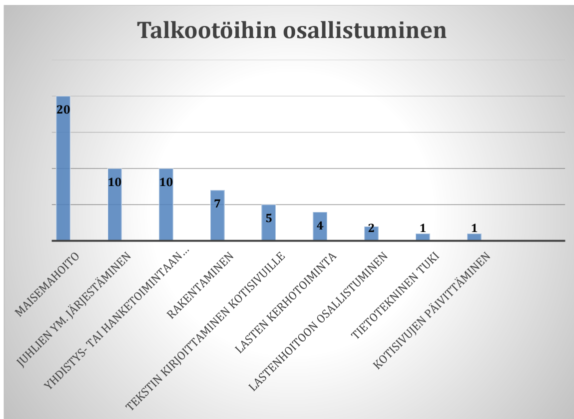
Kuvio 4. Talkootöihin osallistuminen

Muita ehdotuksia olivat: kirkolliset juhlat/toimitukset ja VPK toiminta