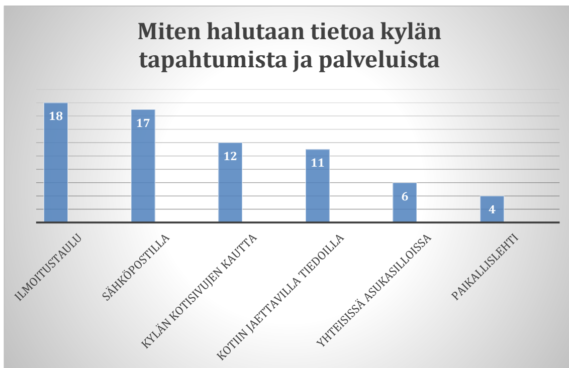
Kuvio 3. Tiedottaminen kylän tapahtumista ja palveluista

Ehdotuksena tuli myös radiossa esimerkiksi Kajaus kanavalla