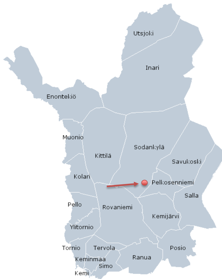
Kuvio 1. Luoston sijainti kartalla. (Kela 2015.)

Lähin rautatieasema löytyy Kemijärveltä, mutta sinne saapuu ja sieltä lähtee juna vain kerran päivässä. Rovaniemellä on toinen vilkkaampi rautatieasema (VR 2015) ja Rovaniemellä on myös lähin toimiva lentokenttä (Finnair 2015; Lento- paikat.fi 2015). Matka Lapin läänin pääkaupungista Rovaniemeltä Luostolle on noin 100 kilometriä ja Sodankylään matkaa on noin 30 kilometriä (Google maps 2015). Lähimmät kaupunkitason palvelut löytyvät Kemijärveltä, noin 50 kilometrin päästä Luostolta (Luosto 2015).