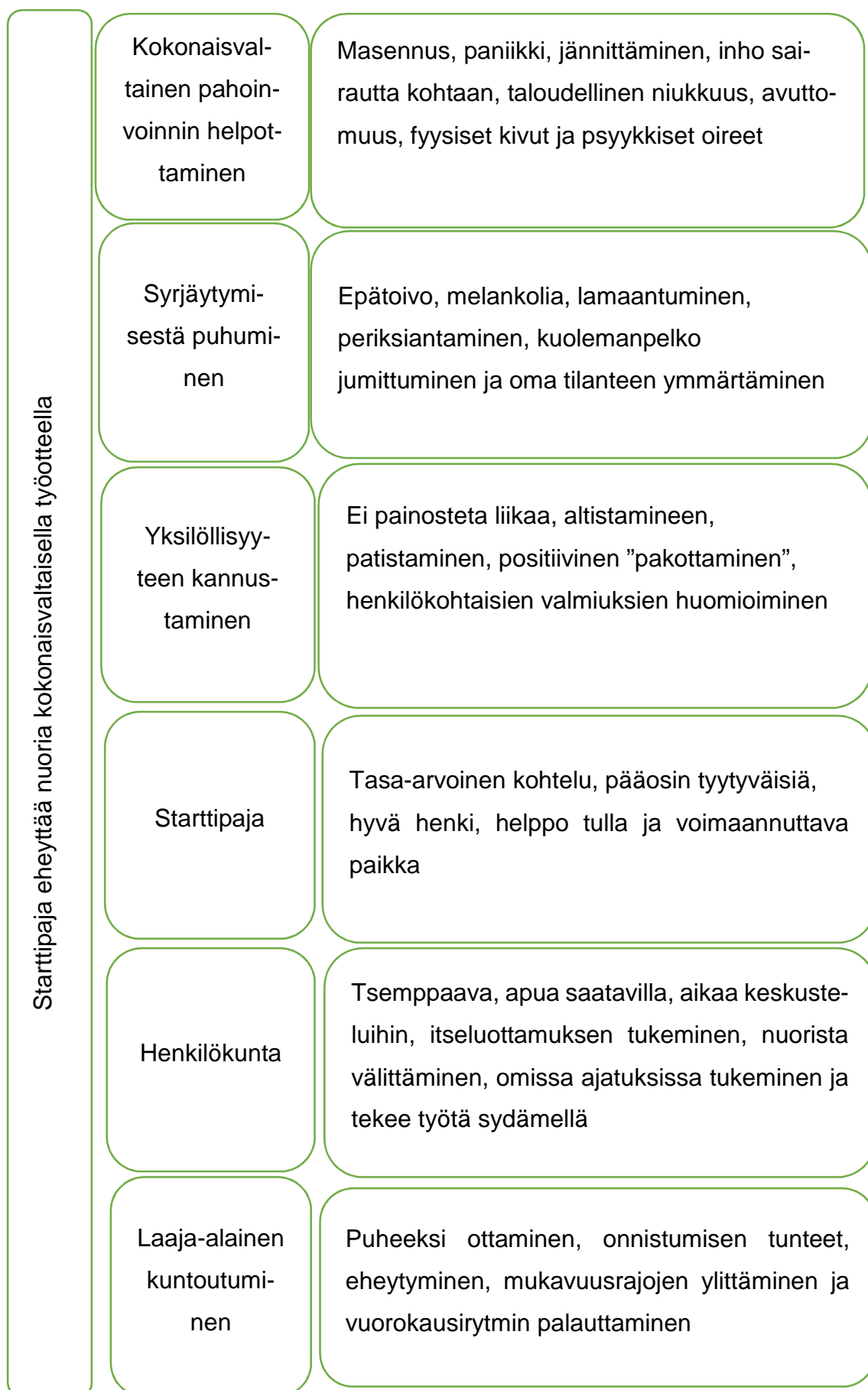
Kaavio 1: Yksinäisyyteen vaikuttavat tekijät